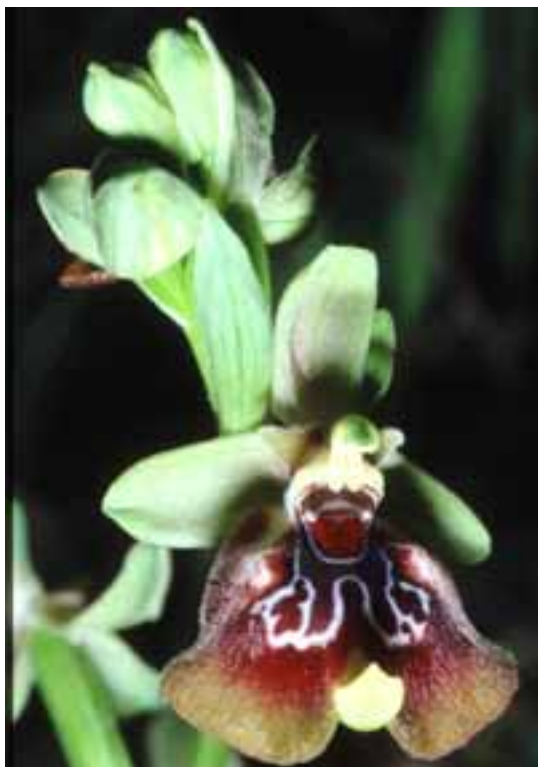
Ophrys oxyrhynchos Passo di Pantanelle