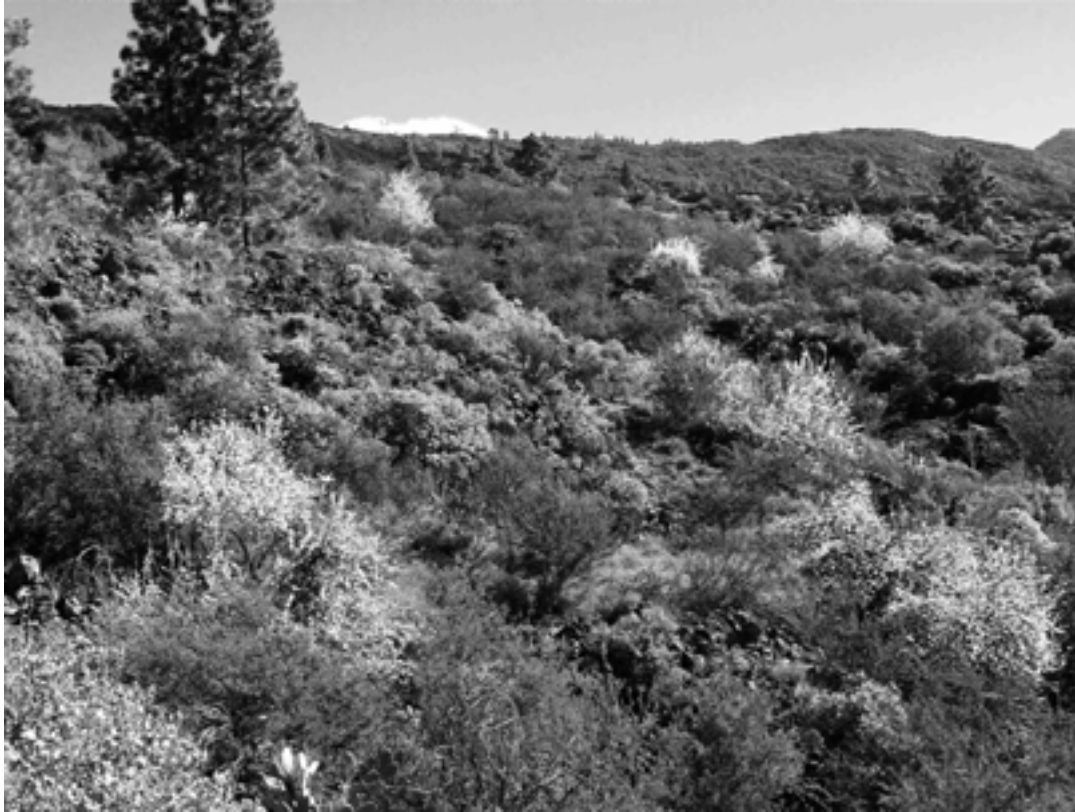
Los Hoyos, Guia de Isora

Zwei Populationen befinden sich in der Gemeinde Santiago del Teide. Die grössere erstreckt sich vom Valle de Arriba bis über Santiago Dorf (Holotypus) nach El Moledo und Las Manchas in Höhen von 800 m bis 1100 m.