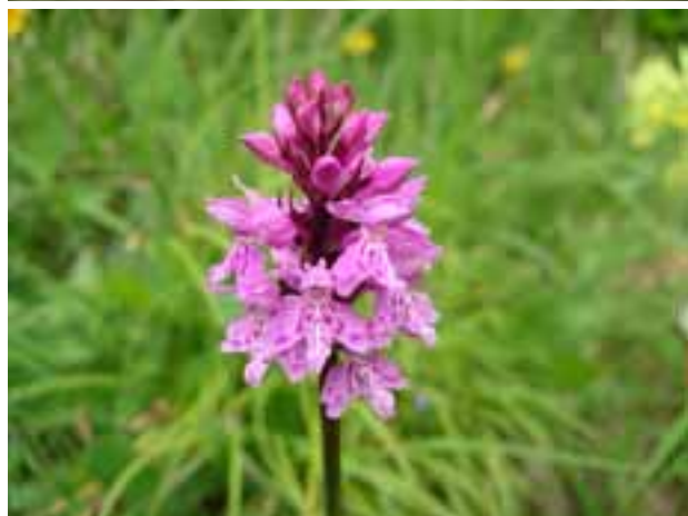
Pinguicula vulgaris Gemeines Fettblatt Dactylorhiza fuchsii Fuchs Fingerwurz