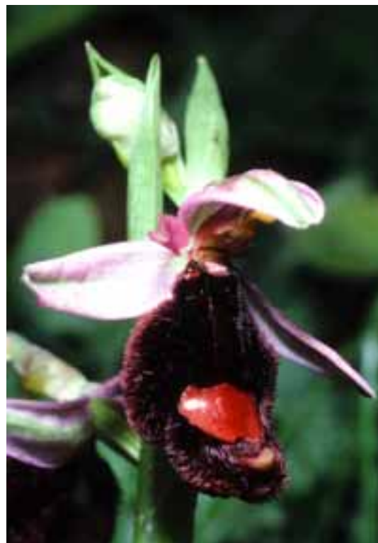
Ophrys bertolonii Ficuzza Si