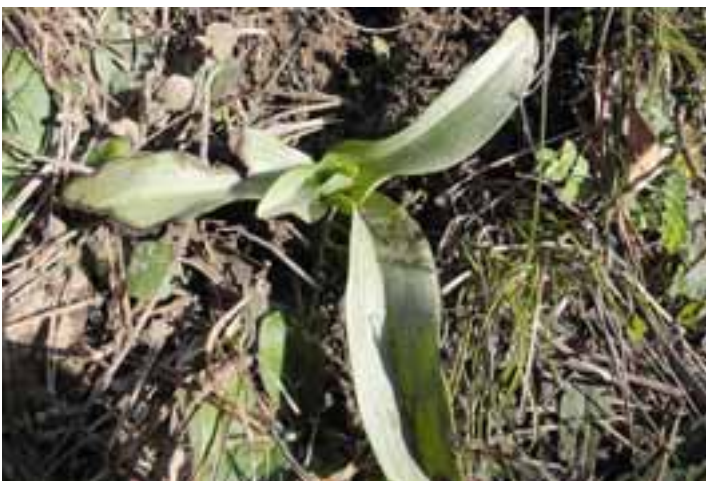
Ophrys apifera (GG)