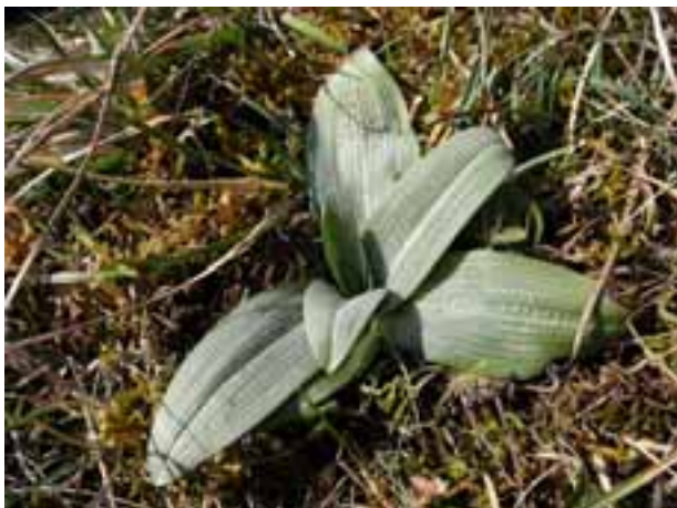
Ophrys araneola (GG, RC)