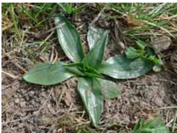
Spiranthes spiralis (RC)