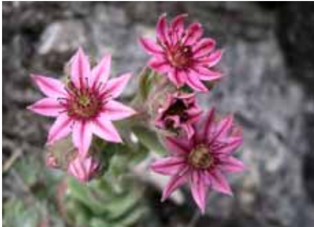
Sempervivum arachnoideum Spinnwebhauswurz