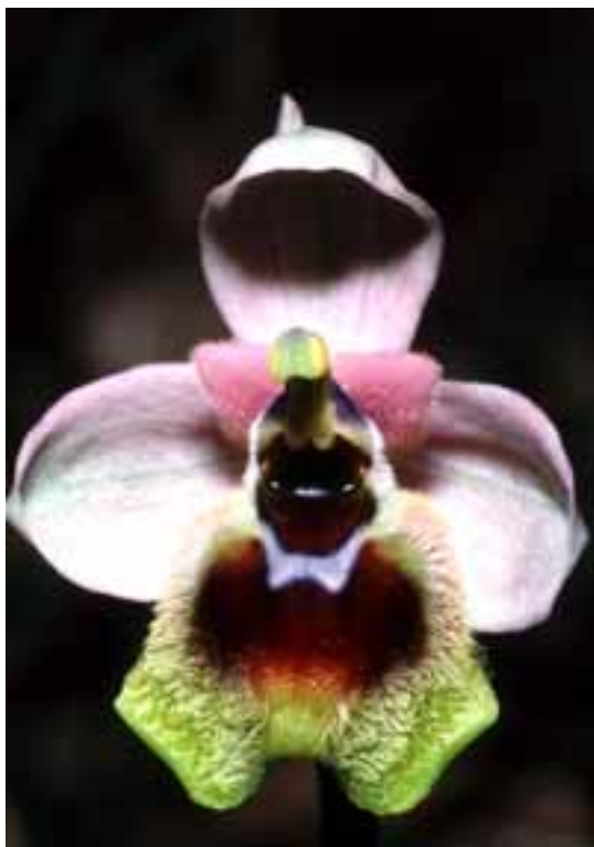
Ophrys tenthredinifera Ficuzza Si