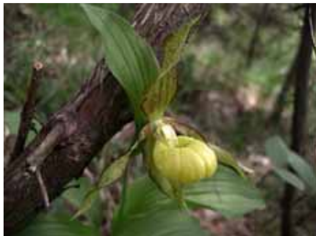
Cypripedium calceolus - Frauenschuh