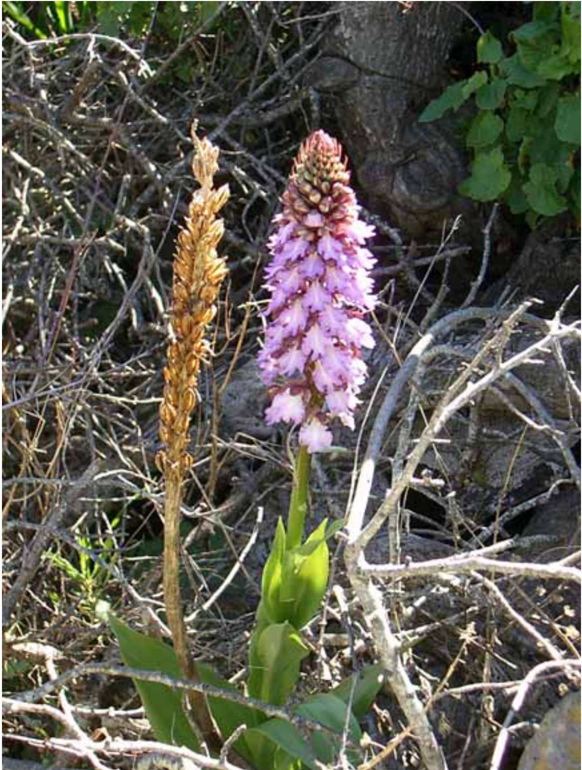
Blütenstand mit Samenstand Vorjahr