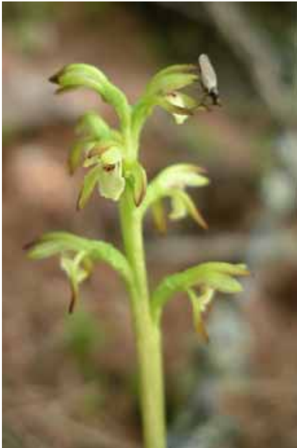
Corallorhiza trifida - Korallenwurz