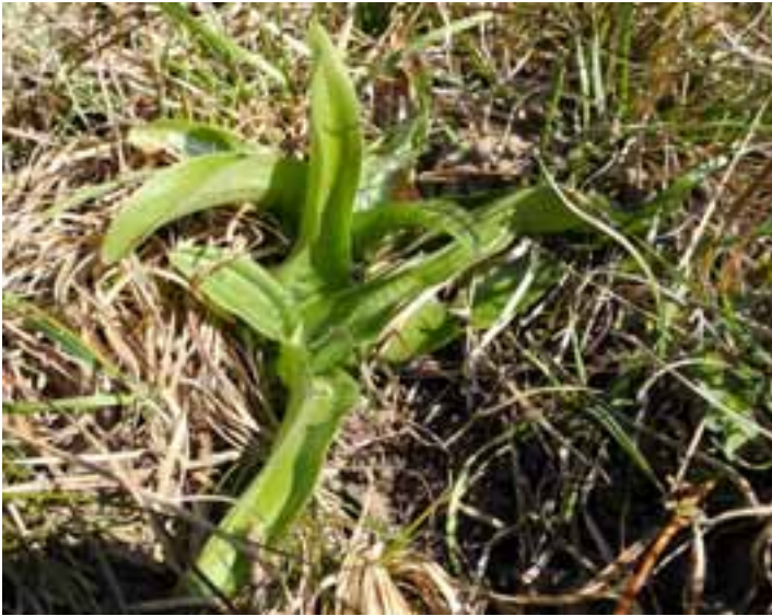
Aceras athropophorum (GG)