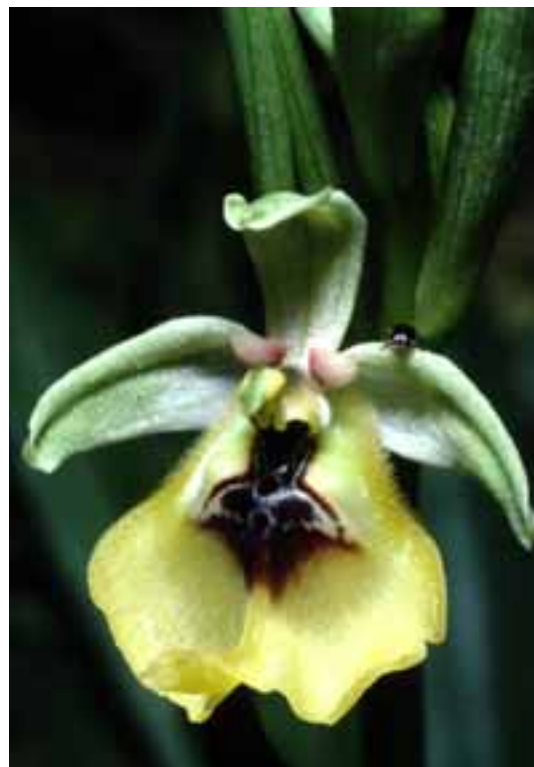
Ophrys lacaitae Ferla Si