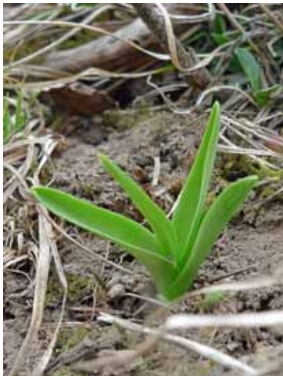
Gymnadenia conopsea (RC)