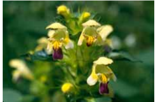
Galeopsis speciosa Bunter Hohlzahn