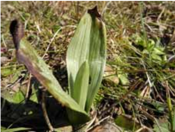
Ophrys insectifera (GG, RC)