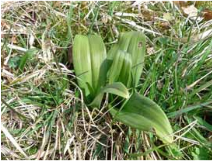
Himantoglossum hircinum (RC)