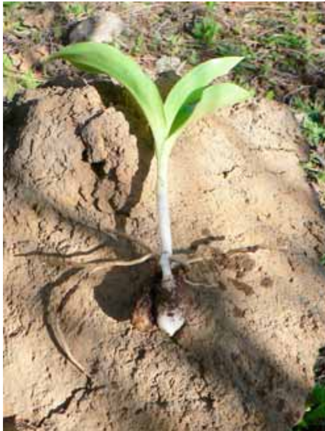
Barlia metlesicsiana Gesamtpflanze