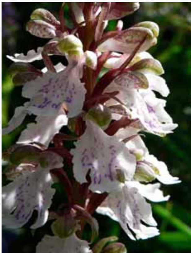
Seltene weisse Form