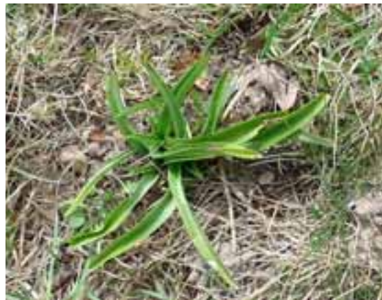
Anacamptis pyramidalis (GG, RC)