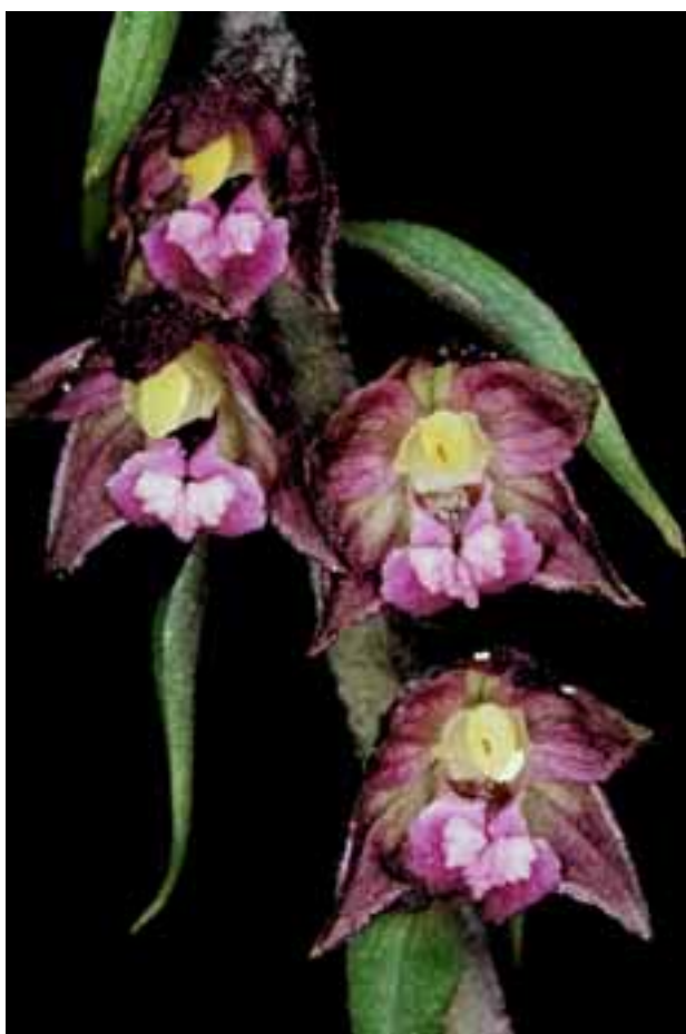
Epipactis atrorubens Braunrote Ständelwurz