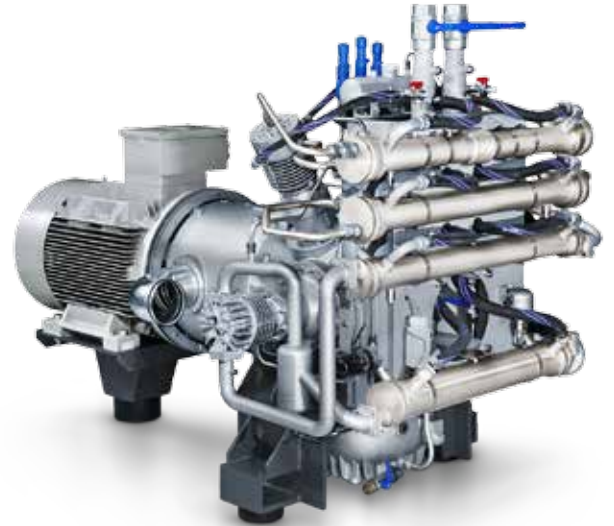
Kompressoranlage GIB 26