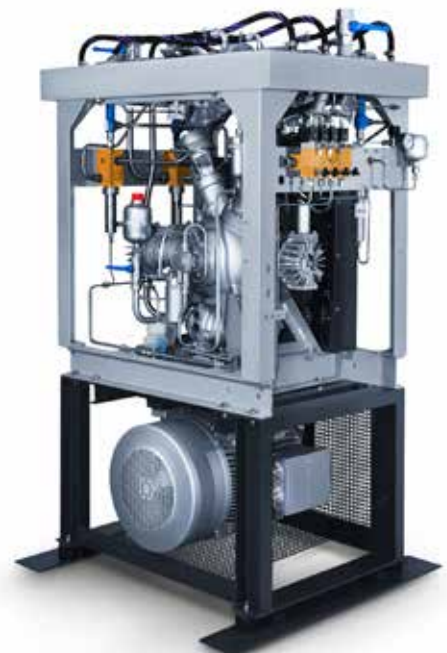
Kompressoranlage GIB 23

Baureihe BK 23: vertikale Bauweise, Keilriemenantrieb; auch luftgekühlt erhältlich Baureihe BK 24, BK 26, BK 52: horizontale Bauweise, direktgekuppelt