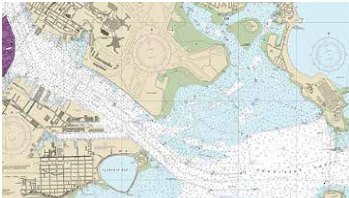
National Oceanic and Atmospheric Administration map

No todas las instalaciones portuarias ofrecen un blanco lucrativo. Es probable que los puertos comerciales estén más extendidos pero seguirán dependiendo de canales de navegación dragados para un tráfico de barcos grandes. El puerto de Boston, aunque ya no es una instalación naval, ha sido un puerto con mucho tráfico desde la década de 1680 y tiene un largo historial de bloqueo (fig. 3). 19 Tiene dos canales de navegación paralelos de entrada y salida, de 1200 pies de ancho cada uno con una profundidad dragada de 40 pies de promedio. Al este de Deer Island, los accesos se abren a tres canales de navegación de aguas profundas y después a aguas sin restricciones. El uso de técnicas de minado aéreas fuera de las defensas de artillería antiaérea del puerto es viable pero requiere mucha munición. El empleo de Quickstrike-ER para cerrar los canales dobles entre el aeropuerto Logan y Fort Independence requeriría aproximadamente solo el 10 por ciento de las minas necesarias para minar los accesos al puerto.