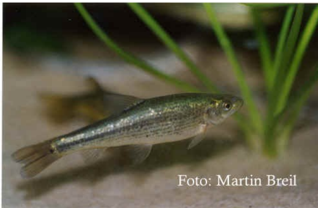
Laichreifes Weibchen der Anatolischen Streifenbarbe

Anatolische Streifenbarben scheinen Nahrungsspezialisten zu sein. Sie leben zu einem Großteil von pflanzlichem Aufwuchs (Algen) auf Steinen, Wasserpflanzen, Aquarienscheiben etc., den sie mit Hilfe des bereits erwähnten Hornbelags auf Ober- und Unterkiefer zügig abweiden. Diese Art von Becken- und Pflanzenpflege bekommt der Unterwasserflora meines 240 Liter Beckens bestens. Störende Algenbeläge haben bei H. kemali kaum eine Chance. Empfehlenswert ist die Haltung in einer Gruppe von mindestens 4-6, besser sogar 10 und mehr Tieren. Erst dann zeigen die Fische ohne Scheu ihr kollektives Schwimm- und Weideverhalten. Es macht wirklich Spaß ihnen dabei zuzusehen. Einzeltiere bleiben scheu. Insgesamt sind diese Fische Allesfresser. Bei mir fressen sie u.a. gefrostete rote Mückenlarven, zermahlene Bachflohkrebse, Tubifex und Tablettenfutter. Flockenfutter und anders Futter nehmen sie im Gegensatz zu den Jungfischen niemals direkt von der Wasseroberfläche, sondern erst nachdem es zu Boden gesunken ist.