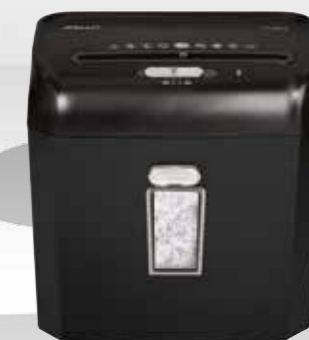
RPX612 / RPS812