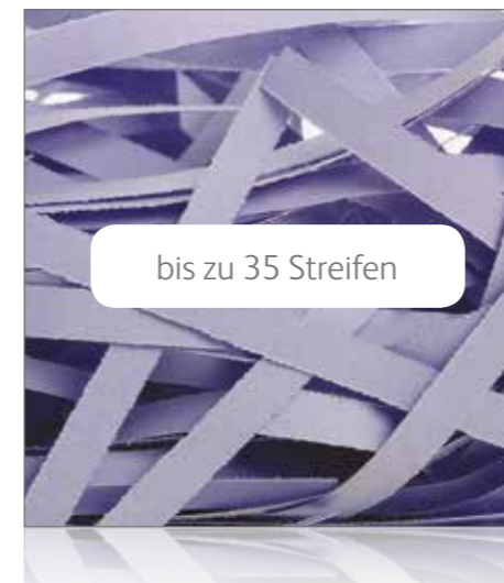
Streifenschnitt P-2 Grundlegende Sicherheit