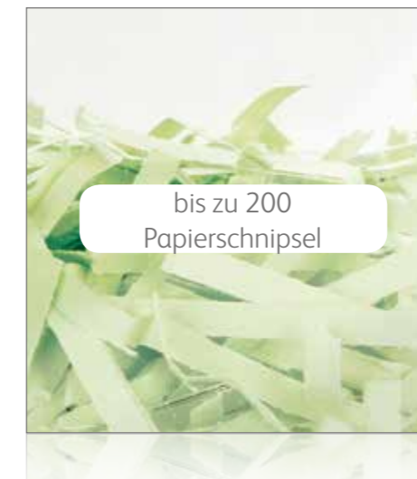
Partikelschnitt P-3 Allgemeine Sicherheit