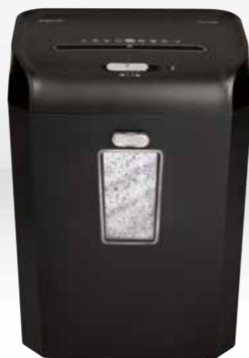
RSX1035 / RSS1535