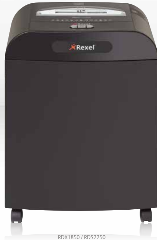
RDX1850 / RDS2250