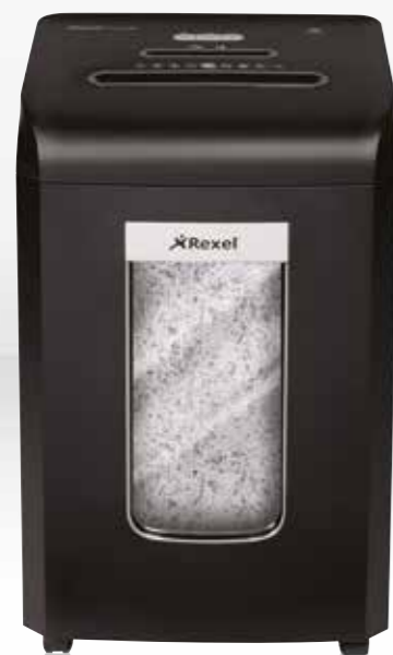
RSX1538 / RSS1838