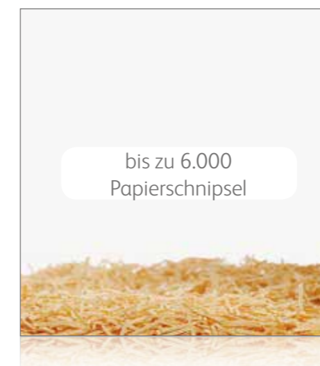
Super-Mikroschnitt P-6 Besonders hohe Sicherheit