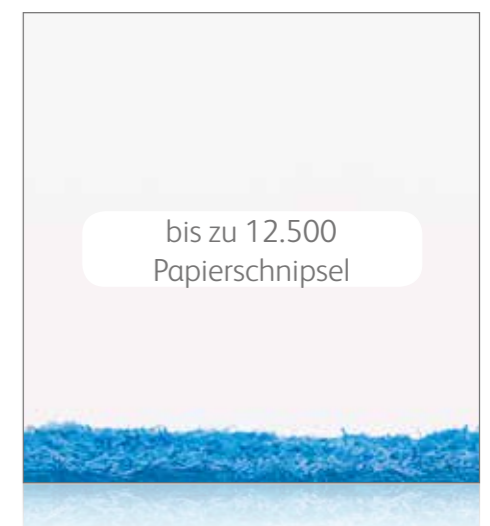
Superfeiner Mikroschnitt P-7 Höchste Sicherheit