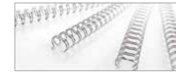
Drahtbinderücken mit 34 Ringen