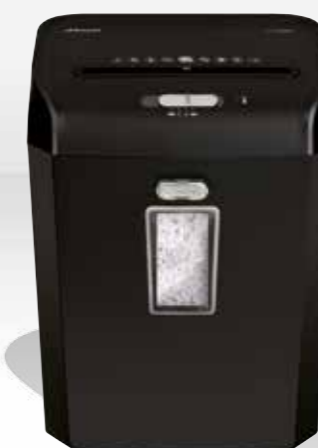
REX623 / RES823