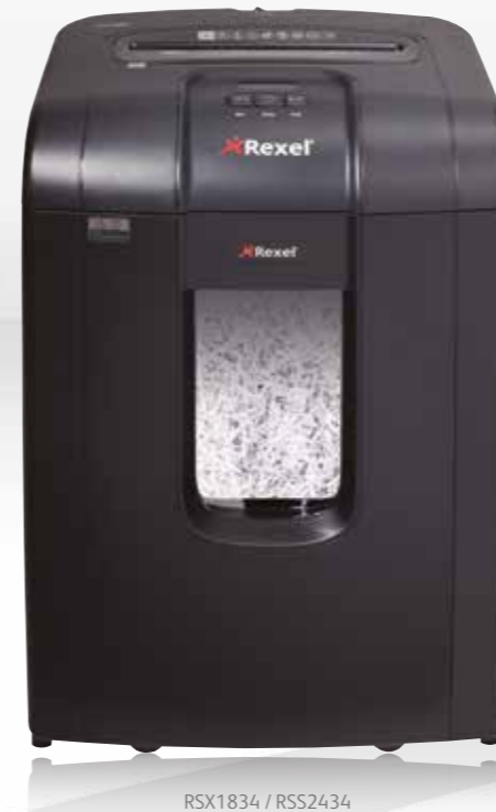
RSX1834 / RSS2434