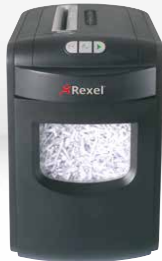
REM723 / REX1023 / RES1223