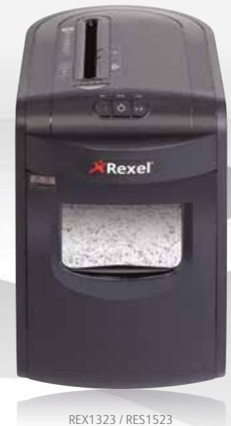
REX1323 / RES1523