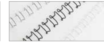
Drahtbinderücken mit 21 Ringen