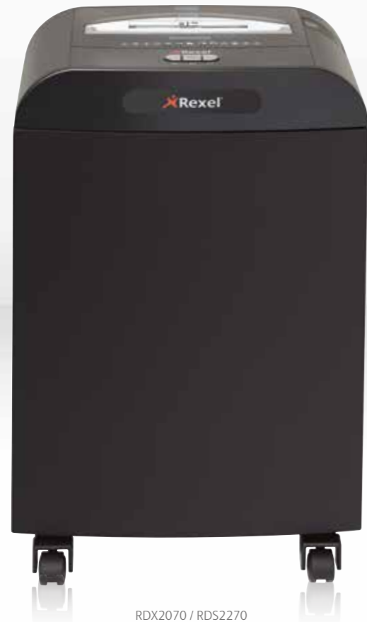
RDX2070 / RDS2270