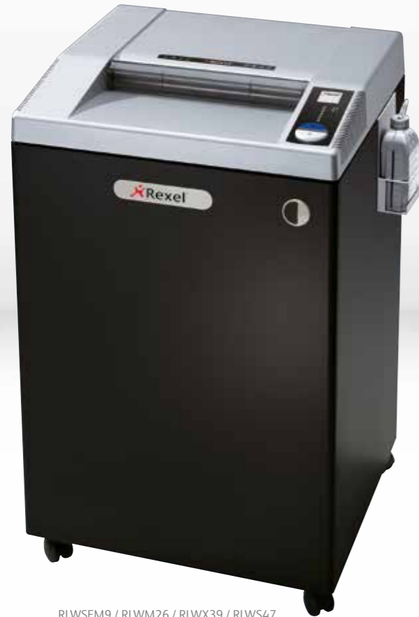
RLWSFM9 / RLWM26 / RLWX39 / RLWS47