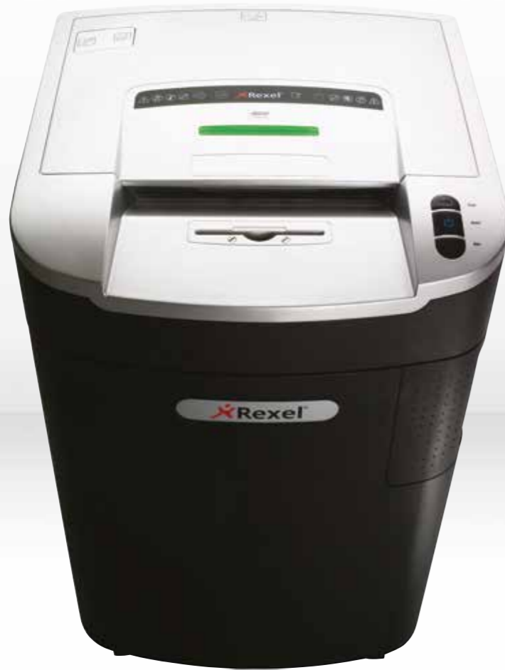
RLM11 / RLX20/RLS32