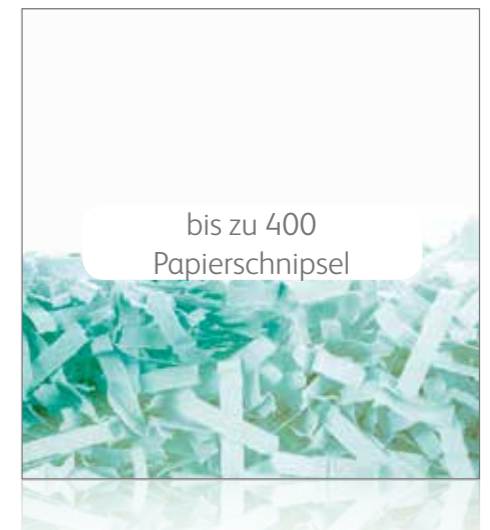
Partikelschnitt P-4 Sicherheit für vertrauliche Dokumente