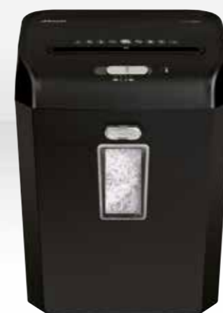
REX823 / RES1123