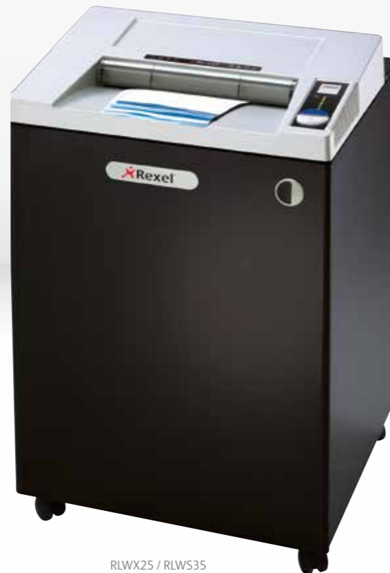
RLWX25 / RLWS35