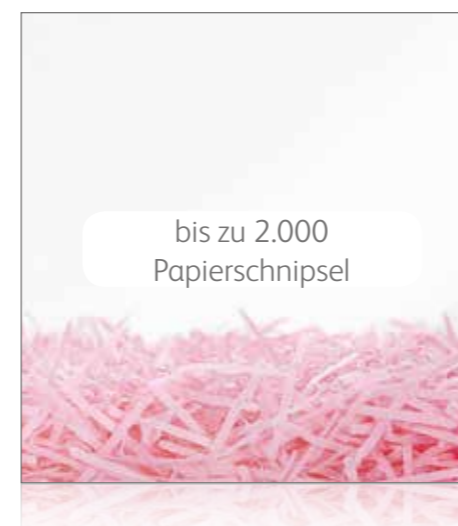
Mikroschnitt P-5 Hohe Sicherheit

P-3 und P-4 sind ideal für das Vernichten vertraulicher Unterlagen zu Hause oder im Unternehmen. P-2 bietet grundlegende Sicherheit für Dokumente, die keine vertraulichen Daten enthalten.