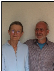
V. u. G. Dorn Tel. 0711/853008