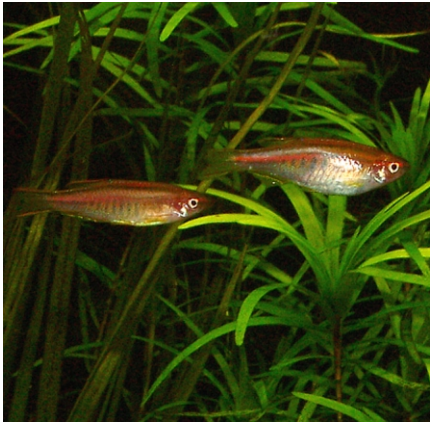
Danio sp. aff. choprae