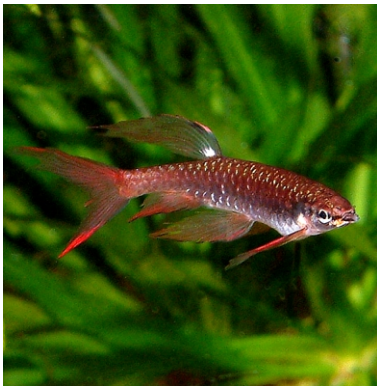
Copella arnoldi , Männchen

Im Freiwasserteil tummelt sich ein kleiner Schwarm Danio spec. aff. choprae . Diese neue, nur 3cm lang werdende Art ist sehr gesellig und man sollte sie möglichst nicht unter 10-12 Tieren halten. Extrem oberflächengebunden sind die grazilen Halbschnabelhechte mit dem zungenbrechenden Namen Hemirhamphodon pogonognathus . Beim Futterangebot sind sie nicht wählerisch, solange es an der Oberfläche schwimmt, absinkendes Futter wird nur selten aufgenommen. Die Weibchen gebären lebende Junge, die zwar sehr dünn aber bereits un- gefähr 2cm lang sind. Des weiteren befinden sich noch einige Spritzsalmier ( Copella arnoldi ) in diesem Aquarium. Das besondere an diesen Fischen ist ihr spezielles Ablaichverhalten. Weibchen und Männchen springen eng aneinander gepreßt auf ein, sich über dem Wasser befindlichem Blatt, um dort Eier abzulegen und gleichzeitig zu befruchten, siehe Abb. rechts unten. Die Eier werden vom Männchen durch bespritzen mit seiner großen Schwanzflosse feucht gehalten. Die geschlüpften Jungtiere gelangen durch abtropfendes Wasser in ihr nasses Element. Als "Reinigungstrupp" sind einige Posthornschncken und die sich gut vermehrenden Garnelen aus der Gattung Neocaridina (Heft 10) unterwegs. Eine Neongrundel vervollständigt den Bestand. Ein Artikel über diese Grundel erscheint im