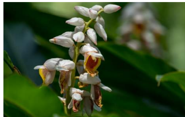
Bastão do imperador branco ( Etingera White )

61. Etingera White - bastão do imperador branco - Família: Zingiberaceae- belíssimo e raro exemplar do nosso conhecido bastão do imperador.