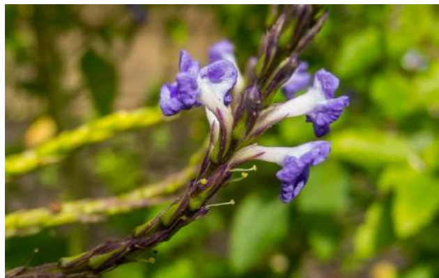
Gervão roxo, erva dos sumidouros, vassourinha de botão, gervão azul, verônica ( Stachytarpheta cayennensis )

49. Stachytarpheta cayennensis – gervão roxo, erva dos sumidouros, vassourinha de botão, gervão azul, verônica . Família Verbenaceae. Encontrada no Brasil, em quase todos os estados, é comum em terrenos incultos, à beira dos caminhos. Herbácea ou sub-arbusto, inflorescências na forma de espiga com flores violetas, lilases ou azuis. Partes utilizadas: folhas e flores, com indicações vermífugas, diurética, hepática, para o rim, cicatrizante, para bronquite e gripes. Podem ser ingeridas como chá natural e saudável. Nas farmácias de manipulação é encontrada sob a forma de extrato fluido. Na cultura afro-brasileira podem entrar nos rituais como folha sagrada. Alguns seguidores do Candomblé e da Ubanda associam o gervão aos orixás Nanã e Xangô.