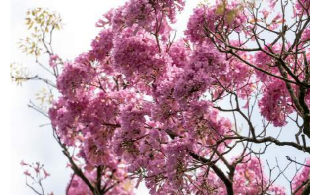
Ipê-roxo, ipê-uva, ipê rosa, ipê, ipê roxo-sete-folhas ( Handroanthus heptaphyllus )

69. Handroanthus heptaphyllus - os ipês roxos estão decorando e alegrando o Arboreto - ipê-roxo - também conhecido como ipê-uva , ipê rosa , ipê , ipê roxo-sete-folhas . Nome específico: Heptaphylla , que significa "sete folhas". Família: Bignoniaceae - Distribuição geográfica: Sul da Bahia, Minas Gerais ao Rio de Janeiro, Paraná e Santa Catarina, na floresta pluvial Atlântica, além de outros países da América do Sul.