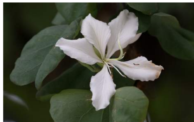
Pata-de-vaca, unha-de-vaca ( Bauhinia variegata var. candida )

6. Bauhinia variegata var. candida - Em frente à AAJB encontra-se a pata-de-vaca ou unha-de-vaca - Família Fabaceae - Distribuição geográfica: Sudeste da Ásia, Sul da China, Paquistão e Índia. Árvore muito ornamental, conhecida também como "árvore de orquídeas", de porte médio com 10 m de altura, de crescimento rápido, copa arredondada e larga, de ramagem densa, o tronco é cilíndrico com casca rugosa pardo-escuro. As folhas são simples, levemente coriáceas, parecendo bipartidas, semelhantes às patas de vaca, daí o seu nome popular. Suas flores brancas, perfumadas, semelhantes às orquídeas, atraem abelhas, beija-flores e outros pássaros. No Nepal são utilizadas como alimento de importância medicinal para curar úlceras e asma enquanto os brotos e raízes são utilizados para problemas digestivos.