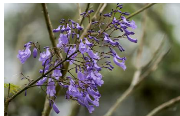
Jacarandá mimoso ( Jacaranda mimosifolia )

1. Jacaranda mimosifolia – jacarandá mimoso - Família Bignoniaceae –Distribuição geográfica: Paraguai, Bolívia e Argentina. Árvore cujo porte atinge de 10 a 15 m de altura, crescimento rápido, tronco com 40 cm de diâmetro, casca fina e acinzentada, copa larga, arredondada, com ramos esparsos, caducifólia. Com folhas opostas e bipinadas, as flores são campanuladas, perfumadas, em grandes panículas de cor azul-violeta luminoso. Fruto cápsula, arredondado, lenhoso, com sementes pequenas e aladas, são utilizados na confecção de bijuteria. É encontrada muito dispersa no Brasil, nas regiões sudeste e sul, principalmente nas cidades de S.Paulo e Rio-Grande-do-Sul. É de extraordinária beleza na época em que perde todas as suas folhas e cobre-se das delicadas flores azuis perfumadas. É empregada na arborização de grandes cidades e também pelo seu porte e sua folhagem, ruas inteiras são decoradas com as magníficas inflorescências do jacarandá mimoso. Em Dallas, no Texas, nos Est. Unidos e em Pretória, na África do Sul, onde consta que há cerca de 60.000 unidades plantadas, é chamada “cidade do jacarandá mimoso”. Encontrada em outras cidades da Europa como Lisboa, Portugal, cidades do Sul da Itália e muito mais. Curiosamente é unânime: as plantas foram levadas do Brasil, considerado seu país de origem.