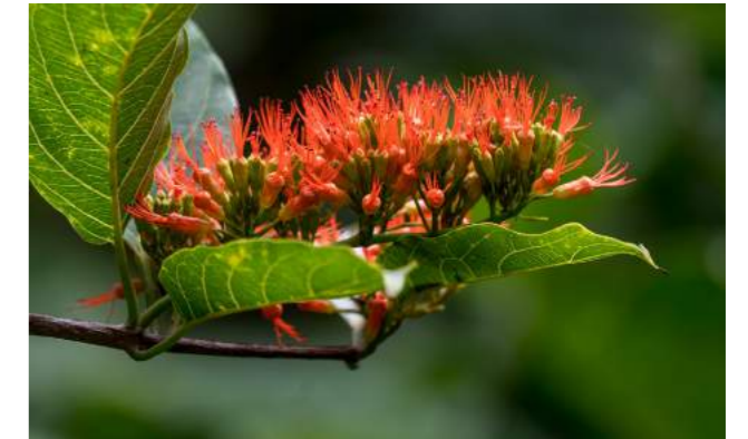
Escovinha ou escova-de-macaco ( Combretum coccineum )

37. Combretum coccineum - Está em plena floração a escovinha ou escova-de-macaco , trepadeira muito florífera, da família Combretaceae. Distribuição Geográfica: Madagascar, Ilhas Maurício. As flores são vermelho-vivas, dispostas à semelhança de uma escova, atraindo diversos pássaros, principalmente beija-flores.