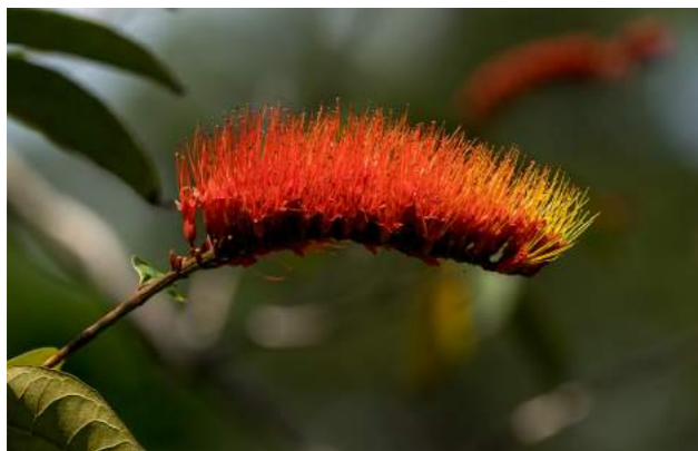
Escovinha ou flor-de-fogo ( Combretum rotundifolium )

58. Combretum rotundifolium - escovinha ou flor-de-fogo . Família: Combretaceae. Distribuição geográfica: