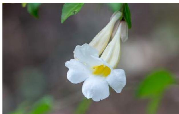
Manto-do-rei ( Thumbergia erecta Alba )

7. Ao lado do pequeno lago das tartarugas está florida a Thumbergia erecta Alba - manto-do-rei - Família: