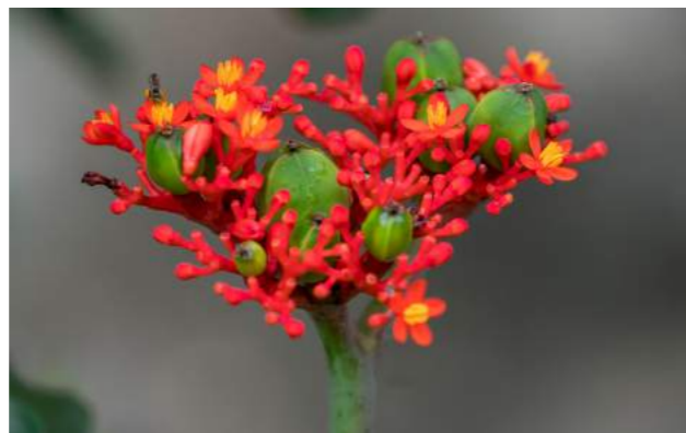
Batata do diabo, batata do inferno ou pinhão-bravo ( Jatropha podagrica )

24. Jatropha podagrica - arbusto exótico suculento e leitoso conhecido como batata do diabo, batata do inferno ou pinhão-bravo - Família Euphorbiaceae - Exibe vários buquês de pequenas flores vermelhas, as folhas são grandes recortadas e onduladas, verdes na página superior e prateadas na página inferior, seu tronco é dilatado na base. Daí o nome "podagrica", que é de origem grega e significa "pé inchado". Tem sua origem na América Central. É muito tóxica.