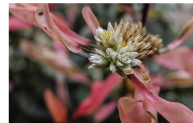
Periquito ( Alternanthera ficoidea )

11. Alternanthera ficoidea - periquito - Família: Amaranthaceae - Distribuição geográfica: Brasil. É uma planta