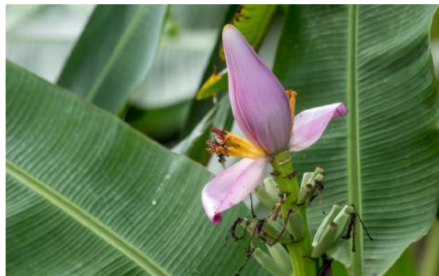
Bananeiras-ornamentais ( Musa ornata )

40. Musa ornata – No jardim da Casa dos Pilões e atrás do muro do Play, estão as decorativas bananeiras-royal ou bananeiras-ornamentais . Família Musaceae. Distribuição geográfica: Ásia. São arbustos de 2 a 4 m de altura, eretos, grandes e entouceirados. As folhas são grandes, verde-azuladas com nervuras de coloração róseo-avermelhadas. As inflorescências são curtas, vistosas e com brácteas grandes na cor rosa-arroxeadas.