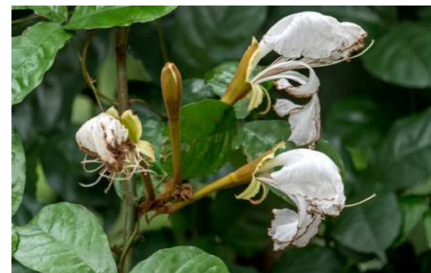
Camoensia ( Camoensia scandens )

35. Camoensia scandens - Numa pérgula extensa após o Lago Frei Leandro há uma belíssima trepadeira florida, a camoensia . Família: Fabaceae - Distribuição Geográfica: Golfo de Guiné-África. Merece ser admirada pelos seus cachos de grandes e delicadas flores brancas e perfumadas, contornadas por uma pincelada de tonalidade castanha. O nome genérico foi dado em homenagem ao poeta português Luiz de Camões. Ela é encontrada também em outra pérgula logo na entrada do Arboreto.