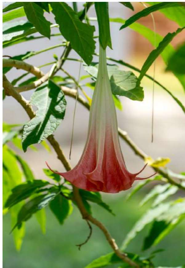
Trombetas ou sete-saias cor de rosa ( Brugmansia suaveoleos )

59. Brugmansia suaveoleos - as trombetas ou sete-saias cor de rosa estão floridas. Família Solanaceae - Distribuição geográfica: América Central e do Sul. Arbusto que atinge de 2 a 3 metros de altura. É uma planta muito tóxica. Dos frutos os indígenas preparam uma bebida narcotizante, utilizada pelos sacerdotes a fim de se comunicarem com os deuses. Após o século XVI era frequentemente utilizada na Europa como entorpecente, unguento dos feiticeiros ou como bebida afrodisíaca.