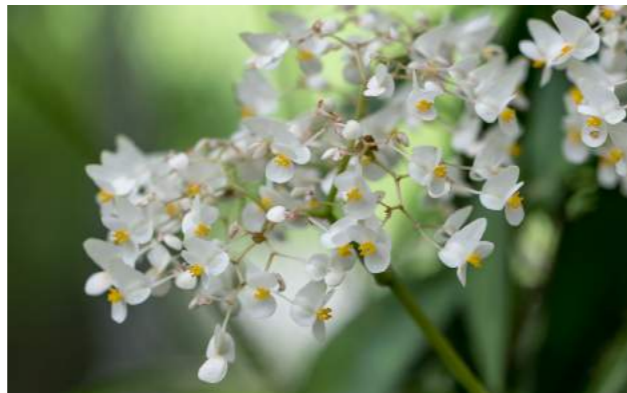
Folha-de-videira ( Begonia reniformi )

43. No Orquidário, apreciamos um grupo de Begonia reniformi com belos cachos de flores brancas conhecidas como “folha-de-videira” - Família: Begoniaceae – Distribuição geográfica: Brasil. Planta herbácea de 50 a 80 cm de altura. As folhas são grandes em forma de coração, verde-brilhantes, semelhantes à folha de uva. A inflorescência é ramificada com diversos cachos brancos, formados por pequenas e delicadas flores brancas.