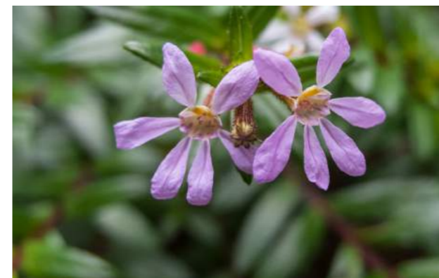
Falsa-érica, cuféia ( Cuphea gracilis )

9. Cuphea gracilis - chamada de falsa-érica ou cuféia . É uma herbácea, da família Lythraceae, nativa do Brasil, de pequeno porte - 20 a 30 cm -, com folhagem delicada e permanente, sempre verde. As pequeninas flores são brancas ou cor-de-rosa. Floresce quase o ano todo.