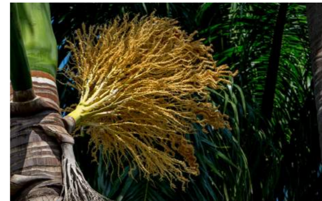
Palmeira-imperial ( Roystonea oleracea )

70. Roystonea oleracea - Apreciamos a inflorescência da palmeira-imperial . Nativa das Antilhas e norte da Venezuela, palmeira elegante e imponente, atinge de 15 a 30 metros de altura. É uma forte característica do Jardim Botânico do Rio de Janeiro, com a tradição e a história de que a primeira muda da palmeira foi plantada por D. João VI, em 1.809. No ano de 1972, foi atingida por um raio que ocasionou a sua morte, mas logo foi plantada outra para substituí-la.