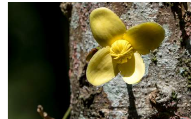
Manguá, sachá-manguá ( Grias neuberthii )

64. Grias neuberthii - manguá ou sachá-manguá , está plena de frutos. Árvore alta e esguia que chega a atingir 20 m de altura, as folhas são grandes e podem medir até 1 m de comprimento. Despertam a nossa atenção pela beleza dos troncos literalmente vestidos de vistosas flores amarelas, reunidas em grupos de 10 ou mais unidades. Os frutos são lenhosos, compridos e marrons, a polpa que envolve as sementes é branca e adocicada, muito apreciadas pelos povos nativos. Família Lecythidaceae. Distribuição geográfica: Floresta tropical da Região Amazônica, Equador, Colômbia e Peru. O nome de sachá-manguá se deve ao fato dela ser parecida com a manga da floresta selvagem. No Equador, são considerados sagrados pelos índios Quichuas por servirem de alimento para o espírito da floresta Sacha Ruma.