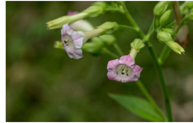
Tabaco ( Nicotiana tabacum )

52. Nicotiana tabacum - tabaco - Família: Solanaceae - Distribuição geográfica: América Tropical - Planta herbácea, que de suas folhas se produz a maior parte do tabaco comercial.