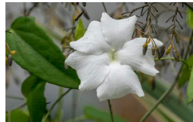
Raiz-de-guiné, erva-pipi, tipi-verdadeiro, gambá, erva de alho, mucura-caé ( Petiveria alliaceae var. tetandra )

8. Petiveria alliaceae var. tetandra - No gramado, ao lado do Café, encontra-se a raiz-de-guiné . Família: Phytolacaceae - Distribuição geográfica: Brasil. Outros nomes: erva-pipi, tipi-verdadeiro, gambá, erva de alho, mucura-caé . É um pequeno arbusto, ereto, com cerca de 1 m de altura, de ramos delgados e compridos, com característico odor de alho. Folhas alternas, inteiras e elípticas. Flores pequenas e brancas verdolengas. Possui várias propriedades medicinais, é antimicrobiana, é fungicida, repelente de insetos. Usada na cultura religiosa africana e indígena, conhecida popularmente por seus poderes mágicos. É também muito tóxica. No nordeste é conhecida como amansa-senhor, porque no período da escravidão, suas raízes eram usadas na forma de pó pelos escravos na alimentação dos senhores de engenho, levando-os à afasia e até a morte.