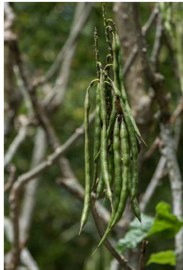
Suinã ( Erythrina speciosa )

68. Erythrina speciosa - suinã - Família: Fabaceae - Distribuição geográfica: Espírito Santo, Minas Gerais, Rio de Janeiro, S. Paulo, Santa Catarina e Paraná, principalmente nas matas litorâneas. Árvore de pequeno porte, até 10 m de altura, muito espinhenta e ramificada com caule de cor pardacenta. Conhecida também como mulungu, canivete e candelabro-vermelho, quando, nos meses de inverno, perde todas as folhas, deixando à mostra os ramos nus, erguidos em forma de candelabro. De julho a setembro cobre-se de cachos de chamativas flores vermelho-brilhante que atraem principalmente os beija-flores e é uma árvore excelente hospedeira para toda a classe de orquídeas. Adapta-se a qualquer clima e é muito resistente à estiagem prolongada, assim como vegeta em terrenos úmidos. Madeira leve e porosa, podendo ser aproveitada para caixotaria.