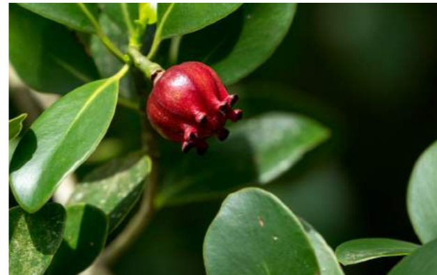
Cebola-da-mata, cebola-da-restinga ou ceboleiro-da-praia ( Clusia laceolata )

45. Clusia laceolata - Ao lado e atrás do Bromeliário, está frutificando a cebola-da-mata, cebola-da-restinga ou ceboleiro-da-praia . Família: Clusiaceae. Distribuição geográfica: áreas de restinga do Rio de Janeiro, região costeira e no norte de S.Paulo. Arbusto de 2 a 3 m de altura, folhas espessas, lisas e brilhantes. Suas flores lembram a textura de uma flor de cera e suas flores brancas com centro avermelhado. É utilizado na medicina popular como cicatrizante de feridas no tratamento de pele e ainda é analgésico.