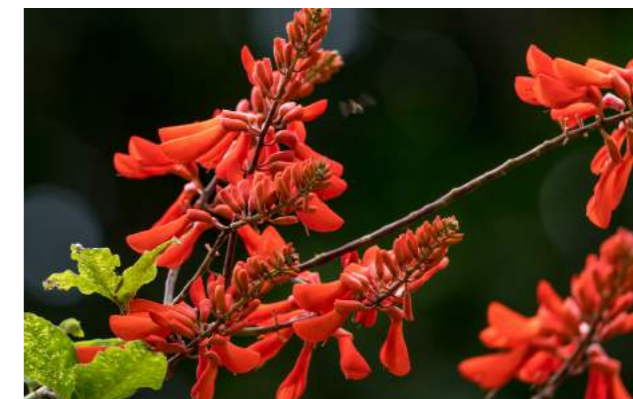
Mulungu-do-senegal ( Erythrina senegalensis )

19. Erythrina senegalensis - árvore extremamente ornamental, o mulungu-do-senegal floresce várias vezes ao ano, pertence à família Fabaceae, conhecida também como árvore-de-coral devido à cor vermelho-brilhante das suas flores. Distribuição geográfica: Senegal e Camarões. Os ramos e cascas são revestidos de espinho, assim como a haste das folhas. Uma cerca feita com estas árvores é impenetrável devido aos fortes espinhos. Sua casca permite suportar os incêndios que regularmente ocorrem na savana do Oeste Africano. A madeira serve para fazer cabos de faca e as sementes são transformadas em belos colares. É de enorme atrativo para miríades dos mais diversos pássaros. No entanto, o mais importante são as pesquisas que estão sendo efetuadas, baseadas nos resultados positivos da medicina tradicional de Mali. Dados são coletados através de inúmeras entrevistas feitas por médicos, botânicos, farmacêuticos e enfermeiros e curandeiros tradicionais considerados parte do sistema de saúde de Mali. O objetivo comum é a melhoria da saúde da população.