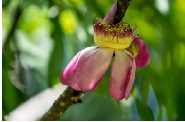
Jeniparana ( Gustavia gracilima )

66. Osmanthus fragrans - No Jardim Japonês, está florido o jasmim-do-imperador - Família: Oleaceae - Distribuição geográfica: natural do Himalaia, onde é encontrada em 1.200 a 3.000 metros acima do nível do mar, China e Japão. Grande arbusto ou árvore de pequeno porte, de 3 a 4 m de altura, crescimento lento, lenhoso, densamente ramificado, com folhas de cor verde-escuras, simples, finamente denteadas. As pequeninas e delicadas flores, de cor branco-creme, formam graciosos buquês, exalando um delicioso e suave perfume. Também chamada de flor-do-imperador, pois, segundo a lenda, era a preferida de D. Pedro II. O nome genérico Osmanthus vem do grego Osma, ou seja, perfumado, e Anthos significa flor. Cultivado na China a cerca de 2.500 anos, as flores são empregadas na cozinha chinesa para a produção de geleia, bolos, doces, sopas e até bebidas alcoólicas. Na Índia são utilizadas para aromatizar o chá, e na Região Norte são usadas para proteger a roupa de insetos. Possuem grande importância na medicina tradicional.