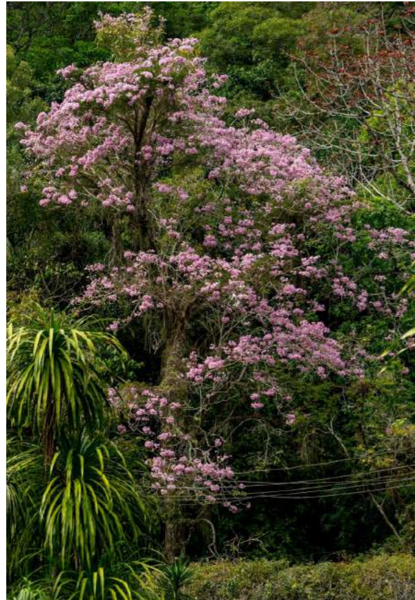
Ipê cor de rosa, ipê balsamo, ipê de-el Salvador ( Tabebuia rosea )

40. Musa ornata – No jardim da Casa dos Pilões e atrás do muro do Play, estão as decorativas bananeiras-royal ou bananeiras-ornamentais . Família Musaceae. Distribuição geográfica: Ásia. São arbustos de 2 a 4 m de altura, eretos, grandes e entouceirados. As folhas são grandes, verde-azuladas com nervuras de coloração róseo-avermelhadas. As inflorescências são curtas, vistosas e com brácteas grandes na cor rosa-arroxeadas.