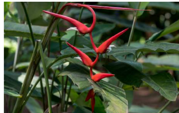
Helicônia pêndula ( Heliconia pendula )

62. Heliconia pendula - helicônia pêndula - Família: Heliconiaceae - Planta de 2 a 3 m de altura, inflorescências longas em espiral, tem até 60 cm de comprimento, contendo de 4 a 10 brácteas espaçadas, de cor vermelho-intenso, brilhante, protegendo pequenas flores branco-creme. Distribuição geográfica: Brasil e América do Sul.