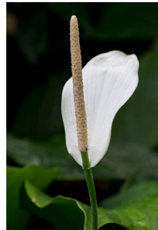
Lírio-da-paz ( Spathiphyllum cannifolium )

3. Spathiphyllum cannifolium - lírio-da-paz - Família: Araceae - Distribuição geográfica: Floresta Amazônica.