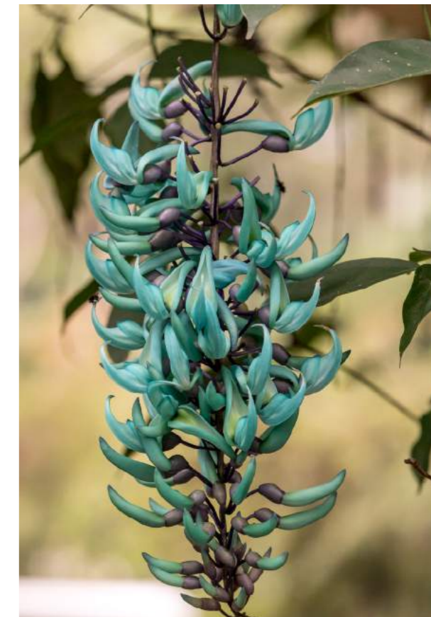
Jade-videira, turquesa jade ( Strongylodon macrobotrys )

das Filipinas, crescem ao lado de córregos em florestas úmidas. Trepadeira deslumbrante, perene, com hastes que podem alcançar até 18 m de comprimento. As inflorescências pendentes, em forma de cascata com cerca de 1,0 m de comprimento ocorre na primavera e verão. As flores são belíssimas e têm brilho perolado. É conhecida como jade devido à sua coloração entre o verde e o azul, semelhante às pedras semipreciosas de jade. No Havaí, passaram a incluí-la nos seus adornos de festa.