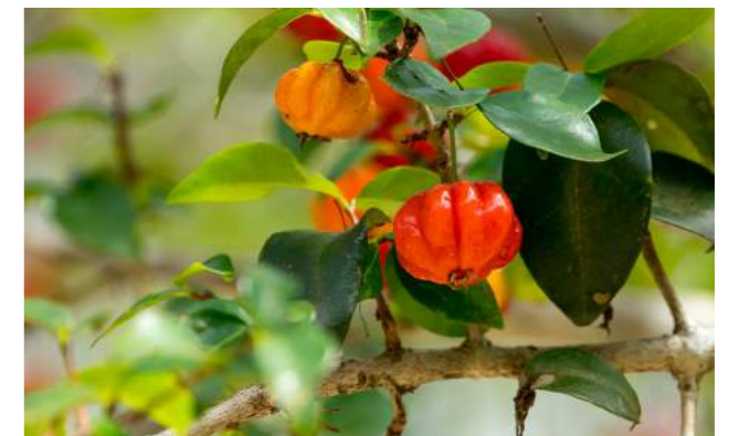
Pitangueira ( Eugenia uniflora )

47. Eugenia uniflora – a pitangueira está frutificando. Família: Myrtaceae. Distribuição geográfica: Brasil, fronteira com as Guianas até S.Paulo. As árvores têm 8 m de altura, de tronco algo tortuoso e bastante esgalhado. As folhas são verde-escuras brilhantes, mas quando novas apresentam cor de vinho. As flores são brancas, suavemente perfumadas e melíferas. A pitanga apresenta coloração alaranjada, vermelho-sangue ou mesmo roxa (quase preta), o que a tornamuito ornamental. Os frutos são deliciosos para o consumo e produção de geleias, sorvetes, sucos, vinhos e licores. As folhas possuem várias propriedades medicinais, além das vitaminas A, C e B12. É conhecida como ibá-pitanga pelos índios tupis-guaranis, que significa fruta de pele tenra ou fina.