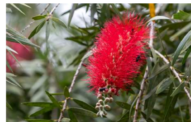
Escova-de-garrafa-pendente, lava-garrafas ou penacheiro ( Callistemon viminalis )

17. Callistemon viminalis - Ao lado do Jardim Sensorial encontra-se a escova-de-garrafa-pendente, lava-garrafas ou penacheiro , da família Myrtaceae. Árvore muito ornamental de ramagem perene, aromática, delicada, pendente e belas inflorescências terminais em formato de espigas cilíndricas com inúmeros estames de flores vermelhas semelhantes a uma escova de lavar garrafas. Nativa da Austrália, seu nome Callistemon, vem do grego kalos e estemon, estames; viminalis, do latim, significa longos galhos flexíveis. Preferida pelos beija-flores, atrai também abelhas e borboletas.