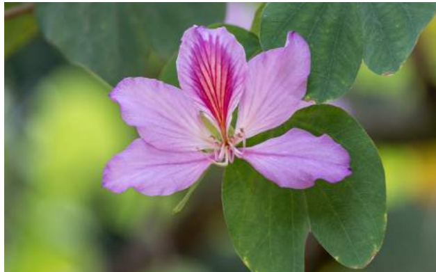
Pata-de-vaca ou unha-de-vaca ( Bauhinia variegata )

brotos e raízes são utilizados para problemas digestivos.