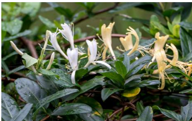
Trepadeira madressilva, madressilva-dos-jardins, cipó-rainha ( Lonicera japônica )

15. Lonicera japônica - trepadeira madressilva, madressilva-dos-jardins, cipó-rainha , da família Caprifoliaceae, com delicadas flores branco-amareladas, muito perfumadas, de fragrância agradável. Distribuição geográfica: nas montanhas da Coréia, da China e do Japão, por isso é conhecida também como madressilva-do-japão. É muito valorizada e de grande importância na tradicional medicina chinesa. Em sua homeopatia, utilizam as folhas secadas, enquanto na apicultura é fonte de néctar e pólen.