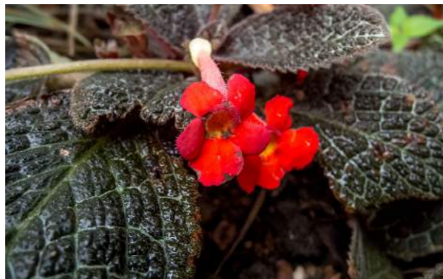
Planta-tapete, asa-de-barata ( Episcia cupreata )

suas folhas aveludadas com coloração acobreada, desenhos prateados e flores vermelhas. É nativa do Brasil e tem de 0,10 a 15 cm de altura. Seu nome vem do grego: episia “episkios”, que significa sombreada e cupreata – cobre é referência à sua cor.