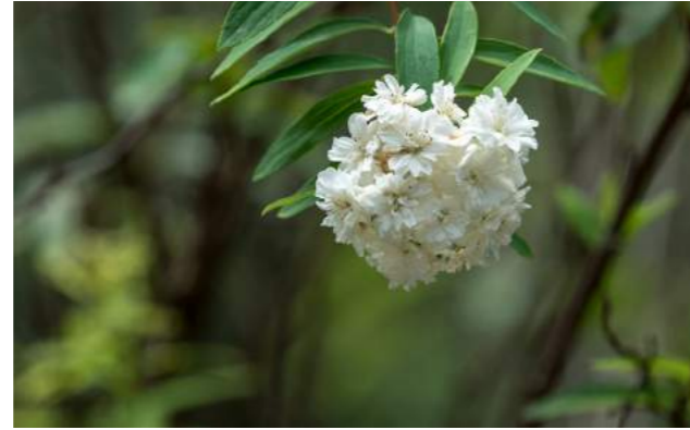
Buquê-de-noiva, grinalda-de-noiva ( Spirae vanhouttei )

67. Spirae vanhouttei - No Jardim Japonês, encontra-se o buquê-de-noiva ou grinalda-de-noiva , arbusto lenhoso, muito ramificado, nativo da China e do Japão. Suas folhas são verde-azuladas na parte inferior, a inflorescência é disposta nas extremidades dos ramos, formando pequenos buquês. Quando floresce, forma uma cascata de flores muito brancas que encobre a folhagem.