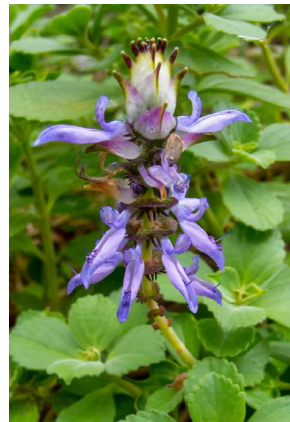
Boldo miúdo, boldo da terra, boldo de jardim ( Plectranthus ornatos )

16. Plectranthus ornatos - boldo miúdo, boldo da terra, boldo de jardim - Família: Lamiaceae - Distribuição geográfica: África, da Etiópia à Tanzânia - Utilizada na medicina popular africana e em algumas regiões do Brasil, conhecido como boldinho para distúrbios digestivos e como anti-biótico.