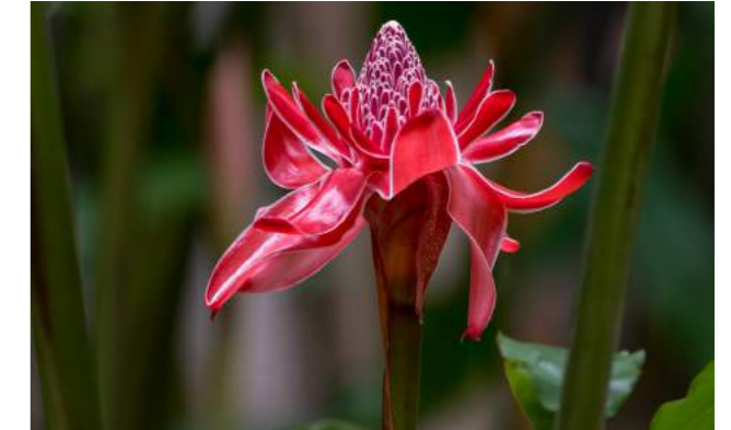
Bastão-do-imperador, tocha, flor-da-redenção ( Etilingera elatior )

em 13 de maio de 1888, que aboliu a escravidão em nosso país. É provável que esta seja a origem de seu nome popular, “bastão do imperador”. Consta que a variedade vermelha era usada nas festas religiosas do Peru. Na Malásia, a flor é colhida antes de desabrochar, para servir de alimento.