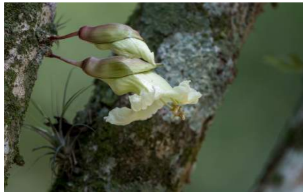
Árvore-da-vela ( Parmentiera cereifera )

76. Parmentiera cereifera - Após a entrada do Arboreto as duas Parmentiera cereifera – árvore-da-vela estão floridas – Família: Bignoniaceae - Distribuição geográfica: México, Panamá, América Central. Árvore de 5 a 7 m de altura, com tronco muito ramificado e copa densa. Suas flores abundantes, brancas, campanuladas são dispostas ao longo do tronco e dos ramos, quando caem formam sob a sua copa um tapete branco muito decorativo, os frutos são longos, cilíndricos, branco-amarelados, cerosos, dependurados diretamente dos ramos. Com aspecto semelhante a uma vela, contêm polpa na qual estão embutidas as sementes, pequenas e achatadas.