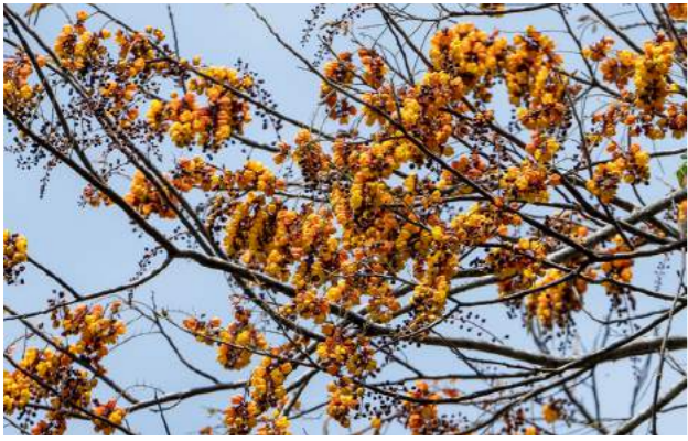
Fava-mari-mari, mari-mari-da-várzea, seruaiá, ingá-mare ( Cassia moschata )

74. Cassia moschata - fava-mari-mari, mari-mari-da-várzea, seruaiá, ingá-mare. Família: Fabaceae. Distribuição geográfica: Região Amazônica, principalmente nos estados do Pará e Amazonas. Árvore de 4 a 10 metros de altura, dotada de copa ampla e rala, com tronco geralmente tortuoso. Extremamente ornamental por ocasião da inflorescência, com vistosas flores amarelas pendentes. A fruta é muito apreciada in-natura. Tem uma vagem amarelada quando madura, com muitas sementes envoltas em polpa suculenta, com sabor adocicado, consumidas pelas populações locais e animais silvestres. É utilizada em construções rústicas, cabos de ferramentas, confecção de brinquedos e caixotaria em geral.