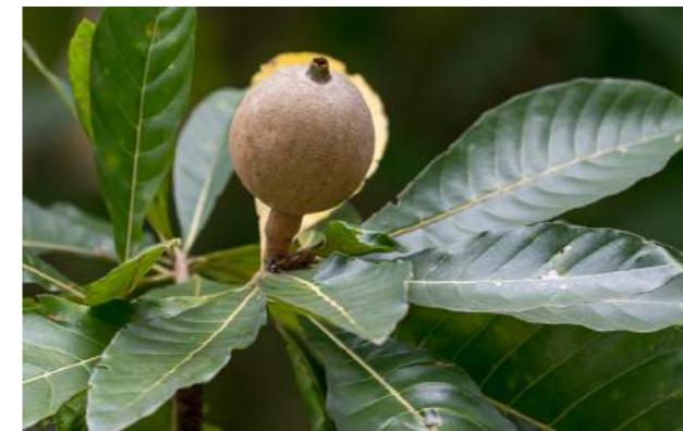
Jenipapo ( Genipa americana )

53. Genipa americana . Jenipapo . Após a ponte, ao lado ao Laboratório Social, uma grande árvore jenipapeira está frutificando. Família: Rubiaceae. Distribuição geográfica: América Tropical, no Brasil, na Amazônia e na Mata Atlântica, principalmente nas áreas mais úmidas. Uma árvore chega a 20 m de altura. Em guarani, jenipapo significa “fruta que serve para pintar”. Isso porque do sumo do fruto verde se extrai uma tinta com a qual se pode pintar a pele, paredes, cerâmica etc. O jenipapo é usado por muitas etnias da América do Sul como pintura corporal e some depois de aproximadamente duas semanas. A bela coloração azul-escura deve-se ao contato da genipina contida nos frutos verdes com as proteínas da pele, sob ação do oxigênio atmosférico. As flores são amarelas, os frutos são redondos, macios, com polpa comestível, muito apreciados na culinária, utilizados para fazer doces, compotas, xaropes e bebidas, especialmente o famoso licor de jenipapo. As raízes, as folhas e os frutos possuem propriedades medicinais. Frutifica várias vezes ao ano.