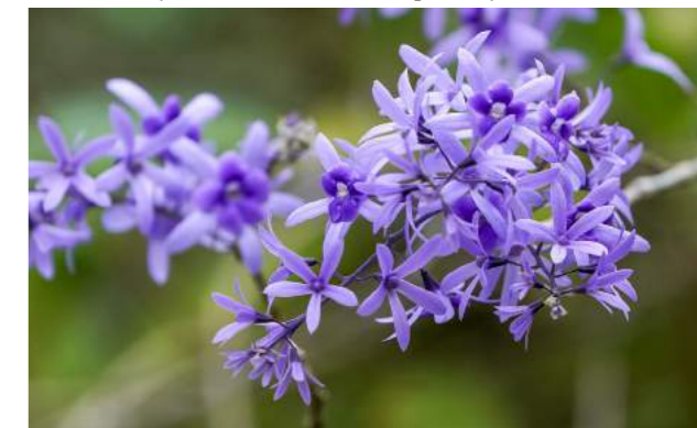
Trepadeira touca de viúva, viuvinha ou flor de são miguel ( Petrea volubilis )

3. Spathiphyllum cannifolium - lírio-da-paz - Família: Araceae - Distribuição geográfica: Floresta Amazônica.