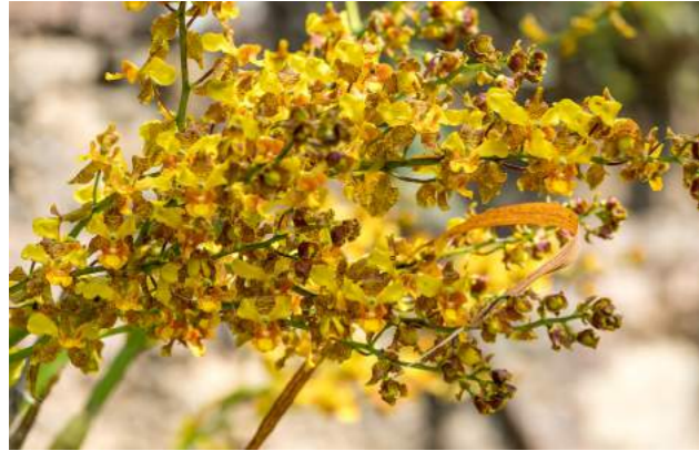
Orquídea sumaré, sumaré-das-pedras, bisturi-do-mato, cola-de-sapato, rabo-de-tatu ( Cyrtopodium glutiniferum )

49. Stachytarpheta cayennensis – gervão roxo, erva dos sumidouros, vassourinha de botão, gervão azul, verônica . Família Verbenaceae. Encontrada no Brasil, em quase todos os estados, é comum em terrenos incultos, à beira dos caminhos. Herbácea ou sub-arbusto, inflorescências na forma de espiga com flores violetas, lilases ou azuis. Partes utilizadas: folhas e flores, com indicações vermífugas, diurética, hepática, para o rim, cicatrizante, para bronquite e gripes. Podem ser ingeridas como chá natural e saudável. Nas farmácias de manipulação é encontrada sob a forma de extrato fluido. Na cultura afro-brasileira podem entrar nos rituais como folha sagrada. Alguns seguidores do Candomblé e da Ubanda associam o gervão aos orixás Nanã e Xangô.