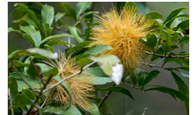
Rabo-de-cutia ( Stiffia crysantha )

38. Encontra-se florida a Stiffia crysantha - rabo-de-cutia . Família: Asteraceae. Distribuição geográfica: Mata Atlântica, Bahia, Rio de Janeiro, S.Paulo. Conhecida também como diadema, pompom-amarelo, pincel, esponja e flor-da-amizade. Arvoreta de 3 a 5 m de altura, de tronco e caule lenhoso, a madeira é leve, mole, de baixa durabilidade. As folhas são simples, verdes e brilhantes. As flores são como pompom nas tonalidades amarela e laranja, que assim permanecem durante por longo período, nos meses de junho a setembro. São de grande atrativo para os beija-flores, borboletas e abelhas. Utilizadas como flor de corte, frescas e depois secas, e aproveitadas para arranjos decorativos.