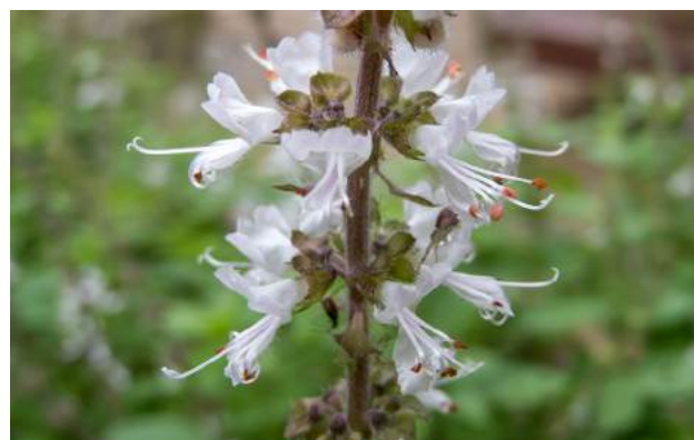
Manjeriço, alfavaca, alfavaca-cheirosa ( Ocimum basilicum )

12. Ocimum basilicum - Também florido encontra-se o manjeriço, alfavaca ou alfavaca-cheirosa da família Labiatae. Distribuição geográfica: África, Índia e Pacífico Sul. Planta herbácea, perene, aromática e medicinal. É conhecida desde a antiguidade por indianos, gregos, egípcios e romanos. Considerado sagrado entre alguns povos hindus, é plantado às portas dos templos para homenagear Tulasi, esposa de Vishnu, o deus da vida, e para afastar os maus espíritos. Faz parte de rituais religiosos entre os gregos ortodoxos e no interior do México, é procurado como o “talismã do amor”. Também é conhecido e utilizado pelos seus poderes culinários. Sua inflorescência é branca, suas folhas são delicadas verde-brilhantes, de sabor e aroma doce e picante, usadas e apreciadas principalmente na gastronomia italiana como matéria prima de pestos e molhos. Esta planta tem também propriedades medicinais para muitas e várias aplicações. Dela também é extraído um óleo essencial utilizado na indústria de alimentos e perfumaria.