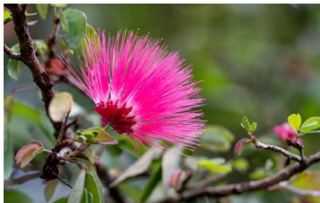
Esponjinha ( Calliandra harrsii )

5. Calliandra harrsii - esponjinha - Família: Fabaceae