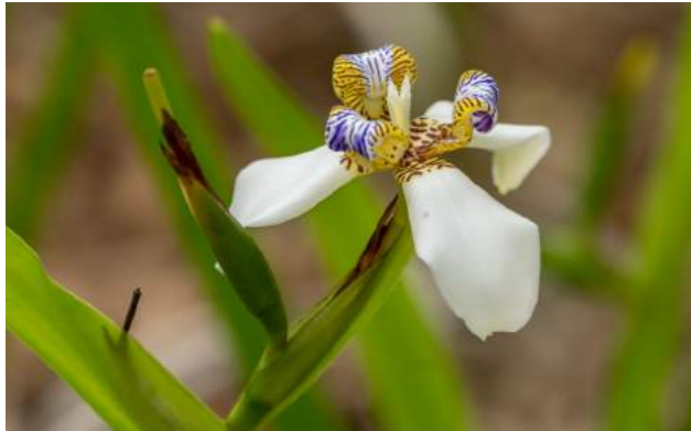
Falso-íris, íris-da-praia, lírio roxo-das-pedreiras, lírio-verde, maricá, pseudo-íris azul ( Neomarica candida )

da-praia, lírio roxo-das-pedreiras, lírio-verde, maricá, pseudo-íris azul. No Brasil, elas são encontradas de Norte ao Sul. Por ser nativa de regiões de beira-mar, resiste aos ventos e maresia.