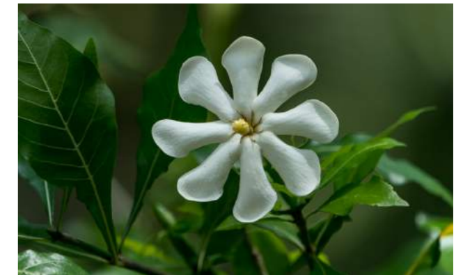
Araçarana, araçá da praia, louro do brejo, marmelo da praia ( Tocoyena bullata )

72. Tocoyena bullata - araçarana , araçá da praia , louro do brejo , marmelo da praia . Família Rubiaceae - Distribuição geográfica: Brasil, nas regiões Nordeste e Sudeste em restinga, Mata Atlântica, Cerrado e Caatinga - Arbusto de 1 a 4 m de altura, com folhas rugosas e flores branco-amareladas, muito perfumadas. É uma planta que se adapta a todo tipo de solo, podendo ser cultivada desde o nível do mar até 800 m de altitude.