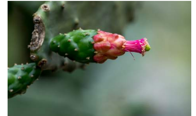
Palma-doce, palma-de-engorda, palma-forrageira, cacto-sem-espinhos, nopal ( Nopalea cochenillifera )

e seus ramos, conhecidos como palmas, são achatados, carnosos e em formato oval. As flores são vermelhas e brotam praticamente o ano todo. Os frutos são usados na culinária na América Central e no Nordeste do Brasil. Também é de grande importância na alimentação dos animais. Esta planta produz um corante natural, chamado carmin, extraído do inseto parasita.