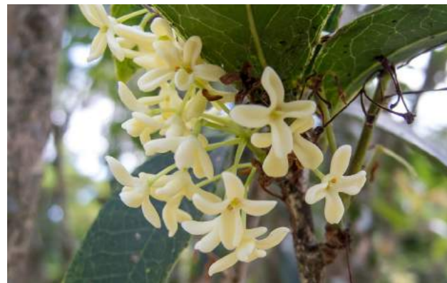
Jasmim-do-imperador ( Osmanthus fragrans )

66. Osmanthus fragrans - No Jardim Japonês, está florido o jasmim-do-imperador - Família: Oleaceae - Distribuição geográfica: natural do Himalaia, onde é encontrada em 1.200 a 3.000 metros acima do nível do mar, China e Japão. Grande arbusto ou árvore de pequeno porte, de 3 a 4 m de altura, crescimento lento, lenhoso, densamente ramificado, com folhas de cor verde-escuras, simples, finamente denteadas. As pequeninas e delicadas flores, de cor branco-creme, formam graciosos buquês, exalando um delicioso e suave perfume. Também chamada de flor-do-imperador, pois, segundo a lenda, era a preferida de D. Pedro II. O nome genérico Osmanthus vem do grego Osma, ou seja, perfumado, e Anthos significa flor. Cultivado na China a cerca de 2.500 anos, as flores são empregadas na cozinha chinesa para a produção de geleia, bolos, doces, sopas e até bebidas alcoólicas. Na Índia são utilizadas para aromatizar o chá, e na Região Norte são usadas para proteger a roupa de insetos. Possuem grande importância na medicina tradicional.