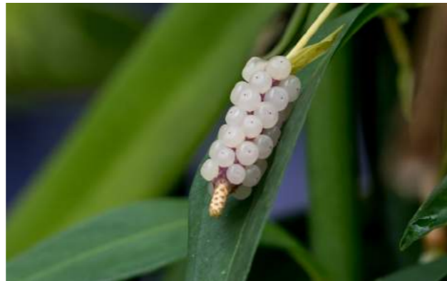
Antúrio pérola ( Anthurium scandens )

42. Anthurium scandens - antúrio pérola - Família Araceae - Distribuição geográfica: Brasil.