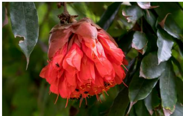
Rosa-da-montanha ( Brownea grandiceps )

4. Em frente à casa de Barbosa Rodrigues encontra-se a Brownea grandiceps - rosa-da-montanha . Família: Fabaceae - Distribuição geográfica: Região Amazônica, Brasil, Bolívia, Colômbia e Venezuela. Outros nomes: rosa-da-mata, sol-da-bolívia, rosa-da-venezuela, braúnia, chapéu-de-sol . Árvore com folhas persistentes com até 12m de altura, de tronco marrom - acinzentado, de crescimento lento. As inflorescências são esféricas compostas de magníficas flores muito numerosas de cor vermelho-brilhante e estames amarelos. Em época de brotação, constitui uma atração à parte, com tufo de folhas novas, pendendo delicadamente dos seus galhos, com tonalidade de rosa a castanho, formando um "lenço pendente" de textura semelhante à seda pura. De tão bonitos muitas vezes podem ser confundidos com sua inflorescência. O nome genérico leva o nome de Patrick Browne, médico naturalista, irlandês e autor de uma obra de história natural. Grandiceps é por causa das flores grandes.