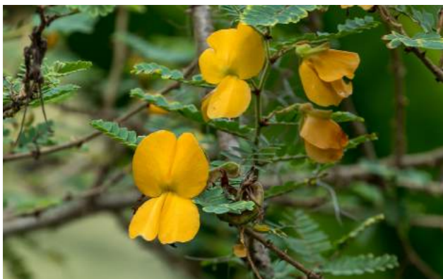
Madeira de balsa ( Aeschynomene erythroxylum )

31. Aeschynomene erythroxylum - No Lago Frei Leandro encontra-se a madeira de balsa - Família: Fabaceae - Distribuição geográfica: Etiópia, Sudan, Gana, Nigéria e Zimbábue. Pequena árvore de até 9 m, que cresce em solos encharcados, rios, lagos e pântanos. As flores são amarelo-alaranjadas, os frutos são em espiral, as sementes castanho-escuros arroxeadas têm a forma de rim. As folhas misturadas a outras plantas são empregadas no tratamento de reumatismo e também no tratamento de pele. Utilizam as hastas para pesca, para fabricação de sandálias, combustível e forragem. A madeira pálida e muito leve serve para a construção de balsas, canoas, jangadas e fabricação de móveis.