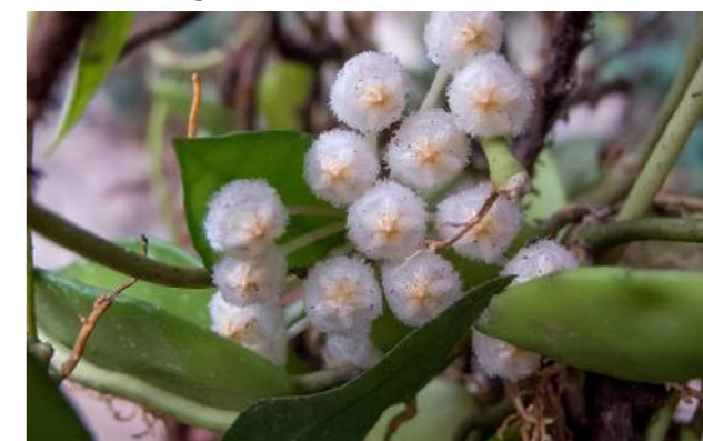
Flor de cera ( Hoya lacunosa )

trepadeira pendendo da árvore Mascarenhasia arborescens. Família: Asclepiadaceae - Distribuição geográfica: Austrália e China. Trepadeira pouco ramificada com folhas espessas e carnosas, inflorescência pendente, flores cerosas, de cor branco rosadas, que formam pequenos e delicados buquês.