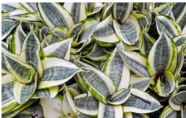
Espadinha, boa sorte, ninho do passarinho dourado ( Sansevieria trifasciata “Golden Hahnii” variegata)

13. Sansevieria trifasciata “Golden Hahnii” variegata, espadinha, boa sorte, ninho do passarinho dourado - Família: Liliaceae - Distribuição geográfica: África - Folhas marcadas em verde e amarelo, herbácea perene, suculenta, de pequeno porte, crescem em rosetas com folhas muito resistentes.