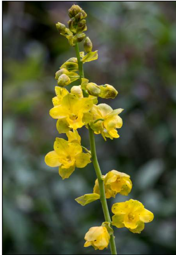
Sumaré ( Cyrtopodium glutiniferum )

22. Cyrtopodium glutiniferum - orquídea Sumaré - Família Orchidaceae- Distribuição: Rio de Janeiro, Espírito Santo e Minas Gerais - As folhas são verde-claras, pregueadas, a inflorescência é ereta e tem até 1,2m de altura.