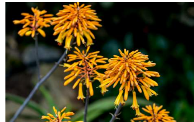
Aloe da montanha ( Aloe succotrina )

27. Aloe succotrina com flores amarelas - aloe da montanha - Família Xanthorrhoeaceae - Distribuição geográfica: Sul da África de terras rochosas e planícies abertas. Podem crescer até 6 m de altura, com folhas duras e acinzentadas.