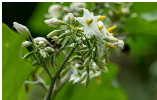
Urubeba florida, jurubeba verdadeira ( Solanum tortum ou paniculatum )

51. Solanum tortum ou paniculatum - jurubeba florida, jurubeba verdadeira - Família Solanaceae. Planta medicinal com várias propriedades como anti-inflamatória, cicatrizante, digestiva, depurativa do sangue e tônica. Parte utilizada: raízes, folhas, flores e frutos. Raízes e folhas são antidiabéticas.