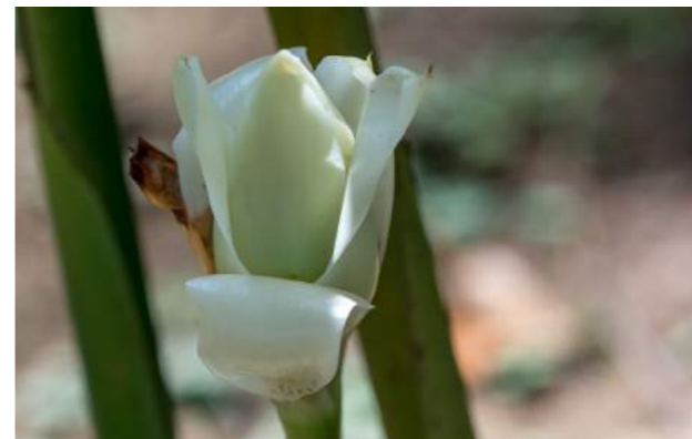
Alpinia, colônia, gengibre-concha, flor-do-paráiso e louro-de-baiano ( Alpinia zerumbet )

60. Alpinia zerumbet , a colônia tem vários nomes: alpinia, colônia, gengibre-concha, flor-do-paráiso e louro-de-baiano . Família: Zingiberaceae. Distribuição geográfica: China e Japão. As flores têm uma textura de porcelana e um delicado colorido rosado. As folhas quando trituradas produzem um perfume suave e delicioso. Depois de secas, as flores podem ser usadas para compor um pot-pourri, muito apreciado para perfumar ambientes. Utilizada na perfumaria, esta espécie tem várias aplicações medicinais, além da produção de germânica, digestivos e remédios para o estômago.