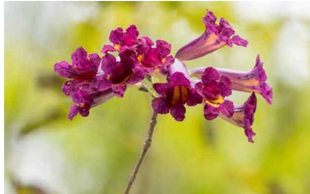
Ipê violáceo, ipê púrpura ( Tebeuia gemmiflora )

um roxo bem escuro com manchas amarelas no interior. Floresce de agosto a outubro. Resistente à seca e queimadas. Introduzida no paisagismo por Roberto Burle Marx.