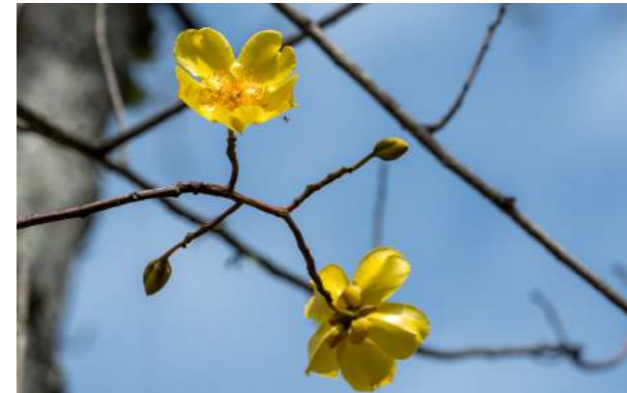
Botão-de-ouro, algodão do mato ou algodão de travesseiro ( Cochlospermum vitifolium )

44. Cochlospermum vitifolium - Junto ao Bromeliário a floração que permanece durante mais de um mês - Família Bixaceae - Distribuição geográfica: México, América Central, América do Sul e Brasil, onde é mais frequente na Caatinga. Outros nomes: botão-de-ouro, algodão do mato ou algodão de travesseiro . É uma árvore alta, que perde todas as folhas nos meses de julho-agosto e se veste de grandes flores vistosas de cor amarelo dourado brilhante, durante mais de um mês. As sementes são envoltas por fibras brancas e sedosas semelhantes ao algodão, utilizadas como enchimento de travesseiros e colchões. É de significativa importância medicinal e foi empregada principalmente pelos Maias. Muitas vezes é confundida com os ipês, mas, suas flores são maiores e a floração se estende por muito mais tempo. É também conhecida como “Brazilian rose”.