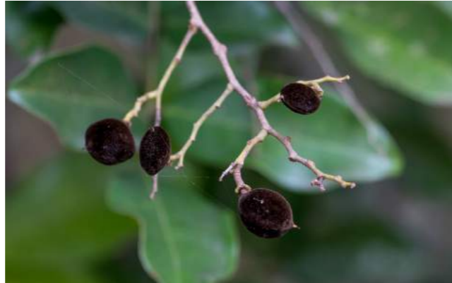
Jitaí, veludo ( Dialium guineense )

perado com chili. Em Gana, as folhas com gosto amargo, fazem parte de um prato especial. As cascas e folhas têm propriedades medicinais, antimicrobianas. A madeira é densa, dura e compacta com cerne castanho-avermelhado, empregada na construção de casas e pavimentação. O nome específico significa "da Guiné". A fruta, uma vez que flutua, é transportada pelas correntes marítimas, podendo ocorrer a dispersão em longas distâncias.