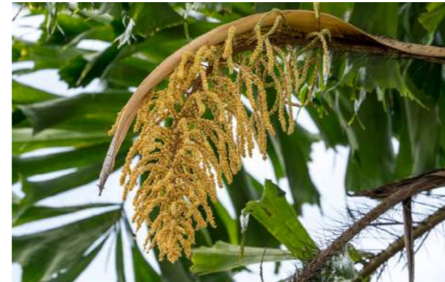
Corozo ( Aiphanes aculeata )

34. Aiphanes aculeata - corozo - No cômoro, estão os corozo ou cariotas-de-espinho, palmeiras com longos espinhos pretos por todo o seu tronco, com um bonito cacho florido. Produz decorativos cachos de frutos, vermelhos, sempre disputados pelos mais diversos pássaros, principalmente pelas belíssimas saíras de sete-cores. Encontram-se nativos na parte ocidental do estado do Acre.