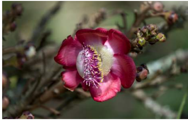
Abricós de macaco, cuia-de-macaco, macacarecuia ( Couropita guianensis )

74. Cassia moschata - fava-mari-mari, mari-mari-da-várzea, seruaiá, ingá-mare. Família: Fabaceae. Distribuição geográfica: Região Amazônica, principalmente nos estados do Pará e Amazonas. Árvore de 4 a 10 metros de altura, dotada de copa ampla e rala, com tronco geralmente tortuoso. Extremamente ornamental por ocasião da inflorescência, com vistosas flores amarelas pendentes. A fruta é muito apreciada in-natura. Tem uma vagem amarelada quando madura, com muitas sementes envoltas em polpa suculenta, com sabor adocicado, consumidas pelas populações locais e animais silvestres. É utilizada em construções rústicas, cabos de ferramentas, confecção de brinquedos e caixotaria em geral.