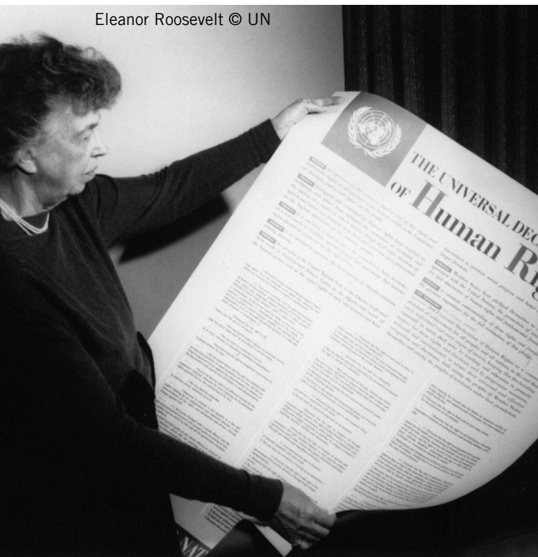
Eleanor Roosevelt