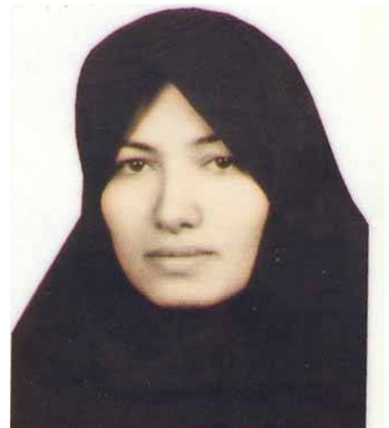
Sakineh Mohameddi Ashtiani