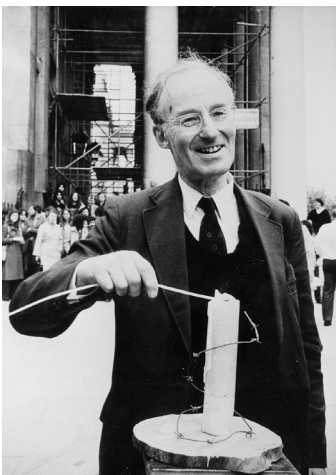
Peter Benenson

Dyma'r paragraff cyntaf (wedi'i gyfieithu): 'Agorwch eich papur newydd ar unrhyw ddiwrnod yr wythnos ac mi welwch chi adroddiad o rywle yn y byd sy'n sôn am rywun yn cael ei garcharu, ei arteithio neu ei ddienyddio gan fod ei farn neu ei grefydd yn annerbyniol i'w lywodraeth. Mae yna filiynau o bobl o'r fath yn y carchar... ac mae'r niferoedd yn cynyddu. Mae teimlad cyfogyd o anallu yn taro darlennydd y papur. Ond, os byddai modd uno'r teimladau hyn o ffeiddra o amgylch y byd i greu gweithred gyffredin, byddai modd gwneud rhywbeth effeithiol.'