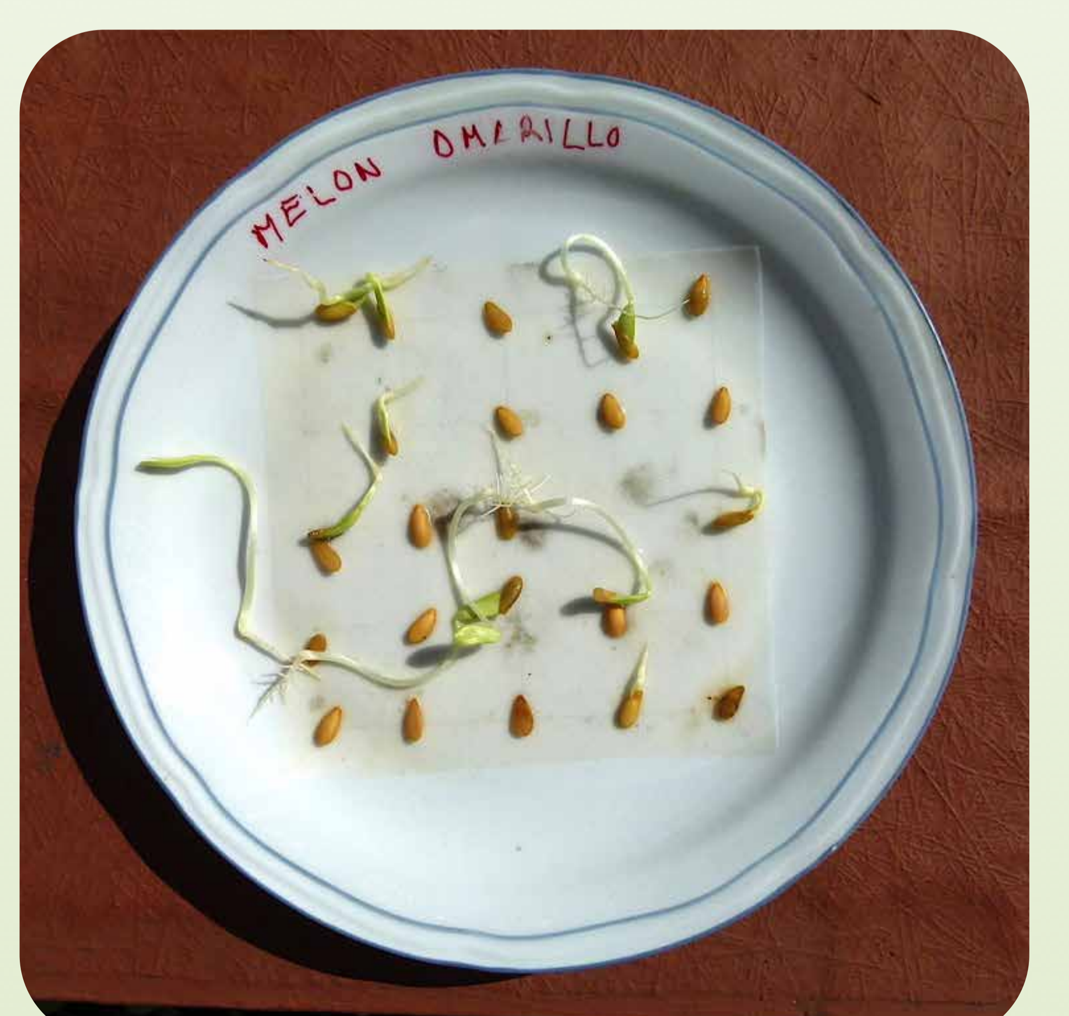
15. Test de germinación de semilla de melón mostrando una importante pérdida de poder germinativo