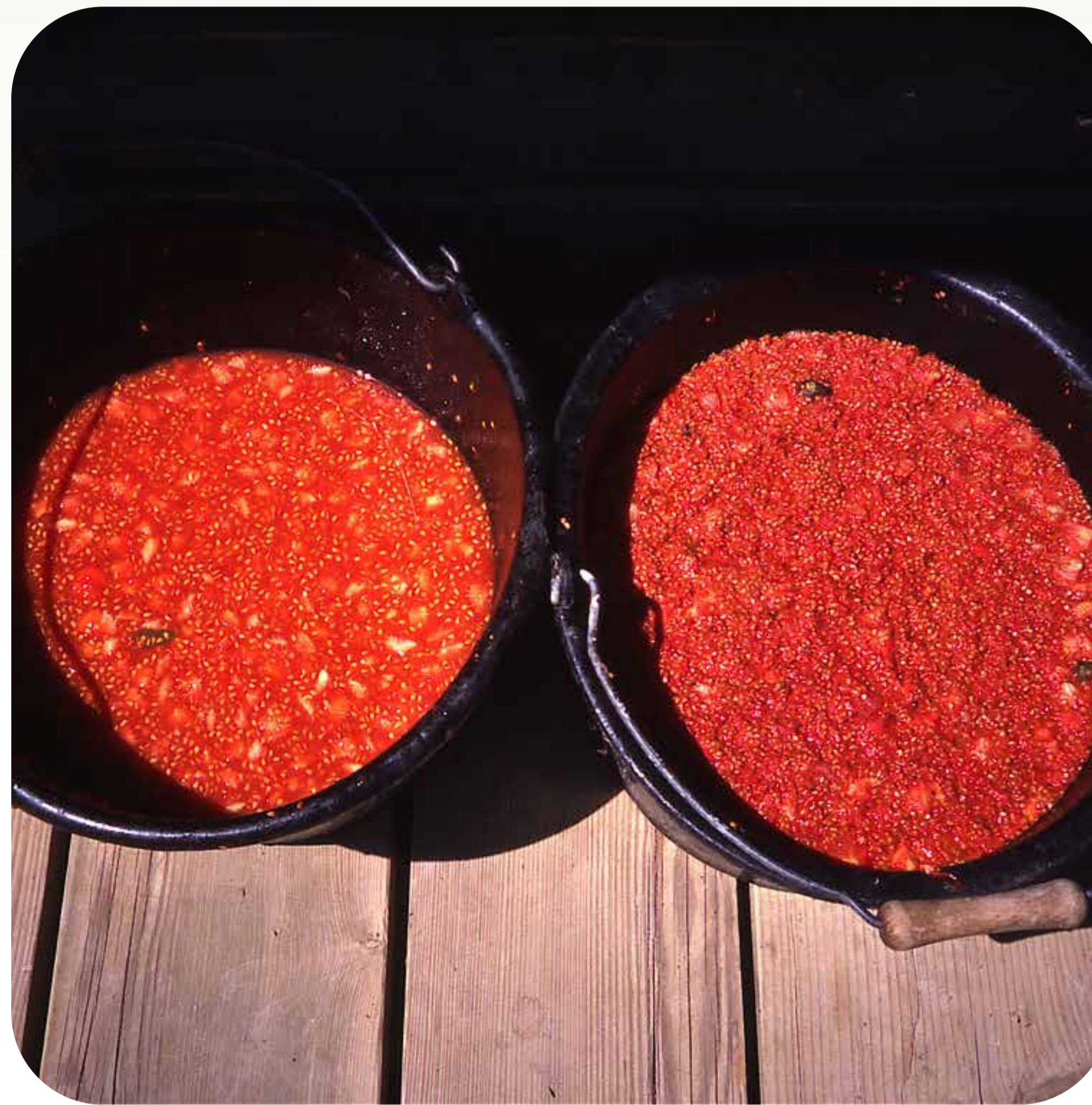
5. A la izquierda, semillas de tomate recién extraídas y, a la derecha, semillas tras varios días de fermentación