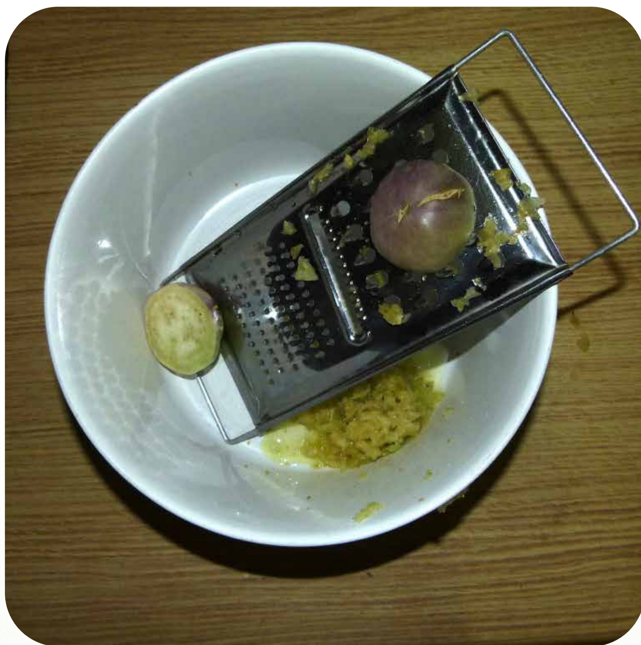
7. Rallado de un fruto maduro de fisalis Familia solanáceas