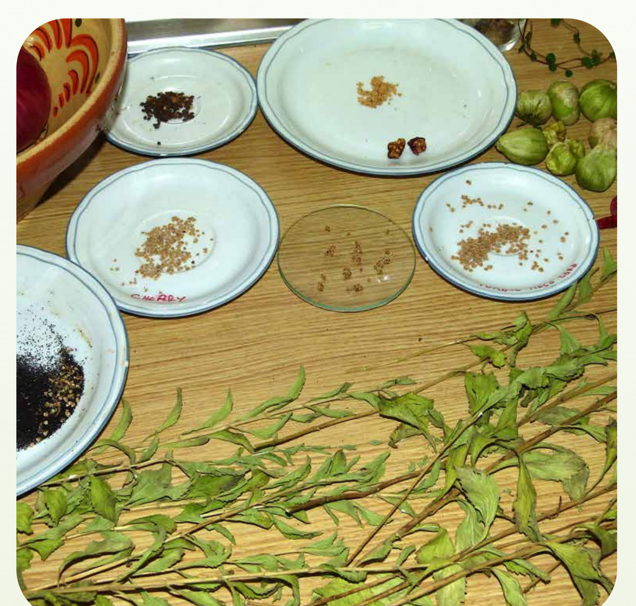
12. Conjunto de varias semillas de hortalizas acabando de secarse antes del envasado