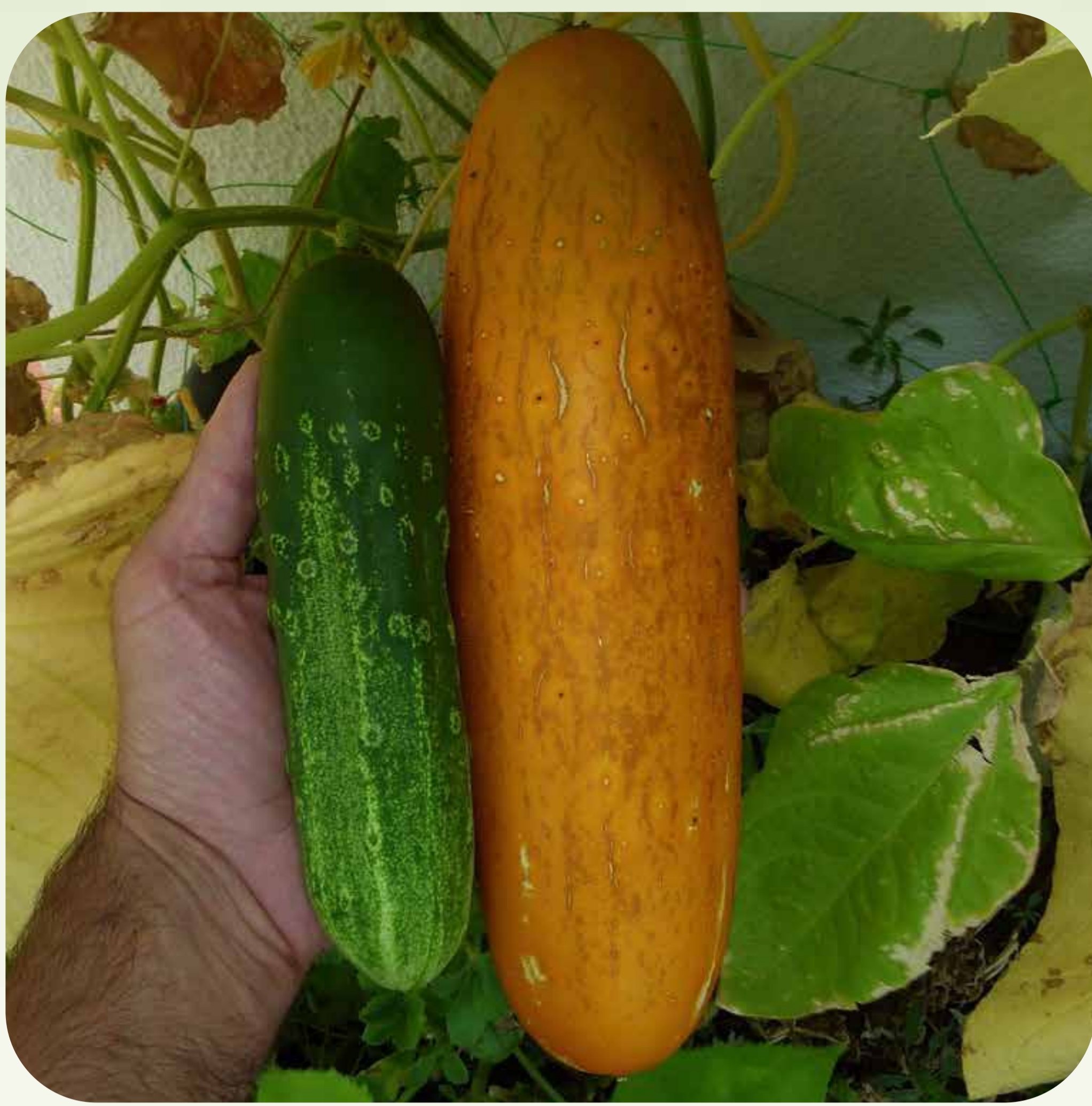
1. Frutos verde y maduro de pepino Familia cucurbitáceas