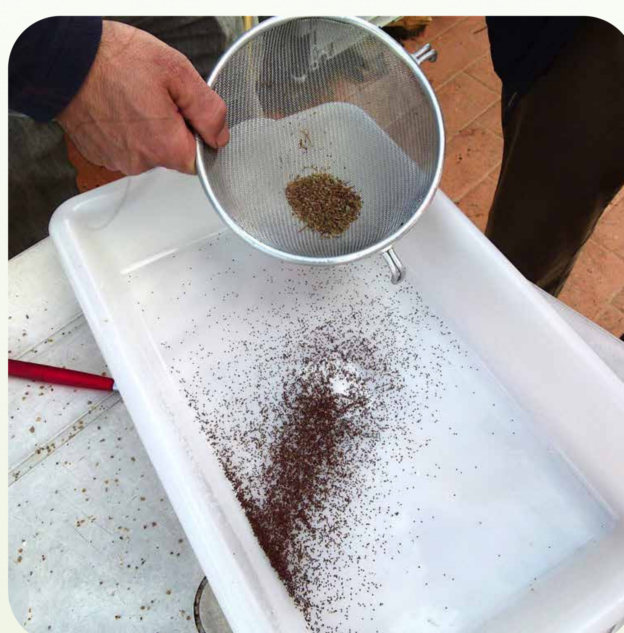
11. Cribado con colador de semillas de tomillo Familia lamiáceas (= labiadas)