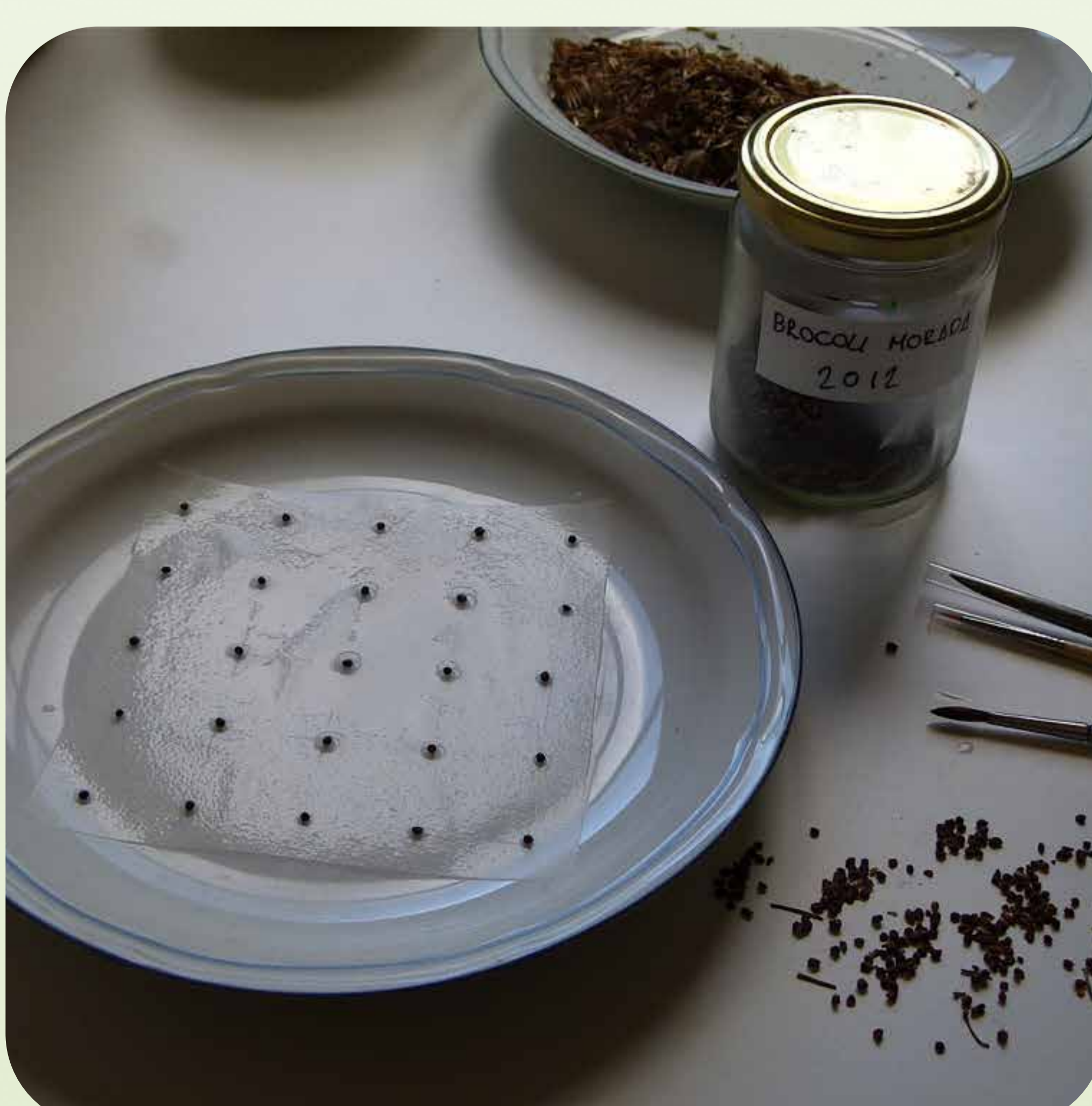
14. Preparación de un test de germinación de brócoli usando pinceles húmedos para colocar las semillas