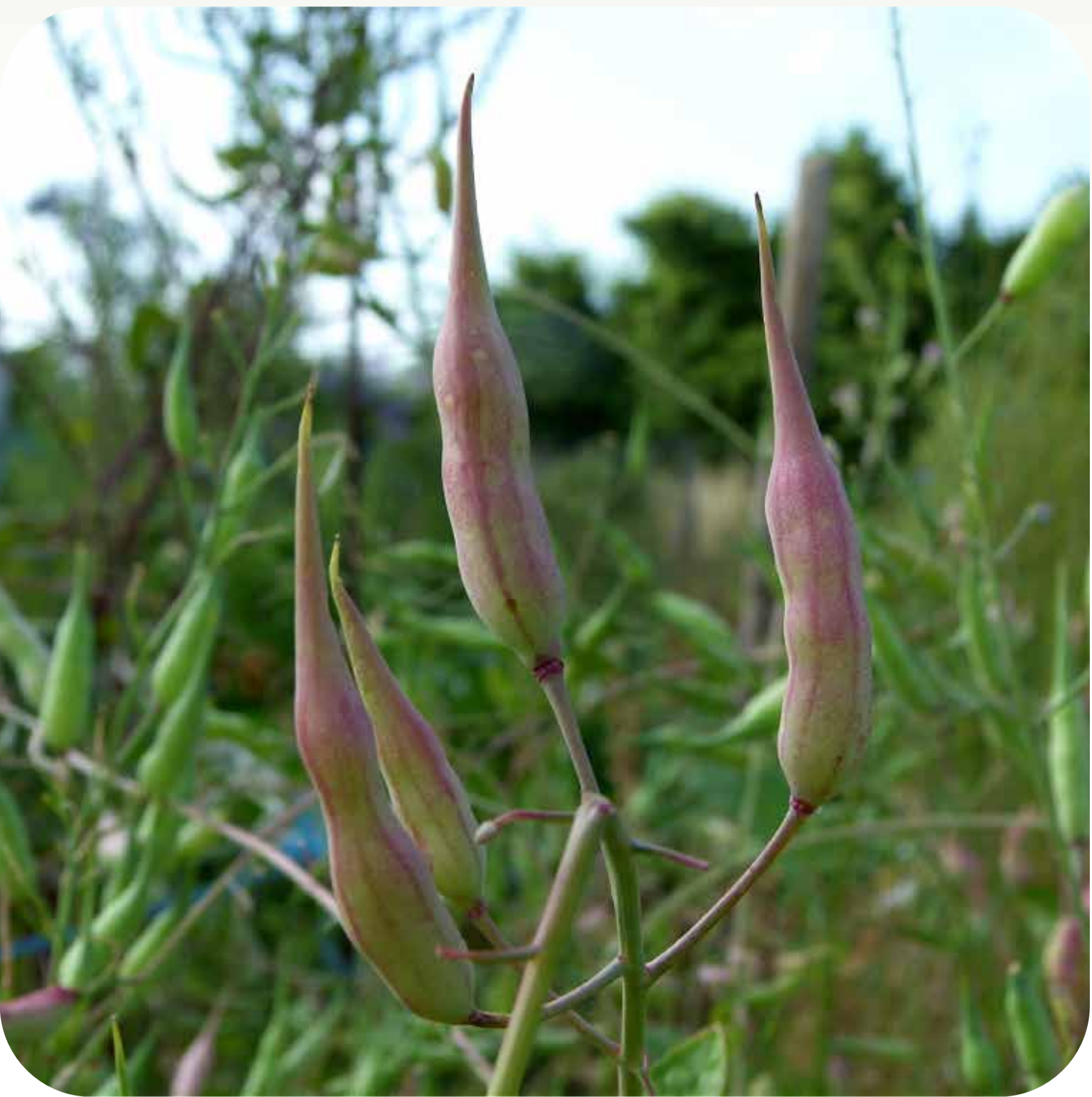
4. Frutos de rábano aún verde Familia brassicáceas (= crucíferas)