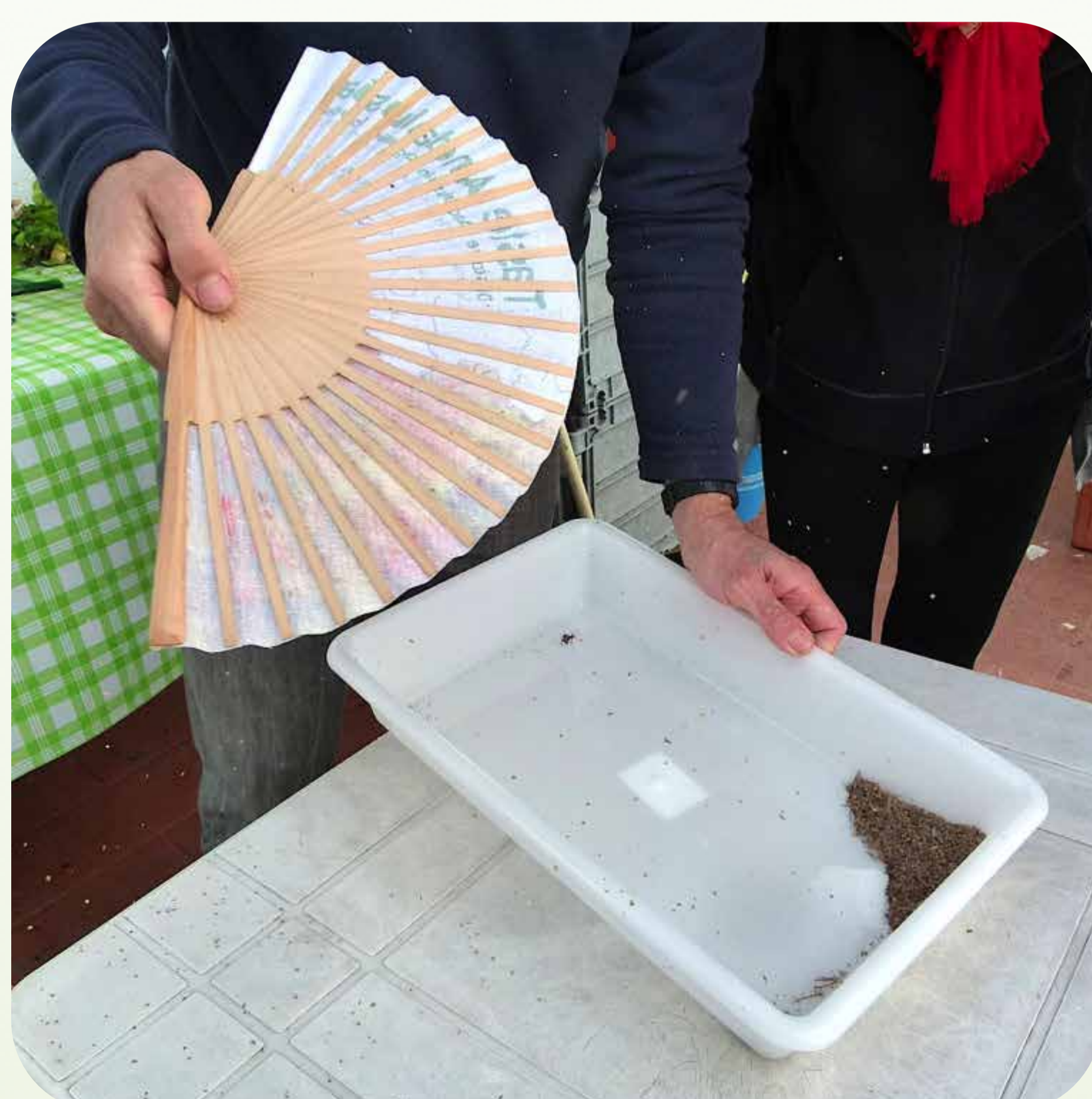
10. Aventado de semillas de tomillo Familia lamiáceas (= labiadas)