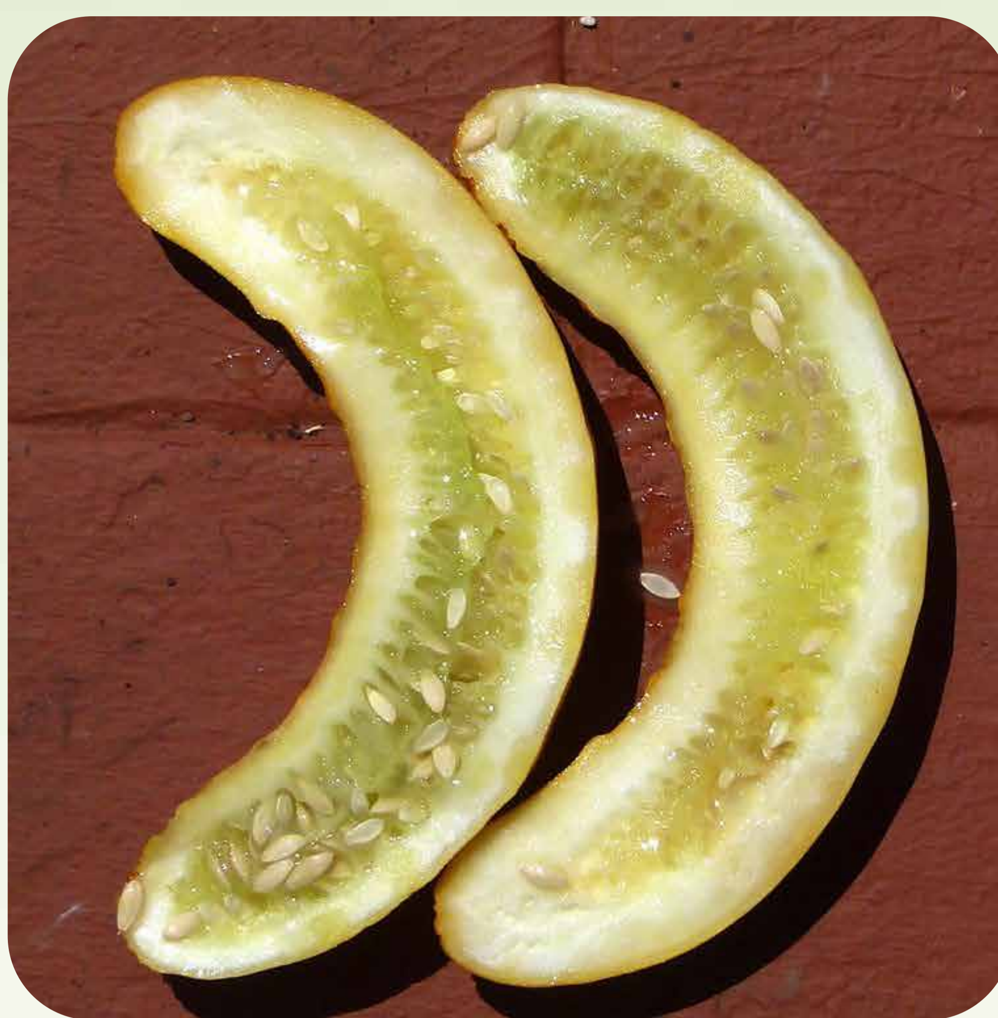
2. Fruto maduro de pepino con pocas semillas debido a una polinización deficiente