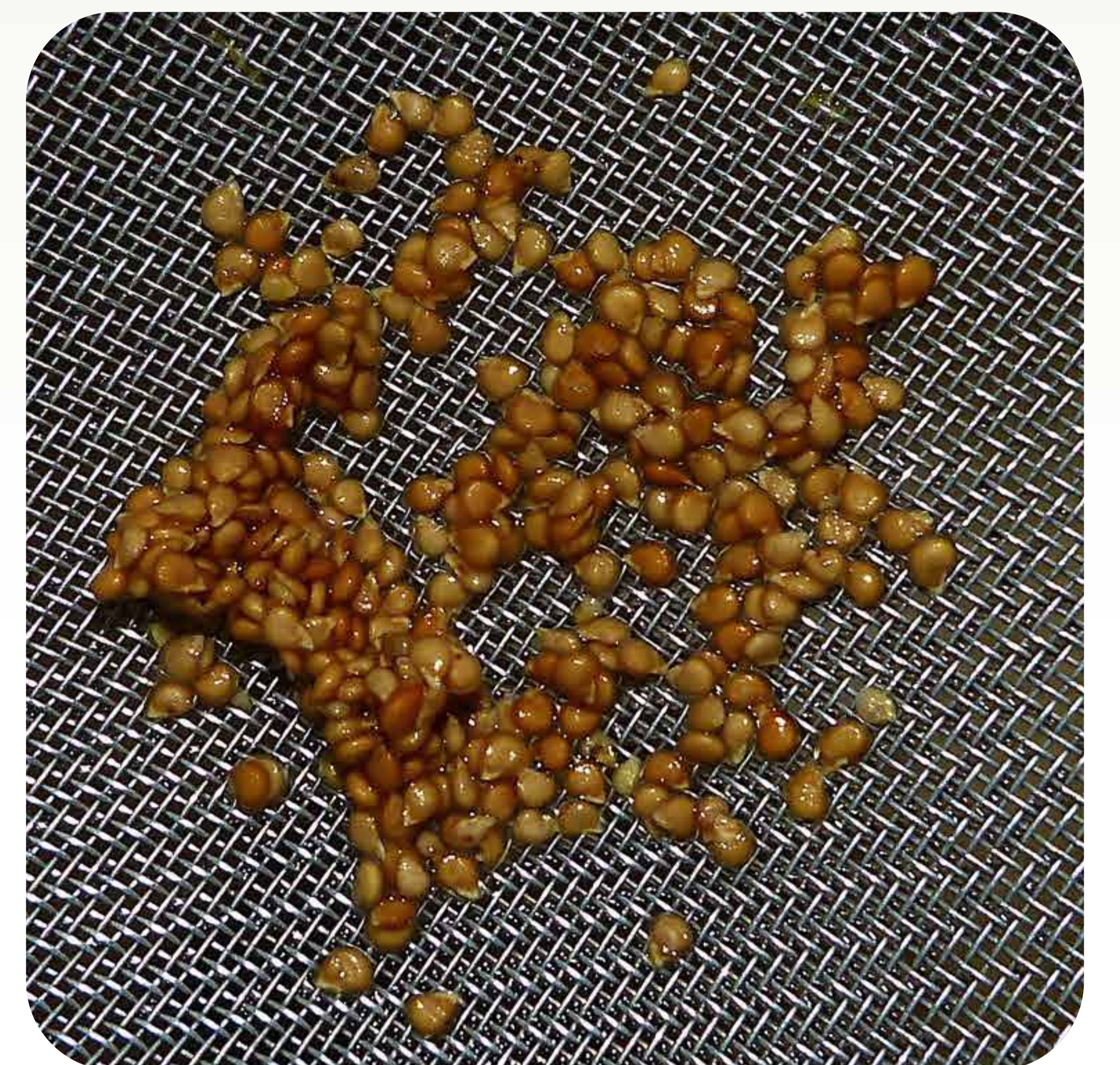
6. Lavado de semillas de tomate tras varios días de fermentación en su propio jugo