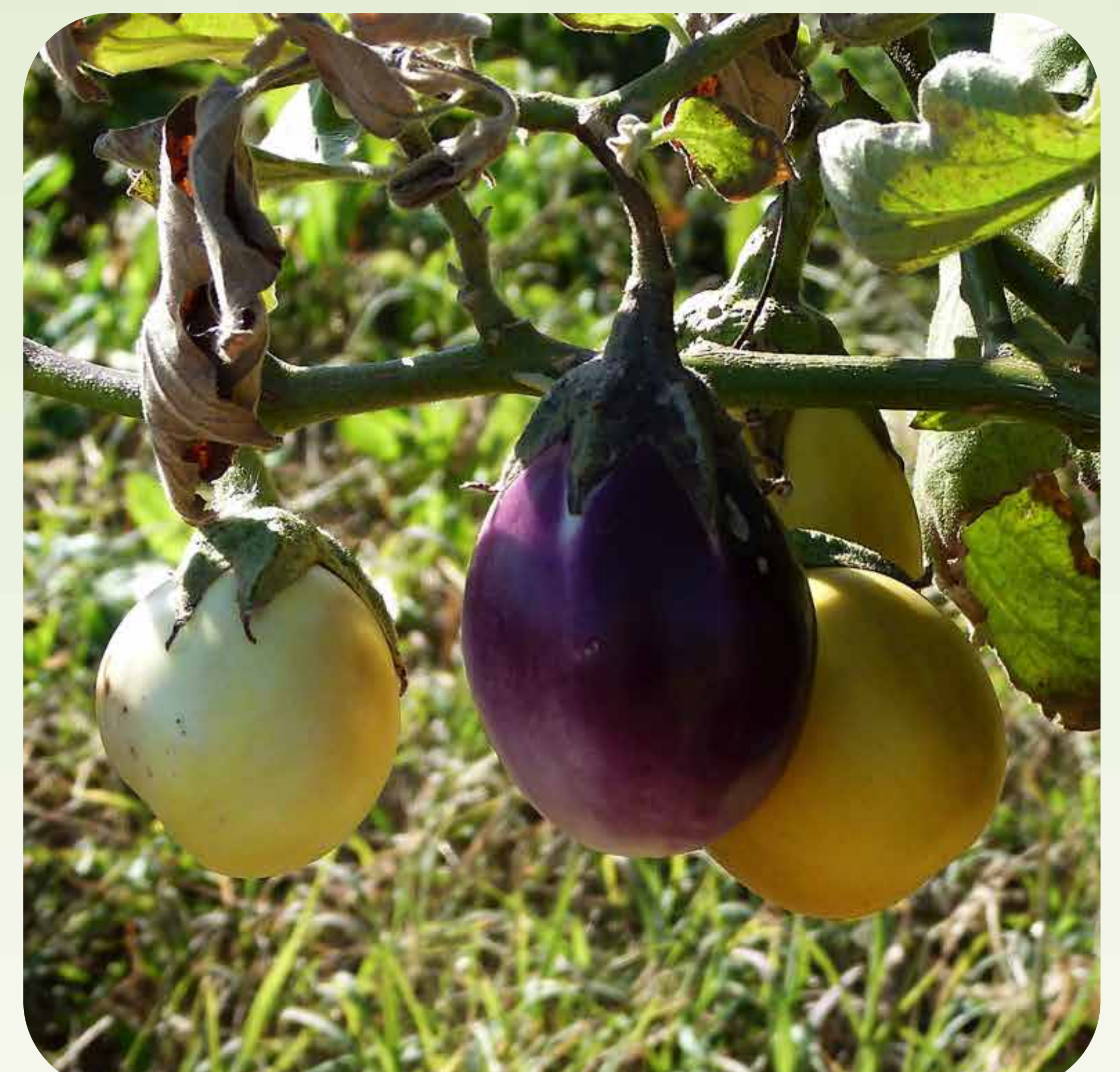
3. Frutos de berenjena en distintos estados de maduración Familia solanáceas