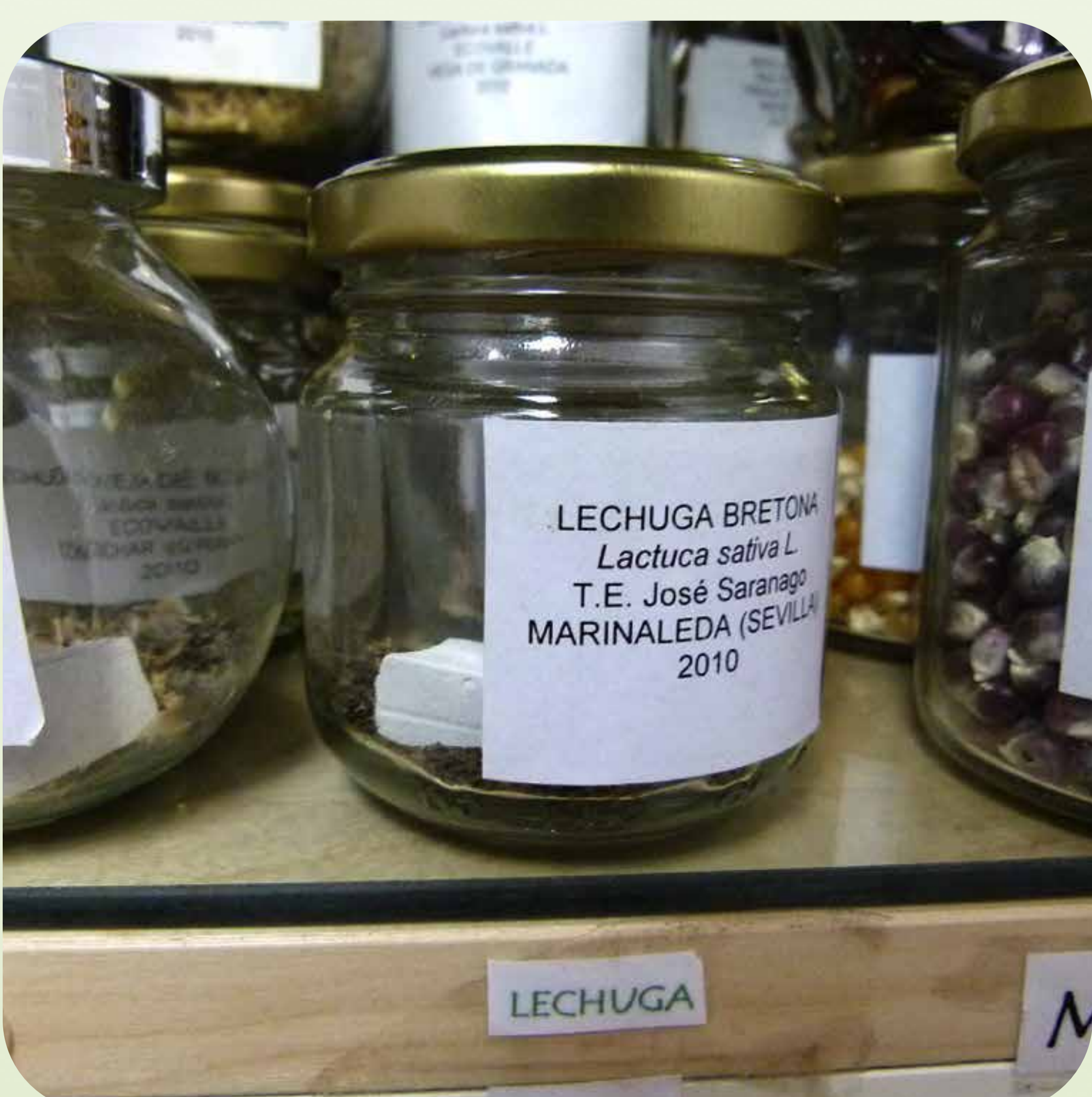
13. Semillas conservadas en sitio fresco y oscuro dentro de un frasco hermético con una tiza para absorber la humedad