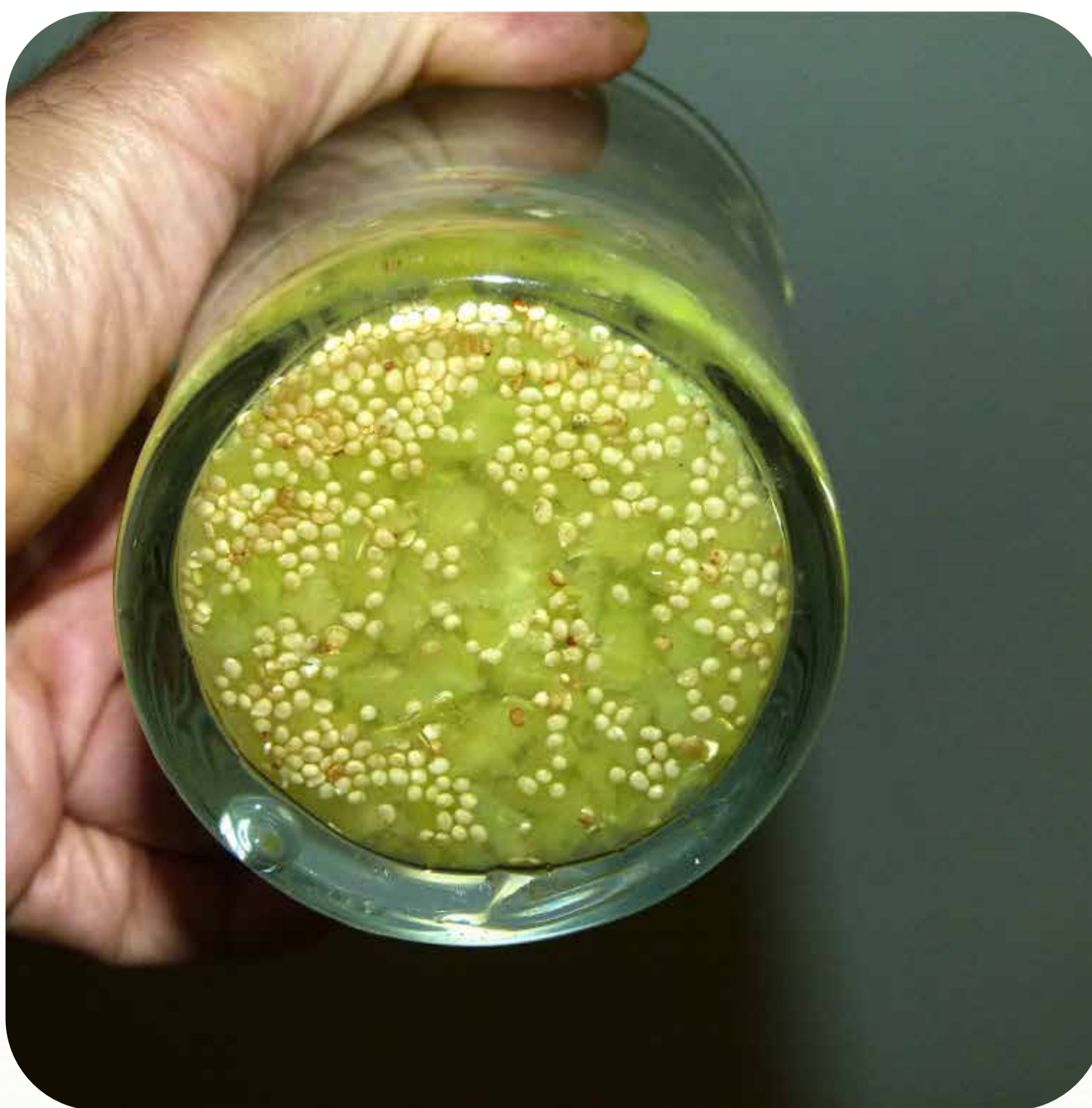
8. Separación por decantación de la pulpa y la semilla de fisalis Familia solanáceas