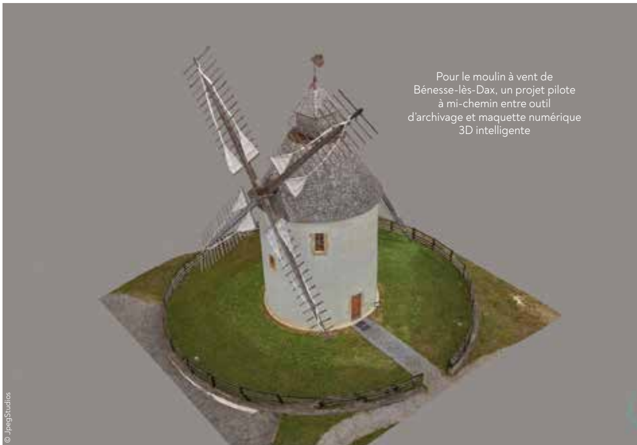
Pour le moulin à vent de Bénesse-lès-Dax, un projet pilote à mi-chemin entre outil d'archivage et maquette numérique 3D intelligente