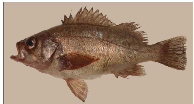
図 8 クロメバル Sebastes ventricosus , ca. 200 mm SL, off Ajigasawa, Aomori (fresh condition).