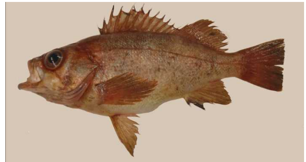
図 6 アカメバル Sebastes inermis , ca. 250 mm SL, off Ajigasawa, Aomori (fresh condition).

ての沿岸域に分布するとしている。しかし、過去の青森県産の魚類相に関する研究からは上述の 3 種がいずれの地域に分布するのかわからない。本研究ではアカメバルを鱒ヶ沢町と外ヶ浜町平館沖、シロメバルを青森市浅虫沖、クロメバルを鱒ヶ沢町、外ヶ浜町平館および青森市浅虫沖から確認した。