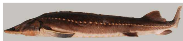
図 5 チョウザメ Acipenser medirostris , HUMZ 103660, ca. 120 cm TL, off Mutsu, Aomori (preserved in formalin).

HUMZ 103660 (ca. 120 cm TL), むつ市脇野沢, 定置網, 1983年 10月 (図 5).