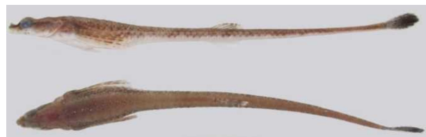
図1 タテトクビレ Aspidophoroides monopterygius , ca. 160 mm SL, off Hachinohe, Aomori (fresh condition).