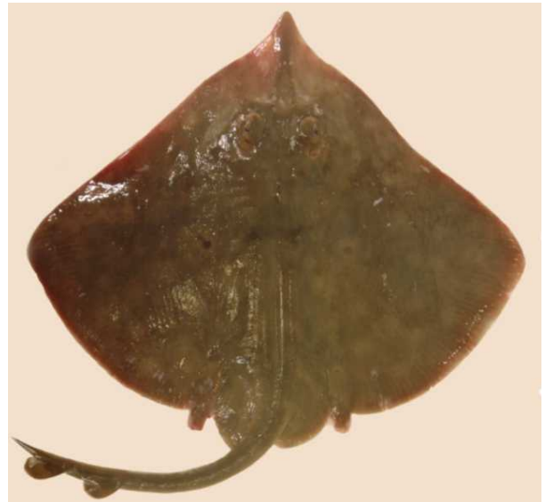
図 3 ガンギエイ Dipturus kwangtungensis , ca. 300 mm TL, off Tsugaru, Aomori (fresh condition).