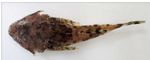
図 10 ニホンキンカジカ Cottiusculus nihonkaiensis , 75.0 mm SL, off Sai, Aomori (fresh condition).

キンカジカ Cottiusculus schmidti : つがる市高山沖, 57.0 mm SL, 水深 100 m, 試験船青鵬丸オッタートロール, 2013.7.1; むつ市大畑沖, 59.0–62.3 mm SL, 4 個体, 水深 205 m, 試験船青鵬丸オッタートロール, 2013.9.26; 三沢市塩釜沖, 58.4 mm SL, 水深 148 m, 試験船青鵬丸オッタートロール, 2013.11.6 (図 9).