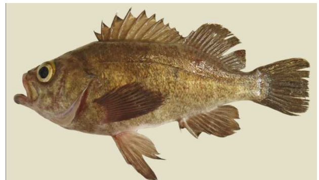
図 7 シロメバル Sebastes cheni , ca. 240 mm SL, off Asamushi, Aomori (fresh condition).