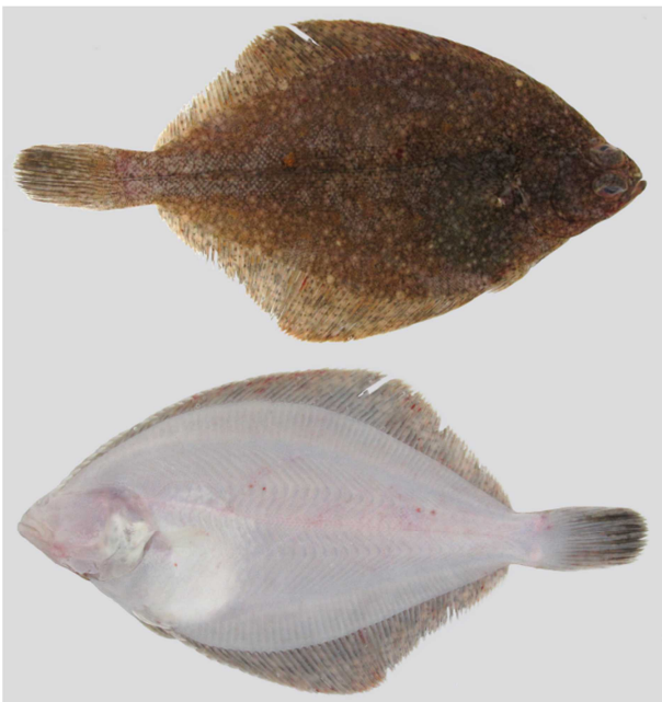
図 2 シュムシュガレイ Pleuronectes bilineatus , 170.0 mm SL, off Fukaura, Aomori (fresh condition, upper: ocular side, lower: blind side).