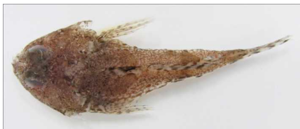
図 9 キンカジカ Cottiusculus schmidti , 58.4 mm SL, off Misawa, Aomori (fresh condition).