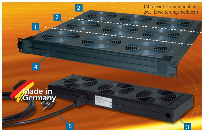
(Abb. zeigt Grundmodul mit zwei Erweiterungsmodulen)

Das Lüfter-Erweiterungsmodul ist ebenfalls als 1-, 2- oder 3-fache Einheit erhältlich und stellt eine steckbare mehrfache Erweiterung des Lüftergrundmoduls dar. Die mechanische Verbindung der Module erfolgt über Aluminium-Führungsbolzen (im Lieferumfang enthalten). Auf der Frontseite ist das Erweiterungsmodul mit einem Stecker, auf der Rückseite mit einer Buchse ausgestattet. So wird durch das Anreihen automatisch die elektrische Verbindung zwischen den Modulen hergestellt.