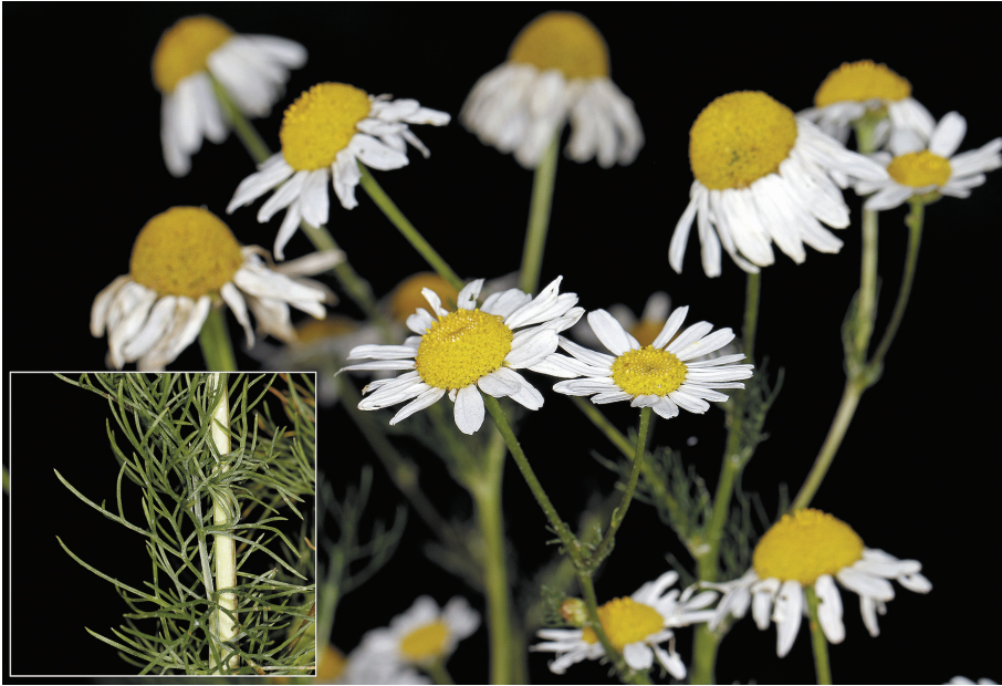
Fig. 5.- Tripleurospermum inodorum , Ibarberango (Getxo)