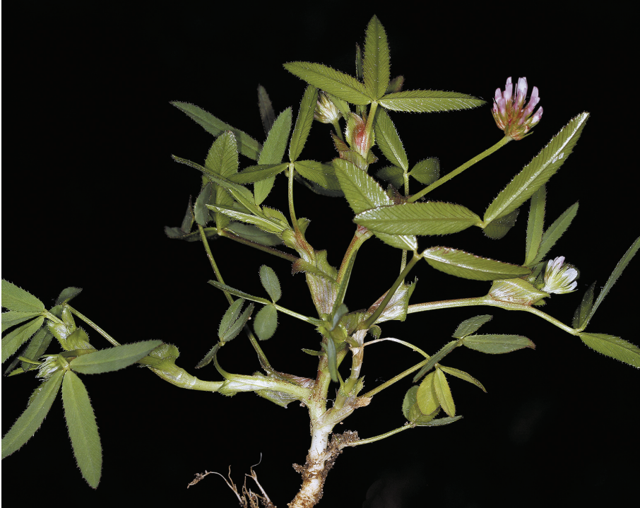
Fig. 4.- Trifolium strictum , Quintana (Izkiz)

Bi, Getxo, Ibarberango, 30TVP9901, 8 m, rotonda bajo la autopista, 7.07.2013, E. Fidalgo. Herbario personal ALF nº 2014-06-28 (14).