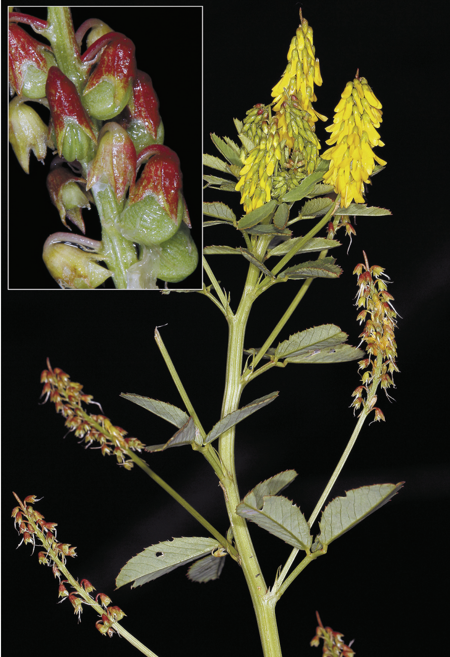
Fig. 7.- Melilotus segetalis , Bareño (Sopelana)