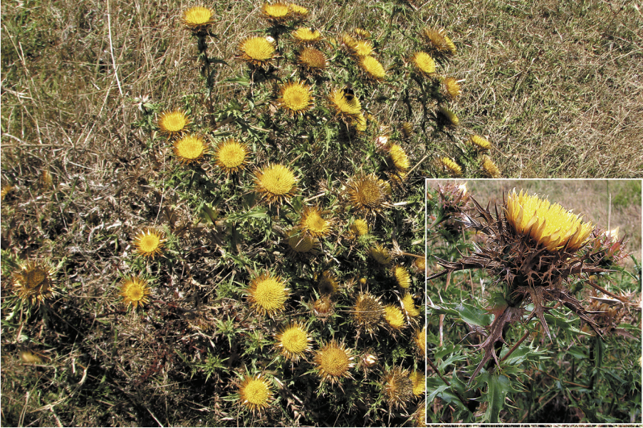
Fig. 6.- Carlina corymbosa subsp. major , Fanos (Gorliz)

Bi, Gorliz, Urezarantza, 30TWP0507, 100 m, prado sobre margas, 19.07.2013, J.A. Cadiñanos y E. Fidalgo. Herbario personal nº 130701.