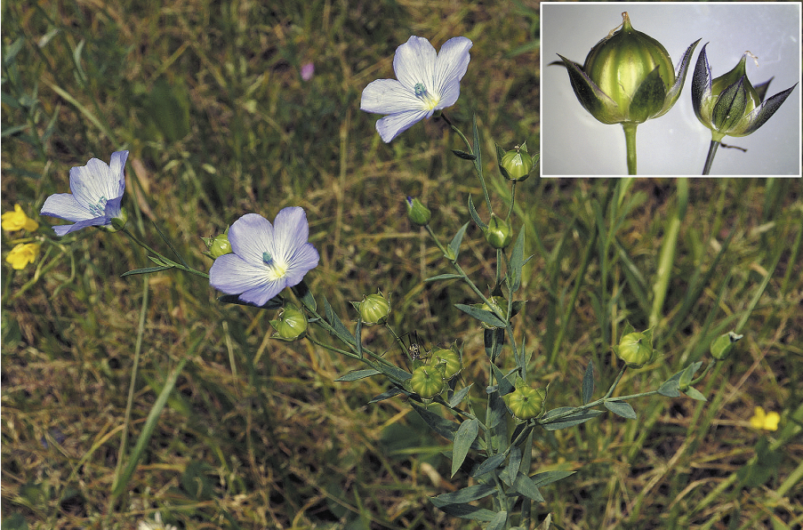
Fig. 9.- Linum usitatissimum , Ontón (Castro Urdiales). En la foto pequeña, a la derecha, cápsula de L. bienne .

Fig. 9.- Linum usitatissimum , Ontón (Castro Urdiales). In the small figure, right, capsule L. bienne .