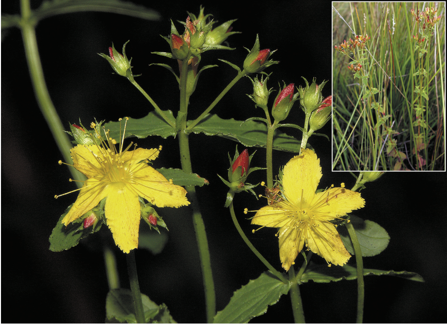
Fig. 2.- Hypericum undulatum , Goierri (Erandio) y, la foto pequeña, de Fuentelateja (Castro Urdiales) Fig. 2.- Hypericum undulatum , Goierri (Erandio) and, small figure Fuentelateja (Castro Urdiales)

A pesar de su corología eurosiberiana apenas existen citas al norte de la divisoria de aguas mediterráneo-cantábrica, si exceptuamos la de Herrera (1995: 117). En Burgos, no nos consta ninguna anterior, ya que Alejandre et al. (2006: 406) sólo la han encontrado en la zona media y sur de la provincia.