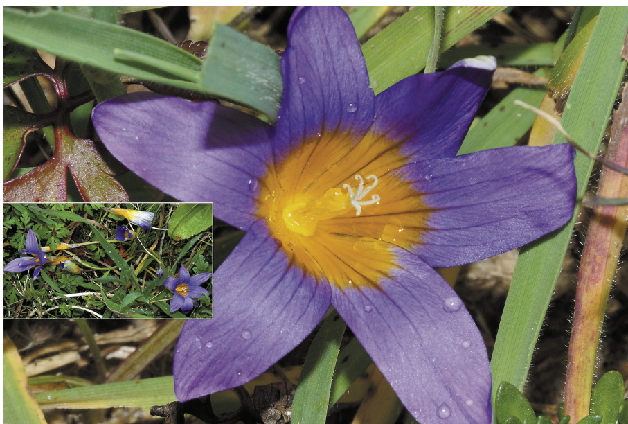
Fig. 8.- Romulea clusiana , Playa de Berria (Santoña)

Recientemente citada también de las dunas de Trengandín (Noja), Cantabria (Carlón et al. , 2013: 115) ésta sería la segunda para la región. Al parecer se está expandiendo de oeste a este por los sistemas dunares cantábricos, ya que existen también referencias recientes de Asturias. Como afirman los autores antes citados, este endemismo de los arenales de las costas atlánticas ibéricas y marroquíes -que al parecer solo se insinúa levemente en la costa mediterránea malagueña y en contadas localidades de la submeseta sur- supone novedad cántabra casi inmediatamente después de haberlo sido para Asturias -cf. Porto Torres (2013: 4)-, y en conjunto ve desplazarse 300 km hacia el este un área en el noroeste peninsular cuyo extremo, como quedo dicho, bien creímos estar señalando con mucha aproximación al hacer la cita de la Marina lucense que figura en Aedo et al. (2001: 93).