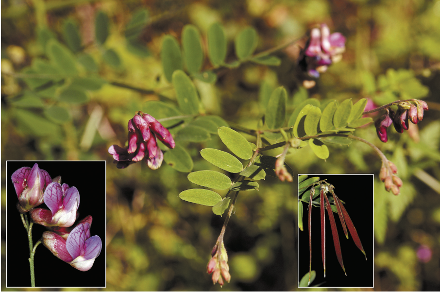
Fig. 3.- Lathyrus niger , Concejero (Valle de Mena)

S, Castro Urdiales, monte San Pelayo, 30TVP8102, 150 m, herbazal en lapiaz, 24.05.2014, J.A. Cadiñanos y A. Llorente.