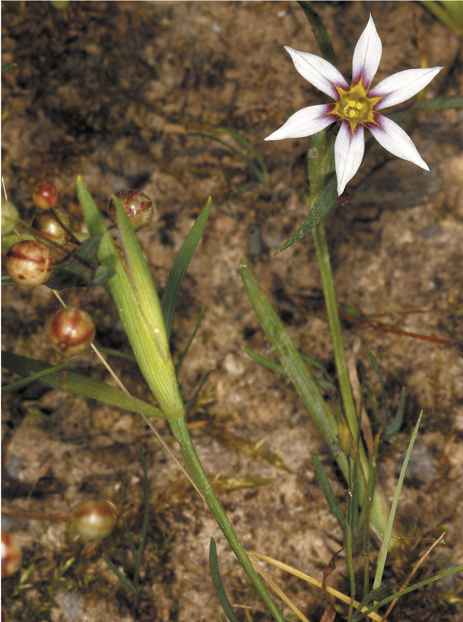
Fig. 10.- Sisyrrinchium rosulatum , Monte Mello (Muskiz)

Se trata de una especie originaria del SE de Norteamérica que, en España, Castroviejo et al. (2014: 452-454), sólo anotan su presencia en las provincias de Huelva y Pontevedra. Por tanto, nuestra cita supone novedad para Vizcaya.