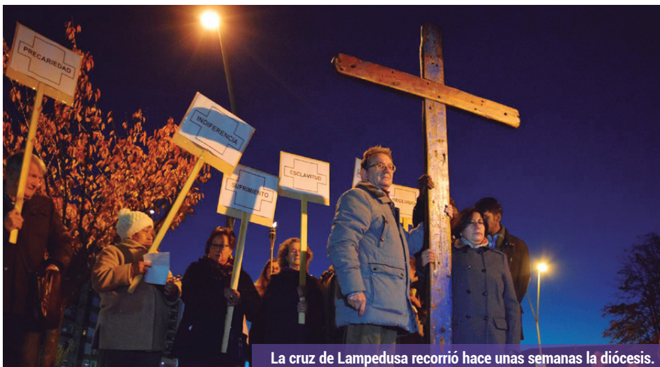
La cruz de Lampedusa recorrió hace unas semanas la diócesis.