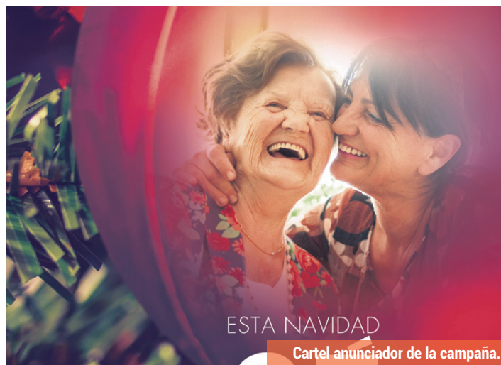
Cartel anunciador de la campaña.

Las causas que han llevado a una disminución de los donativos apuntan a la percepción de la salida de la crisis entre la población. Durante los años más agudos de la recesión se mantuvieron las aportaciones, e incluso aumentaron, lo que permitió sostener el ritmo de ayudas y puso de manifiesto una enorme solidaridad en Burgos. Paradójicamente, la mejoría de algunos datos macroeconómicos ha transmitido la idea