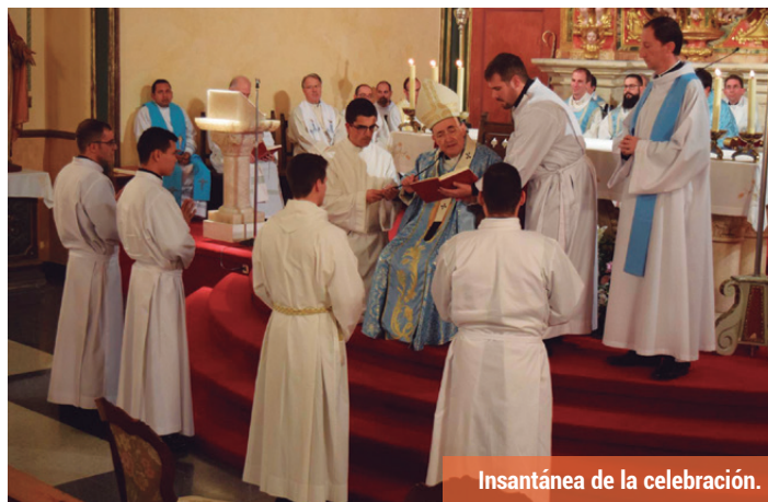
Insantánea de la celebración.

La ceremonia se desarrolló en la capilla del Seminario de San José en el marco de una celebración eucarística. En su homilía, el pastor de la diócesis les recordó que «vosotros fuisteis creados por