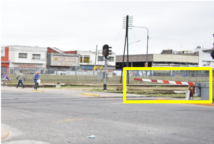
Figura 4- El brazo de barrera descendente (Av. Maipú), presenta una rotura (ya verificada en el relevamiento realizado el 01/11/2021).