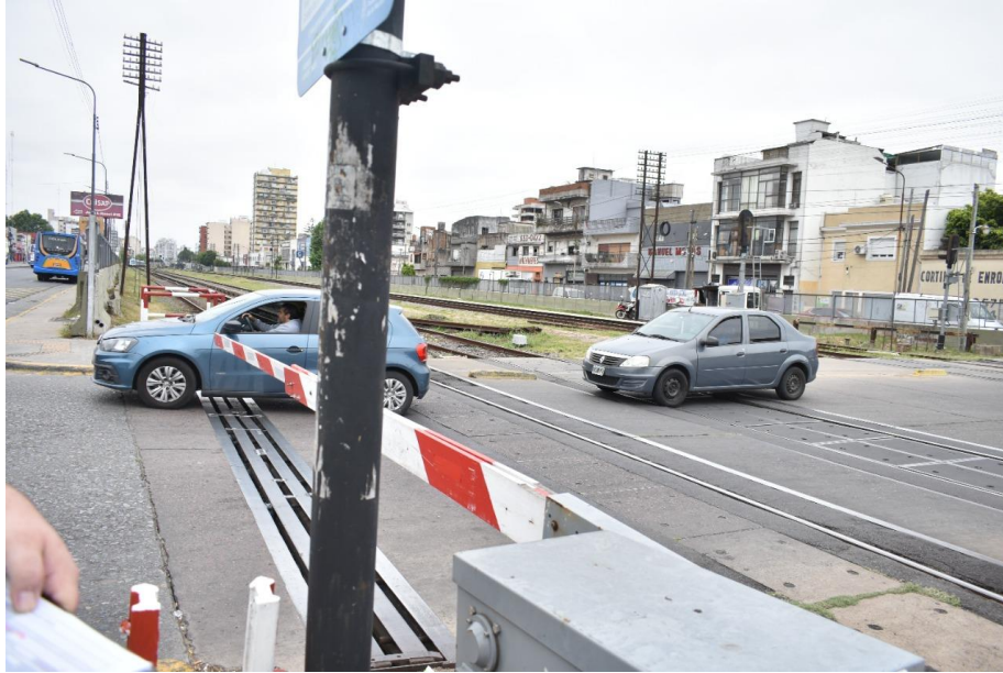
Figura 7-8-9- Uno de los carteles se encontró sin ningún tipo de gráfica y los otros dos (que son los contrarios a los laberintos que tienen la barrera), no contaban con ningún tipo de cartelería o señal fono luminosa.