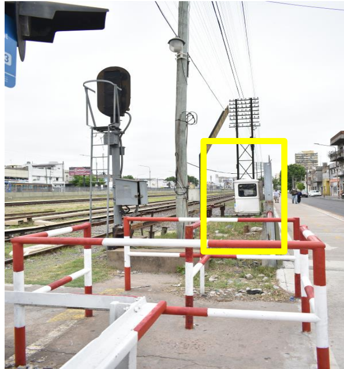
Figura 3 – Los peatones tienen una escasa visibilidad ya que aproximadamente a 6 Mts del paso peatonal se encuentra una garita que interfiere en la visualización de la formación, cuando circula de forma descendente (Av. Maipú).