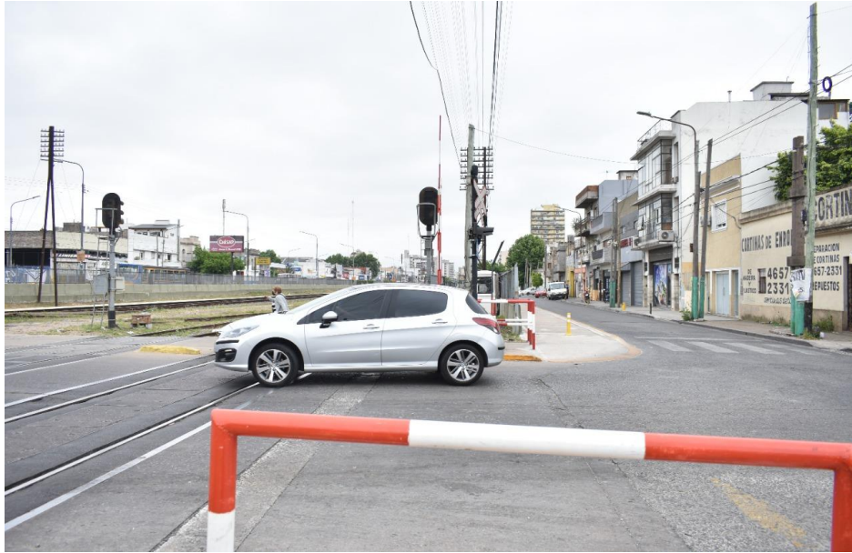
Figura 12- No existe señalización pasiva vertical ni horizontal en ambas arterias de acceso vehicular que advierta a los conductores y/o peatones sobre la proximidad del paso a nivel.