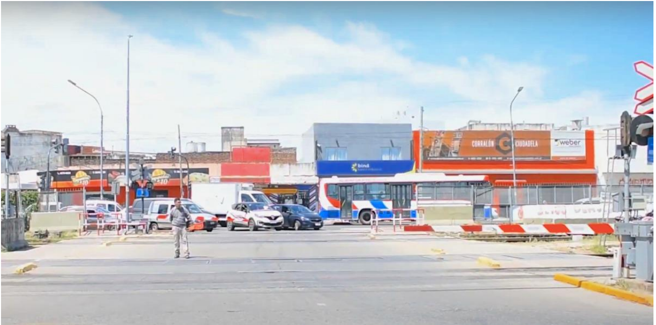
Figura 6- Se observó que la barrera en ocasiones permaneció baja hasta por 11 minutos aproximadamente (con promedios en general, entre 3 a 6 min), esto genera un embotellamiento en el tránsito vehicular adyacente.