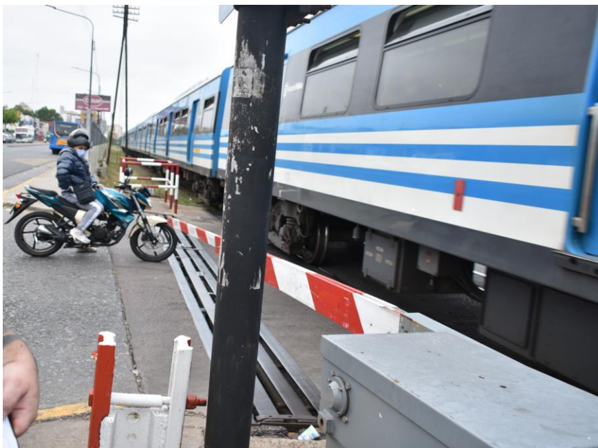
Figura 5- El brazo de barrera ascendente (Av. Rivadavia), posee una curvatura en el eje transversal respecto a la infraestructura ferroviaria, que se desvía en su extensión aproximadamente 40 cm hacia el lado de la citada avenida.