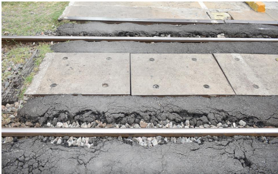
Figura 10-11 – El paso peatonal presenta roturas.

Los peatones al cruzar por la senda peatonal lo realizan mirando a ambos lados de la circulación ferroviaria, por lo que dicha senda en esas condiciones genera un riesgo potencial (perdida de atención) de ocasionar lesiones a las personas que la transitan.