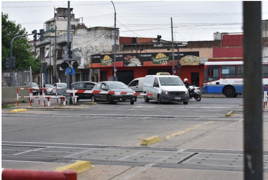
Figura 2 – Los vehículos quedan posicionados a 45°, dado que la distancia entre el cerramiento y la calzada es de 1.05 Mts, el cual reduce significativamente la maniobra de giro hacia el paso a nivel, dicha posición imposibilita ver la aproximación de una formación, dado que el sentido de circulación es el mismo en el que circulan los vehículos antes de ingresar al PAN.