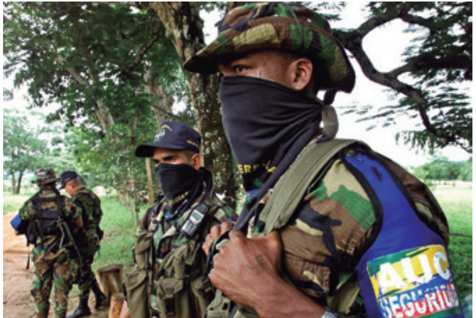
KOLONBIAKO AUTODEFENTSA BATUAK (AUC) eskuin muturreko erakunde paramilitarra izan zen. 1997an sortu eta 2006an desmobilizatu zen.

Kolonbian gauzak ez direla asko aldatu dio Freyterrek eta “lider sozial,