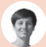
JUNE FERNÁNDEZ KAZETARIA

T abu itzela urratzen ari ginelakoan publikatu genuen 2013. urtean lesbianen arteko indarkeriari buruzko monografiko bat Pikara Magazin -en. 2017. urtean, Sangre Fucsia irratsaio feministak frankismoaren bukaerako eta Trantsizioko lesbianen borrokei buruzko saio bat prestatu zuen, eta horren bidez jakin genuen 80ko hamarkadako aldizkari lesbofeministetan dagoeneko jorratzen zutela gai hori.