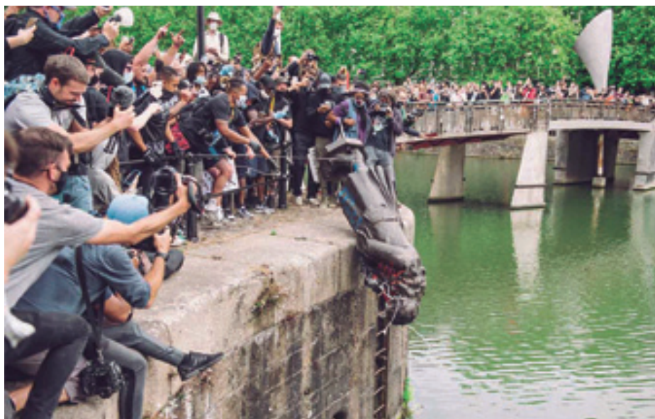
EDWARD COLSTON. ESKLABO-JABEAREN BRONTZETZKO IRUDIA BRISTOLEKO KAIKO URETAN HONDORATU ZUTEN EKAINAREN 7AN, ARRAZISMOAREN KONTRAKO PROTESTAN ARRASTAKA ERAMAN OSTEAN.

Edward Colston (1636-1721) merkatariz gain Londresko Legebiltzarrean parlamentari aritu zen bere bizitzan. Esklaboen salerosketan aberastu zen, Bristoleko beste zenbait handiki bezala: Afrikara espedizioak antolatu jendeak harrapatu eta esklabo bihurtzeko, haiek itsasontziz ekarri lehenbizi Bristolera eta hemendik Ameriketara, funtsean Karibeetara. Bihotzik ez omen duen diru zikinez aberastu ondoren, ordea,