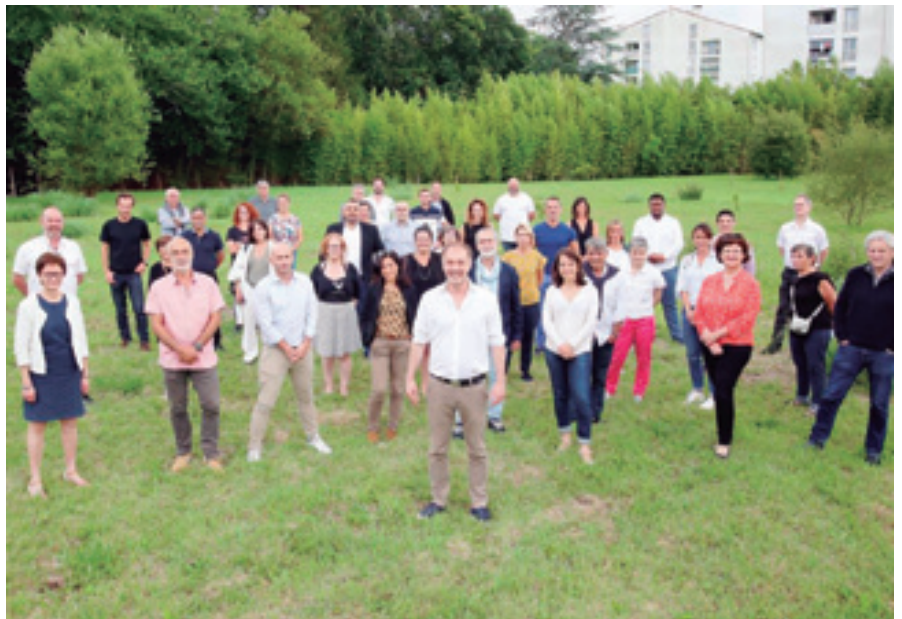
BAIONA HIRI IREKIA

Enpresen goi-bilera kapitalista horrek Espainiako Estatu osoko ezkerreko talde sozial, politiko eta sindikalen berehalako erreakzioa eragin beharko luke, galerak berriro sozializatzea eta etekin pribatizatzen jarraitzea eragozteko. ●