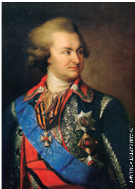
JOHANN BAPTIST VON LAMPI

Orduz geroztik, "Potemkin herria" esamoldea herri baten edo beste edozer gauzaren egoera tamalgarria estali nahian herri edo gauza hori oso ondo