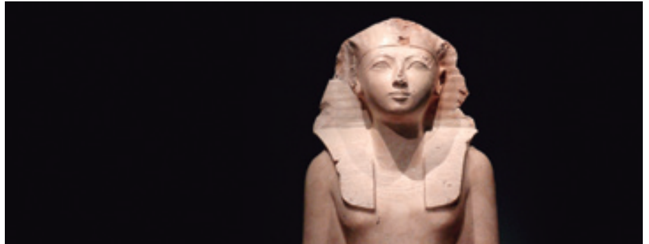
HATSHEPSUT ERREGINAREN ESTATUA. ASKORENTZAT LEHEN EMAKUMEZKO FARAOIA IZAN ARREN, TURINGO ERREGE KANONAREN ARABERA, LEHENA NITOKRIS IZAN ZEN, BAINA HAREN ESTATUARIK EDO IRUDIRIK EZ DAGO.

Baina orain arte ez da aurkitu haren izena jasotzen duen garaiko inskripzioirik eta Nitokrisen aipamenik zaharrena milurte eta erdi geroagokoak dira. Manetonek (K.a. III. mendea) bere epitomeetan esan zuen faraoia “bere garaiko gizon guztiak baino ausartagoa, emakume guztien artean politena, azal ederrekoa eta masail gorriduna” zela. Herodotok (K.a V. mendea), aldiz, haren mendekua eta heriotza jaso zuen Historiak II lanean: “Nitokris Merenre II.a erregearen emaztea eta arreba zen (...) Erregea modu basatian hil zutenean, Nitokris Egiptoko agintari bakarria bihurtu zen eta senar-anaiaren heriotza mendekatzea erabaki zuen. Senarraren heriotzaren erantzuleztat zeuzkanak oturuntza batera gonbidatu zituen. Kanal sekretua irekitzeko agindua eman zuen eta, Niloko urek aretoa bete zutenean, traidoreak itota hil ziren”. Baina ez omen