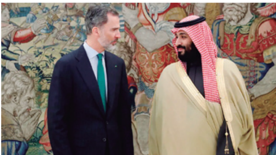
ARBASOENGANDIK IKASIZ. Goian, Alfonso XIII.a Azpeitian Urolako trenbidea inauguratzen 1922an; urte gutxian bere fortuna hirukoiztu egin zuen. Behean, haren birbiloba Felipe VI.a armagintzako “negozioak” egiten Saudi Arabiako Mohamed bin Salmán printzearekin.