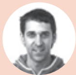
KIMETZ ARANA BUTROE BARATZEZAINA

S onatuia izan zen joan den astean Voxek Sestaon antolatatu zuen mitina. Ultraeskuineko alderdiaren ordezkariekin etorritako lau katu erdian, deialdi antifaxistari erantzunez jendetza ezin kabituz plaza inguruan. Bateko zalaparta, besteko korrikaldi eta poliziaren bultzakadak izan ziren albiste, Vox EAeko hauteskunde kanpainan ari den ildoan.