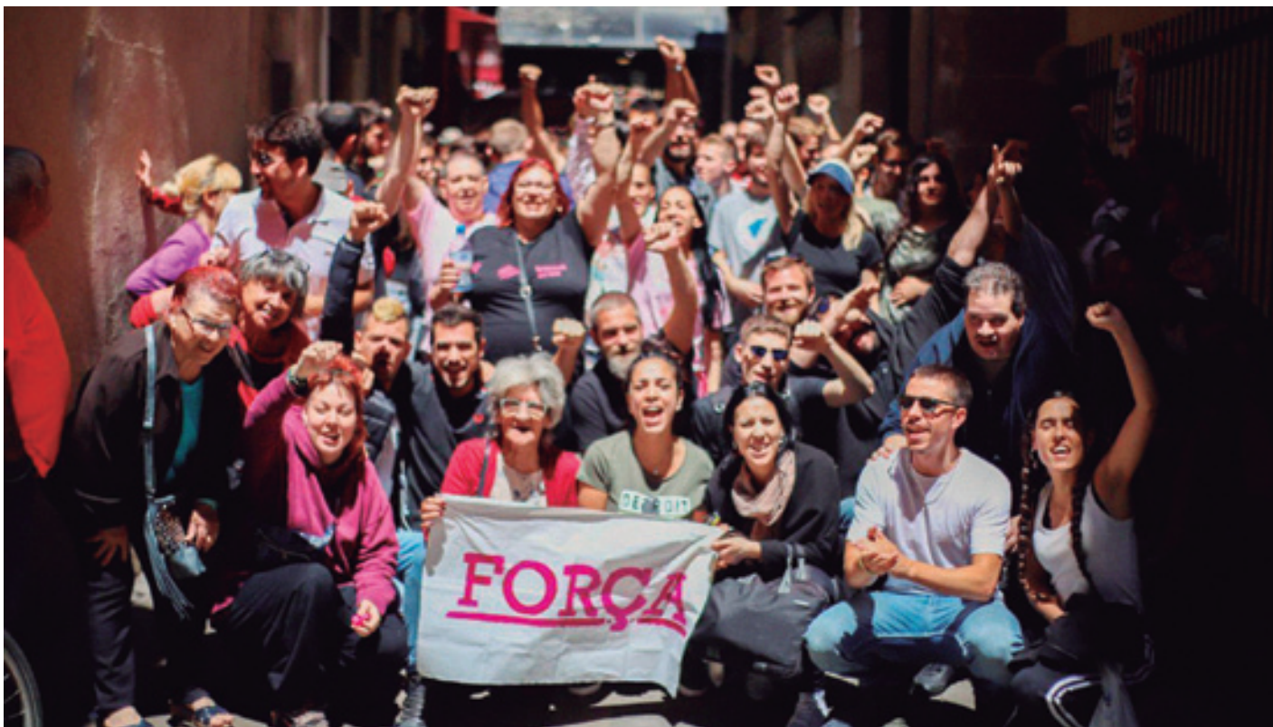
Bartzelonako Raval auzoko etxebizitza sindikatua. Katalunian etxebizitza sindikatuen sare indartsua daukate josia, eta beren ereduaren eragina nabari da Euskal Herrian sortzen ari diren sindikatu askorengan ere. Elkar babestea, antolakuntza eta autodefentsa kolektiboa dira horien funtzionamenduaren giltzarri.