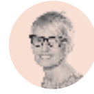
NAGORE IRAZUSTABARRENA URANGA

E gipto, K.a 2162 edo 2191. Nitokris faraoiaren bi urteko erregealdia amaitu zen eta, hala, VI. dinastia amaitu eta Egiptoko lehen tarteko aroa hasi zen. Nitokris ez zen emakumezko faraoi bakarria izan; bospa sei mende eta dinastia batzuk geroago Hatshepsutek 20 urtetik gorako agintaldi oparoa izan zuen. Baina Egiptoko lehenengo erregina litzateke, existitu zela egiaztatuko balitz.