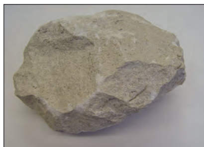
Ο ασβεστόλιθος είναι ιζηματογενές πέτρωμα.