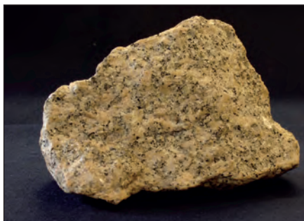
Ο γρανίτης είναι εκρηξιγενές πέτρωμα.