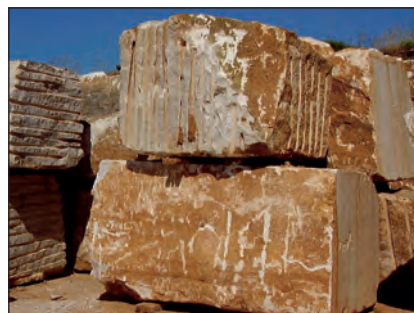
Το μάρμαρο είναι μεταμορφωμένο πέτρωμα.

► Αντιστοιχίσε το κάθε πέτρωμα με τη διαδικασία που περιγράφεται στη διπλανή σελίδα, δείχνοντας με βέλη την πορεία δημιουργίας των πετρωμάτων.