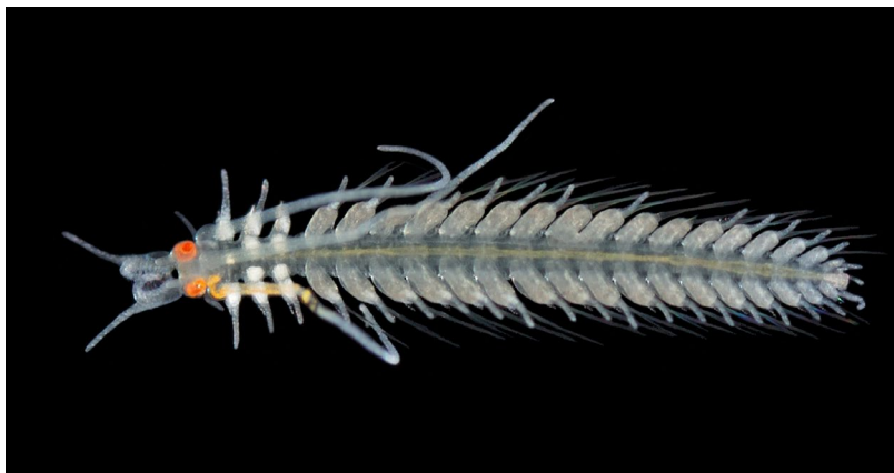
Fig. 4. En fullt utvecklad hane. På huvudet sitter två tvådelade antenner. Med hjälp av dessa kan en hane känna lukten av en hona på långt avstånd. I ett antal främre segment, som varierar beroende på art, bildas spermier. Dessa syns på denna individ som vita områden i tre av de främre segmenten. Från segmentet bakom och längs med hela kroppen finns långa simborst.

att de är väldigt lika utseendemässigt. Ursprungsbeskrivningen baserar sig på ett trasigt, konserverat exemplar. Det betyder att detaljer som skulle kunna skilja våra individer från den spanska drakulamasken kan ha gått förlorade. Genetiska analyser skulle kunna kasta ljus över om det rör sig om en eller två arter. Tyvärr har vi dock endast tillgång till material för DNA-analys från den svenska drakulamasken. Vad man däremot kan få svar på genom DNA från de exemplar vi samlat in är vilka som är de närmaste släktingarna till drakulamaskarna.