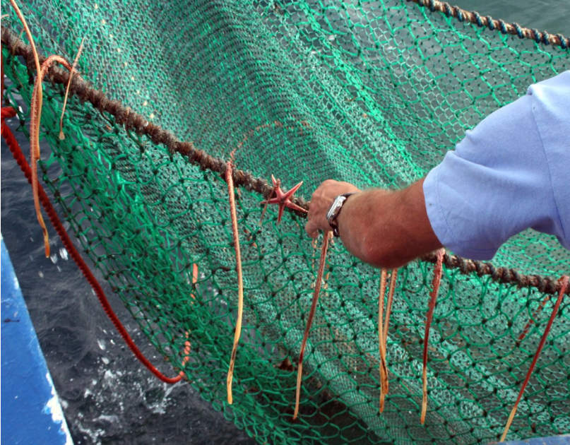
Fig. 1. A. Större piprensare Funiculina quadrangularis (ett slags koralldjur) hänger som skära repstumpar över den nedre linan i fångstkassen på vår bottenläde. B. Sällan sköljs ur på vägen hem efter att de sista djuren plockats ut och konserverats.