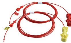
Shock*Star Surface Connector Detonadores no eléctricos