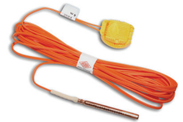
E*STAR Iniciación electrónica