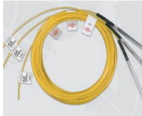
Shock*Star TS Detonadores no eléctricos (500 - 9600 ms)