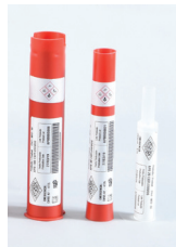
APB Mini Booster (20, 40 & 100 gramos)