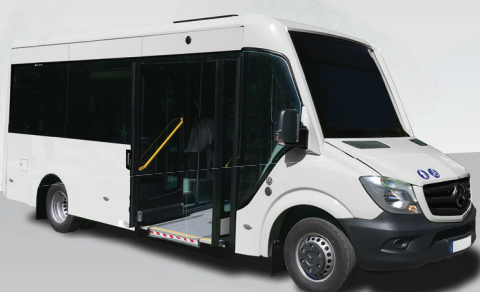
Cytios 3 23 Places