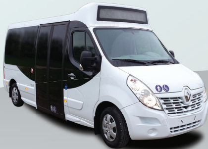
M City 21 Places