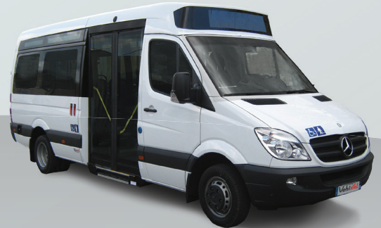
S City 23 Places