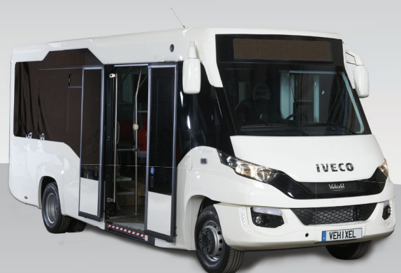
Cytios 4 42 Places