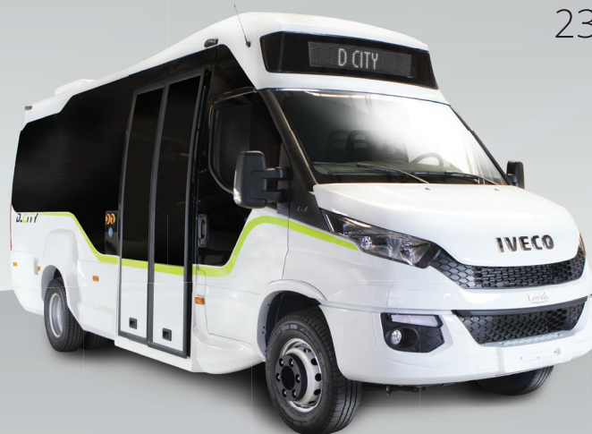
D City 35 Places