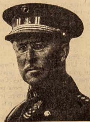
El rei dels belgues, Albert I, mort en un accident

I. El càrrec de Cronista de la "província" deu desempenyar-lo el mateix que ho siga de la ciutat.