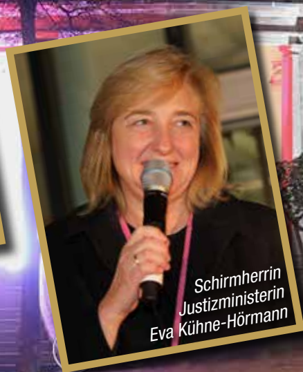
Schirmherrin Justizministerin Eva Kühne-Hörmann