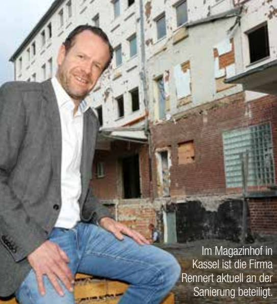
Im Magazin Hof in Kassel ist die Firma Rennert aktuell an der Sanierung beteiligt.