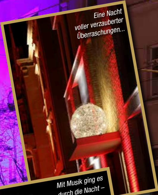
Eine Nacht voller verzauberter Überraschungen...