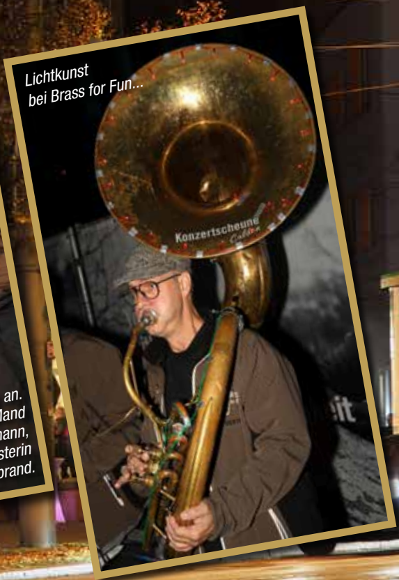
Lichtkunst bei Brass for Fun...