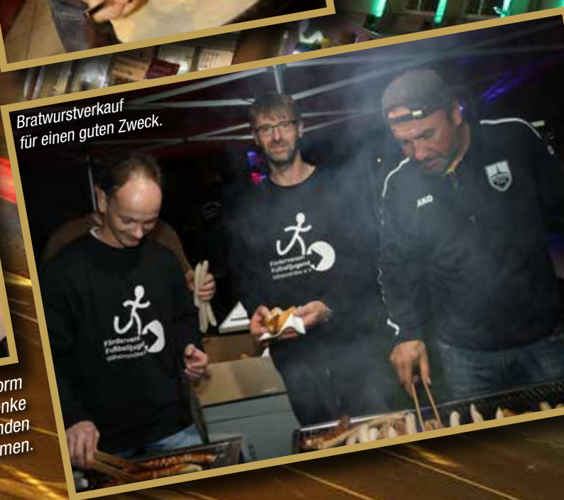
Bratwurstverkauf für einen guten Zweck.