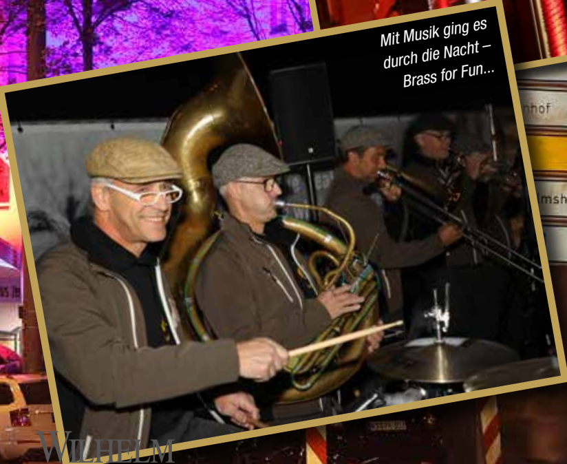
Mit Musik ging es durch die Nacht – Brass for Fun...