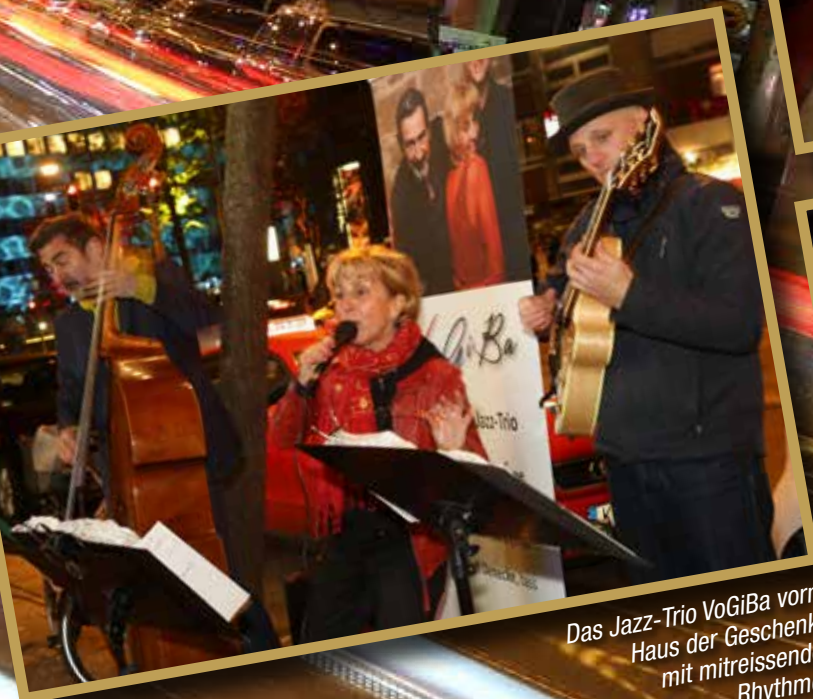
Das Jazz-Trio VoGiBa vorm Haus der Geschenke mit mitreissenden Rhythmen.