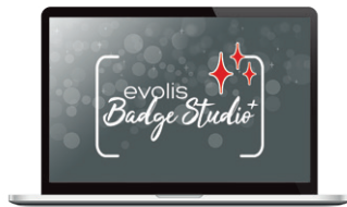
Evolis Badge Studio® Kartendesign-software