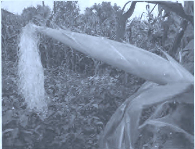
Fig. 11. Artobizarra.

Con fines diuréticos se tomaban infusiones de arto-bizarra , barbas de mazorca de maíz (A).