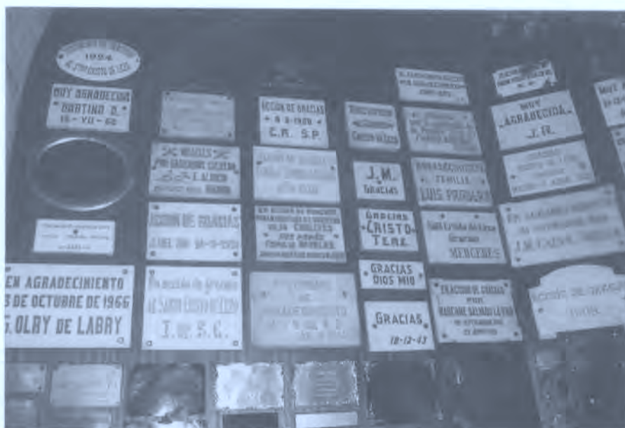
Fig. 2. Testimonios de agradecimiento al Santo Cristo de Lezo, 2004.

75. ¿Se recurre a votos y peregrinaciones para curar ciertas enfermedades? ¿En qué consisten tales votos? ¿Llevar hábitos? ¿Hacer ciertas prácticas? Lugares o Santuarios a los que se peregrina.