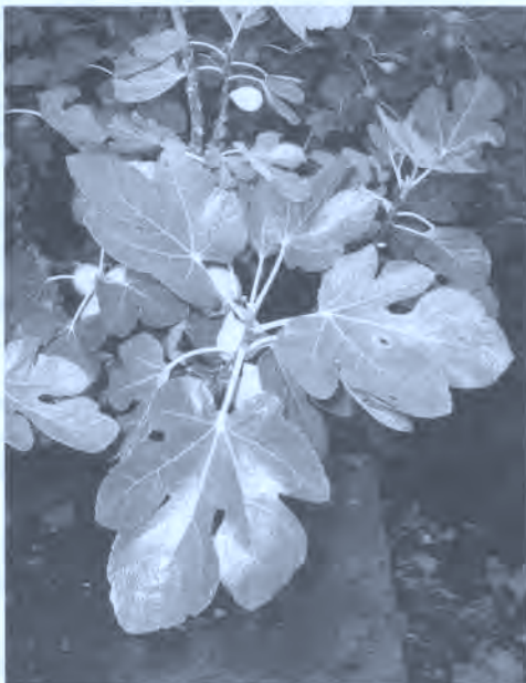
Fig. 8. Hojas de higuera.

Un señor estaba inquieto por una verruga que tenía en el cuello, cerca de las venas; acudió adonde nuestro informante para pedirle auxilio. Éste le recibía cada mañana (debía venir recién duchado) durante varios días, y le aplicaba una hierba que llama celidonia, que al romper da un líquido rojo. Al cabo de tres o cuatro meses desapareció del todo. No en vano es una hierba tan poderosa que su abuso puede resultar venenoso (B).