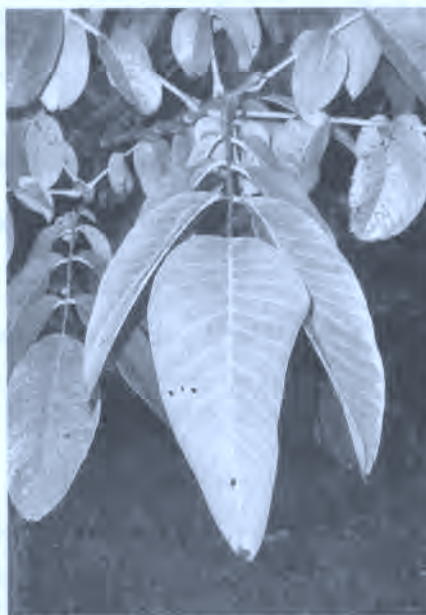
Fig. 7. Hojas de nogal.

Para bajar el ácido úrico y el colesterol es muy buena la infusión de hojas de nogal ( Juglans regia ) y la de