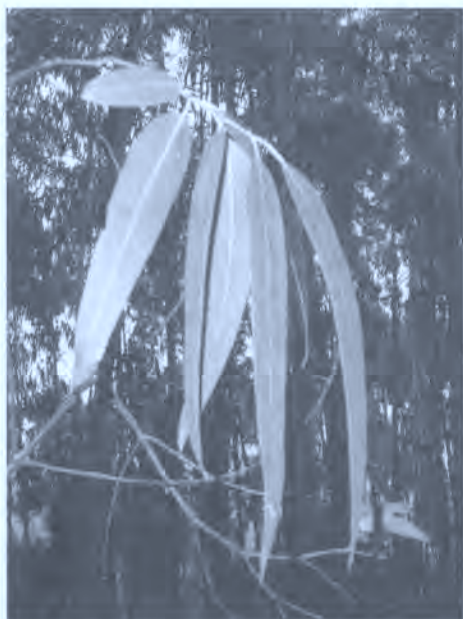
Fig. 3. Hojas de eucalipto.

85. ¿En qué enfermedades se recurre a activar la transpiración? ¿Con qué medios?