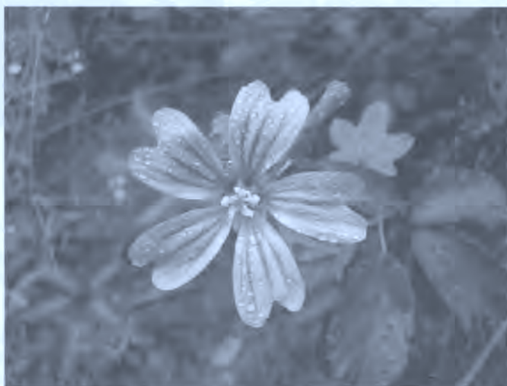
Fig. 6. Flor de malva.

La úlcera de estómago se cura tomando en ayunas infusión de la hierba pikara-belarra , celedonia en castellano ( Chelidonium majus ), o también de malva, malba en euskera ( Malva sylvestris ). De chavales solían comer malva silvestre cuando la encontraban en el campo (B).