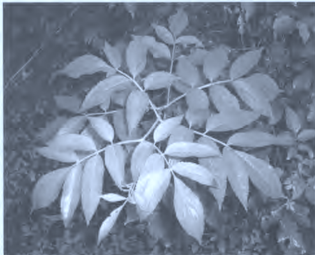
Fig. 9. Hojas de saúco.

Para mantener una piel bonita y embellecerla lo mejor es tomar infusiones de hojas de saúco ( Sambucus nigra ) (B).