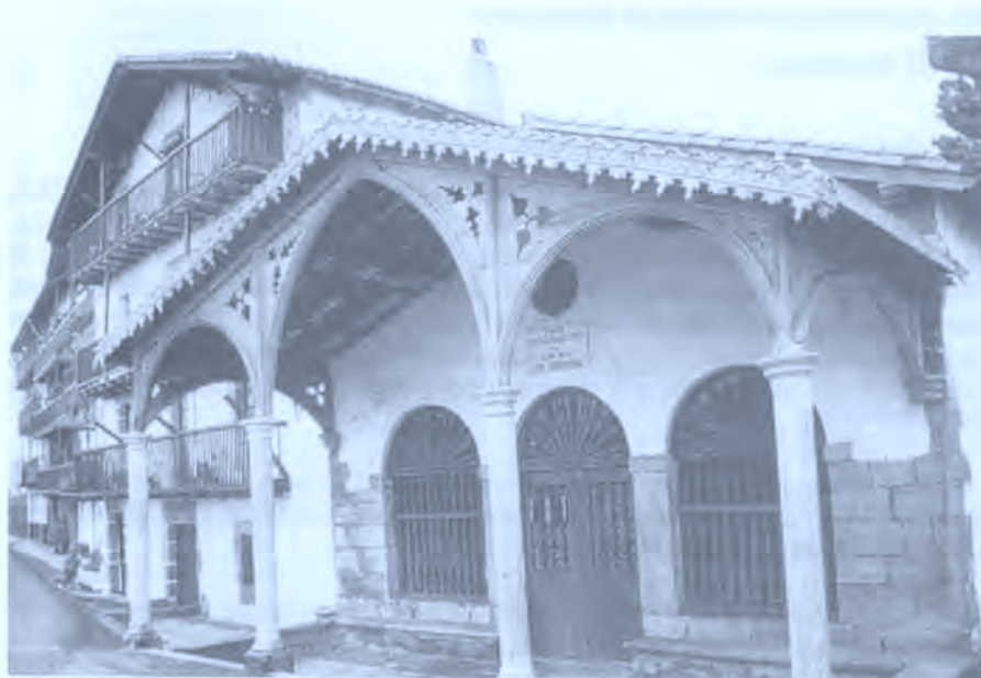
Fig. 4. Ermita de Nuestra Señora de Gracia. Hondarribia.

de hojas de árbol y tampoco lo solucionó. Un día, una señora se acercó a nosotros y nos dijo que el mejor procedimiento era tomar a tres viudas y darles una moneda de 5 céntimos de cobre (antes circulaban) para que cada una de ellas la depositase en un templo: una, en la Ermita de Saindua , otra en la iglesia de La Marina y otra en la Ermita de Santa Engracia. No hicieron la prueba de las viudas, pero acabó curándole un médico francés" (D).