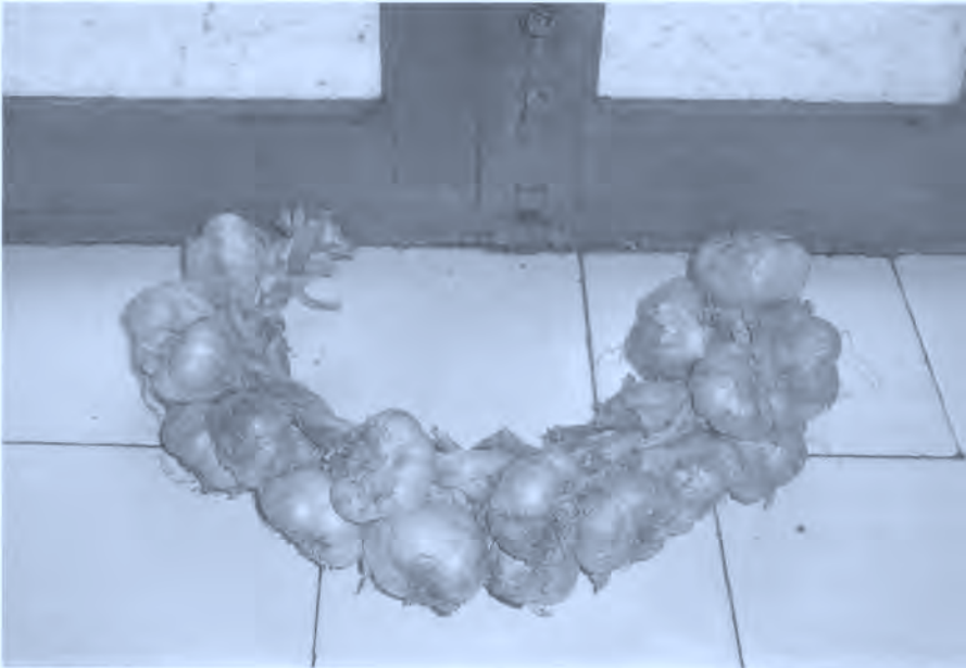
Fig. 1. Ristra de ajos.

74. ¿Qué se juzga del contagio? ¿Cómo se llama? ¿Qué enfermedades son contagiosas? Epidemias conocidas en lo que va de siglo. Remedios generales utilizados. Cuarentenas y aislamientos de enfermos. Asistencia en caso de enfermedades contagiosas.