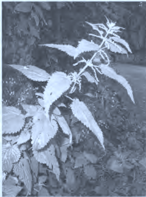
Fig. 5. Oziña.

También aligera y limpia la sangre la infusión de ortiga u ozíña ( Urtica dioica ), el berro o berrua ( Nasturtium officinale ) en ensalada y la muga-belarra (se llama así porque sale en las orillas de los caminos), en castellano diente de león ( Taraxacum officinale ) (B). En otra familia recogemos que tomar limones limpia la sangre (E).