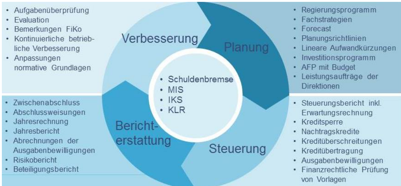
Abbildung 1: Steuerungsmodell

Das Programm zur Stärkung der finanziellen Steuerung sieht bedeutende Verbesserungen im Zusammenspiel der Führungsinstrumente vor. Sie werden nach dem folgenden Überblick in den nächsten Kapiteln vertieft behandelt.