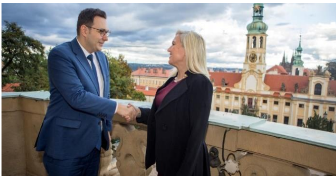
Tschechiens Außenminister Jan Lipavský (links) begrüßt Europaministerin Melanie Huml, MdL (rechts), im Außenministerium, dem Palais Czernin, in Prag

Gleichzeitig sollten wir bei all diesen Maßnahmen nicht aus dem Auge verlieren, dass diese den eigentlichen Kern des Problems nicht adressieren, nämlich ein zu niedriges Energieangebot. Hier sind auch die Mitgliedstaaten und Regionen gefragt. Ich werde mich deshalb auf EU-Ebene dafür einsetzen, dass das Regelwerk für neue Technologien wie etwa die Wasserstoffwirtschaft so ausgestaltet ist, dass diese ihr Potenzial auch entfalten können.