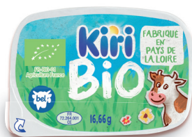
Kiri® Bio (2) 16,66 g Disponible en janvier 2020

Pour des utilisations de l'entrée à la fin de repas et en collation avec des portions protégées dans leur emballage et qui se conservent 24h à température ambiante (1)