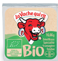
La Vache qui rit® Bio 16,66 g