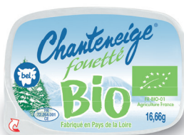
Chanteneige® Bio 16,66 g Disponible en septembre 2019