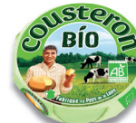
Cousteron® Bio 200 g

(1) Mini Babybel® Bio & La Vache qui rit® Bio se conservent 1 jour à température ambiante (2) Visuel non contractuel