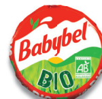
Babybel® Bio 200 g