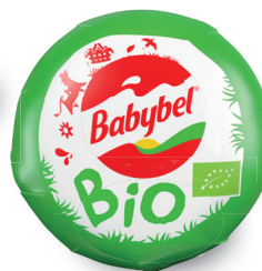
Mini Babybel® Bio 20 g