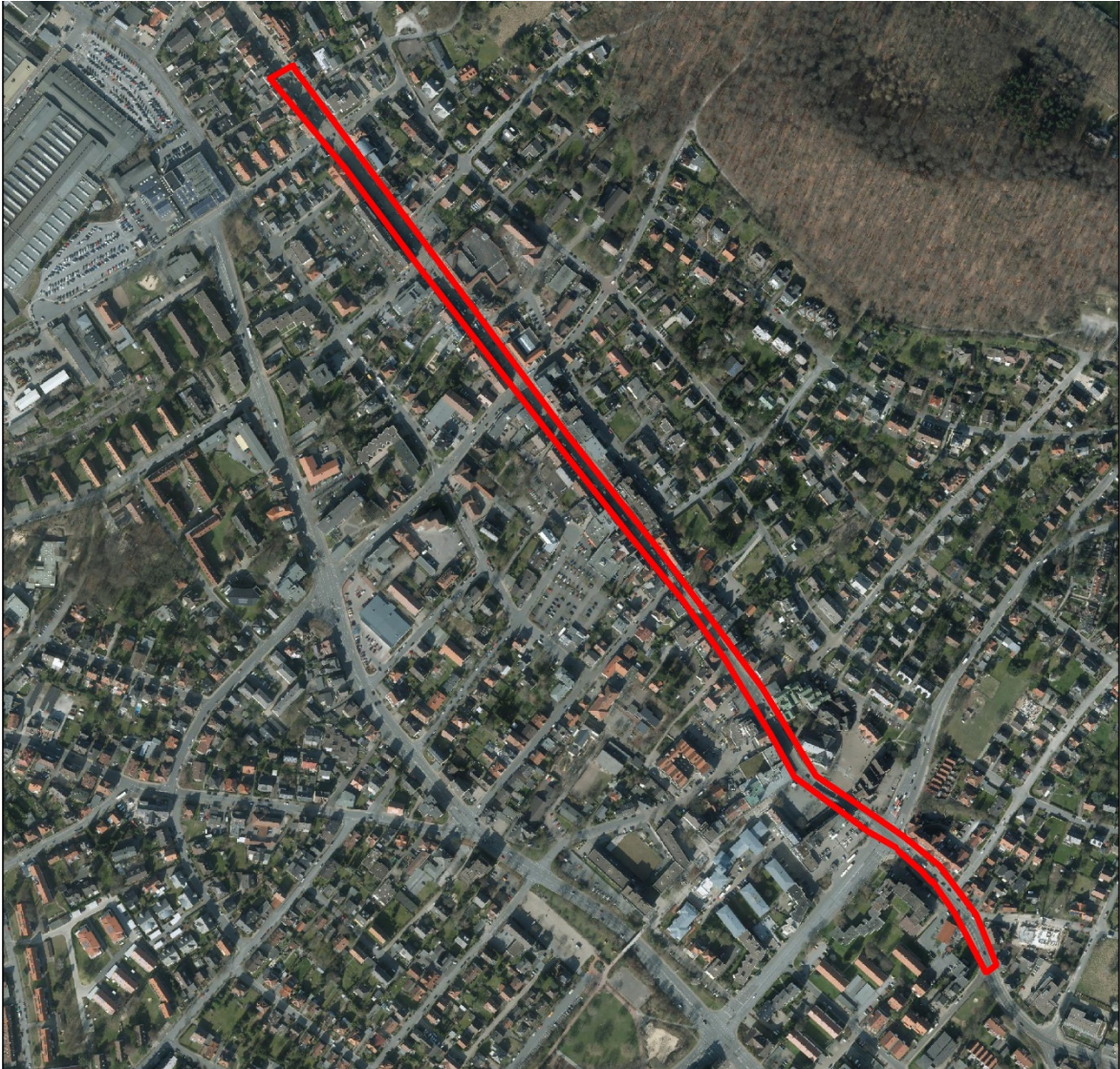
Abb. 1: Lage des Vorhabens (Luftbild mit Trassendarstellung)