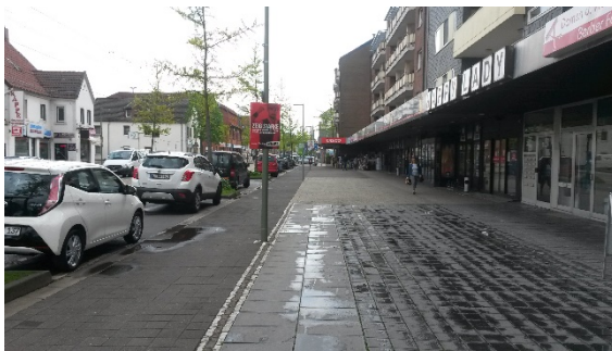
Abb. 4: Situation