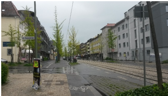
Abb. 2: Situation