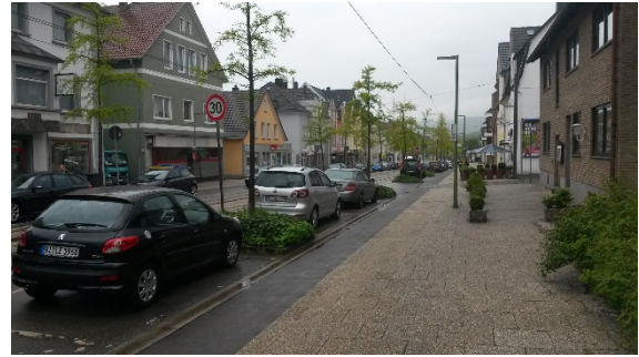
Abb. 3: Situation