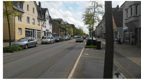
Abb. 5: Situation