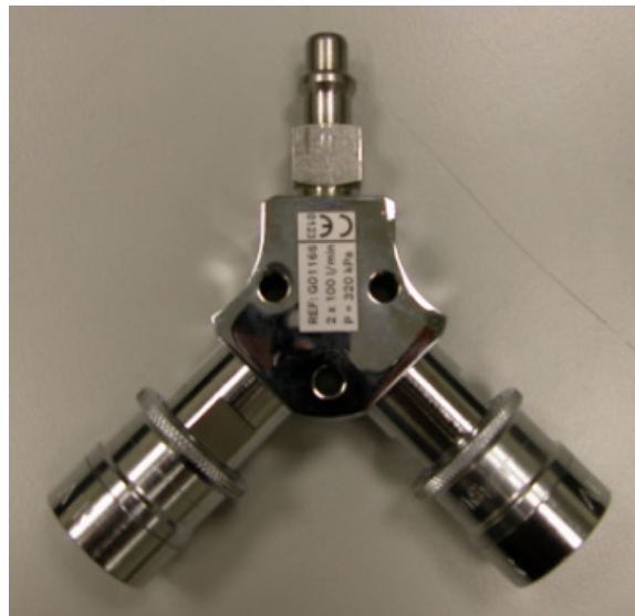
Doppelsteckkupplung AIR, auszutauschen

seit ca. 3 Jahren verkauft die DrägerMedical die oben genannten Doppelsteckkupplungen AIR in der abgebildeten Bauform.