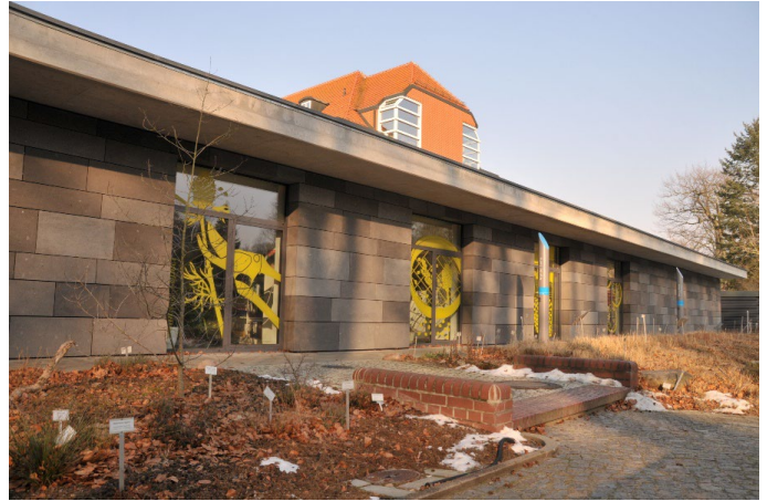
Gebäude und Tiefkühlung der alten Samenstube (oben) und der neuen Dahlemer Saatgutbank (unten). Buildings and freezers of the old seed store (above) and the new Dahlem Seed Bank (below).