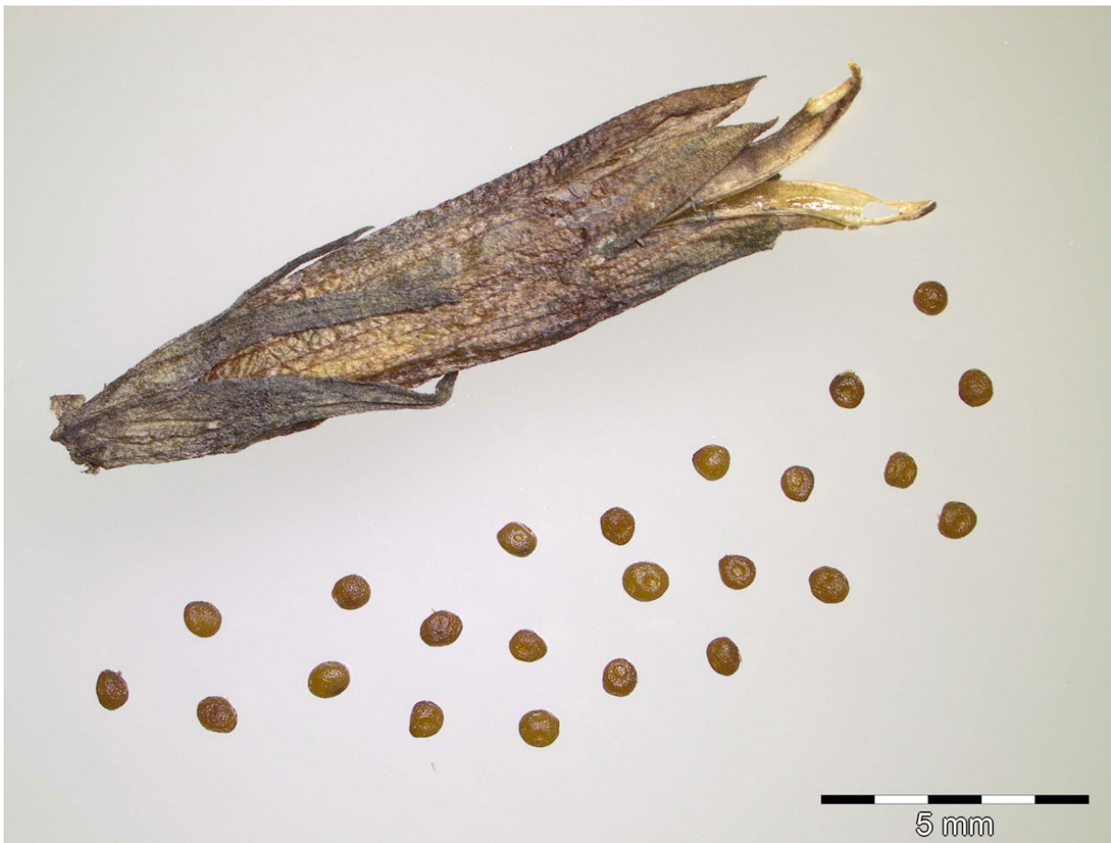
Kapsel und Samen von Gentianella uliginosa .

Dahlemer Saatgutbank, Botanischer Garten Berlin