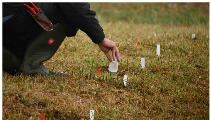
Gentianella uliginosa : Blüte, Kapsel, gekeimter Samen (links), Saatgutsammlung und Wiederansiedlung (rechts) in Mecklenburg-Vorpommern. Gentianella uliginosa : flower, capsule, germinated seed (left), seed collection and reintroduction (right) in Mecklenburg-Vorpommern.