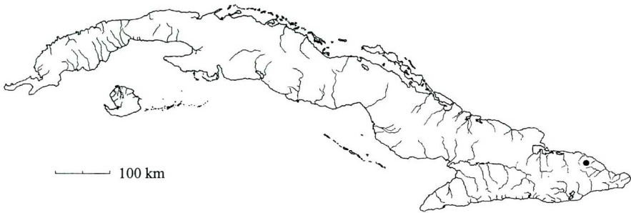
Mapa 1. Linum cubense Bisse

N o t a: Alain (1969), refiere para Cuba la especie Linum usitatissimum L. pero la misma no es natural ni naturalizada; ha sido ocasionalmente cultivada desde mitad del siglo XIX, pero sin éxito. En las montañas de Cuba Central se cultiva escasamente Linum grandiflorum Desf. (Roig 1953) como ornamental.