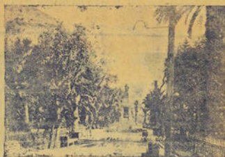
PARQUE VICUÑA MACKENNA