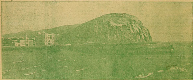
Puerto de Arica

Estos trabajos han sido ligeramente corregidos por el profesor. Copiarlos para la forma y el fondo que quieren digan sus amigos.