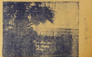
Puesta de Sol en Arica