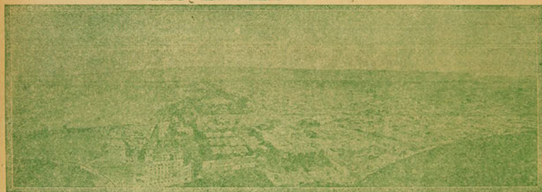
Panorama de la Ciudad