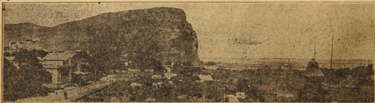
Antiguo Panorama del Puerto de Arica (1924)

Encontrándose en todo el apogeo de estos movimientos, los habitantes de la ciudad fueron sorprendidos el año 1604 por un