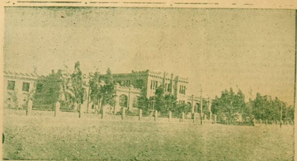
Fachada del Edificio del Cuartel del Regimiento de Infantería Rancagua N.º 4.

Fue por aquella misma época, un poco más tarde tal vez, que recibió la honrosa misión de lle-