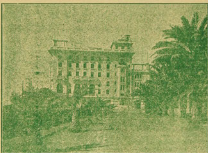
Hotel Pacifico y Parques

Este periódico demuestra lo que puede el cultivo de la mente. Obrero; a Ud nos dirigimos instándole a que se prepare y prepare a sus hijos en forma de que nuestra clase trabajadora se dignifique.