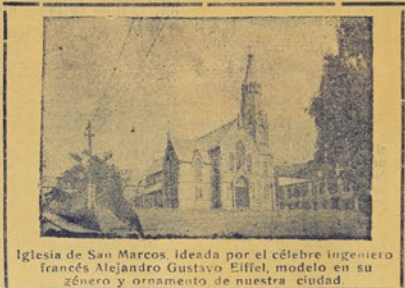
Iglesia de San Marcos, ideada por el célebre ingeniero francés Alejandro Gustavo Eiffel, modelo en su género y ornamento de nuestra ciudad.

La vida que tu me diste por ti quisiera yo darla, que eres vida de mi vida y eres alma de mi alma.