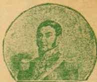
General José San Martín

se observa en las empresas grandes o chicas, sino hasta en los compromisos diarios. Se citan dos o más personas para tratar un asunto cualquiera... y no es nada el tiempo que pierde si ha tenido la ocurrencia de ser puntual. Se conversa con todo interés en un grupo o en una sesión sobre una idea, y nada extrañará que haya quien responda al pedirle parecer: «Completamente de acuerdo. ¿De qué se trata?»