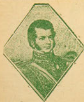
General Bernardo O'Higgins