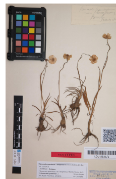
Imagen de portada.

Los artículos del Boletín BIGA son indexados por las siguientes bases de datos. Boletín BIGA is covered by: Latindex -Sistema Regional de Información en Línea para Revistas Científicas de América Latina, el Caribe, España y Portugal ( http://www.latindex.unam.mx/ ). Asimismo, el Boletín BIGA aparece en las bases de datos de la Biblioteca Digital del Real Jardín Botánico (CSIC: http://bibdigital.rjb.csic.es/spa/index.php ) y en International Plant Names Index (IPNI: http://www.ipni.org/index.html ).