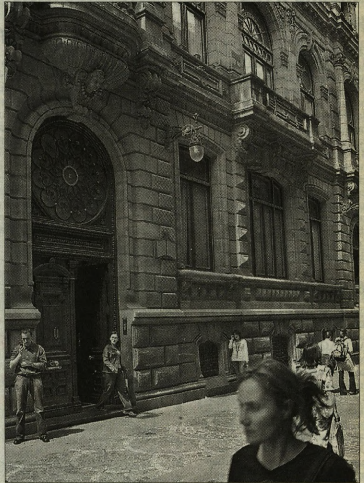
Biblioteca de Bidebarrieta.

Por último, no hay que olvidar la presencia de la RBMB en numerosas actividades culturales relacionadas con el ocio y la lectura, organizándolas directamente o apoyando iniciativas de otros agentes culturales. Visitas escolares, para conocer la biblioteca de la RBMB más próxima, talleres, dirigidos al público infantil tanto en euskera como en castellano, actividades de verano, Certamen de Cómics, cursos, charlas, exposiciones... todo tiene cabida en unas bibliotecas que se modernizan día a día, aunque siguen conservando el milenario hábito de la lectura.