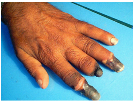
Figura 2. Gangrena digital distal.

distalmente en las arterias y venas de pequeño calibre de manos, pies, piernas y brazos, posteriormente progresarán afectando territorios más proximales, siendo el síntoma isquémico más frecuente la claudicación intermitente, la cual, en algunos casos puede llegar a confundir el diagnóstico con algún trastorno ortopédico, posteriormente aparecerán síntomas más severos como el dolor de reposo hasta la aparición de las úlceras isquémicas que, hasta en aproximadamente un 70% de los casos puede ser la manifestación inicial, y terminando finalmente en gangrena usualmente a nivel digital (Figura 2). La afectación de otros territorios vasculares, aunque infrecuente, puede significar una morbimortalidad importante para el paciente, por ejemplo, en el caso de aquellos que tengan afectación intestinal van a presentarse comúnmente con dolor abdominal isquémico,