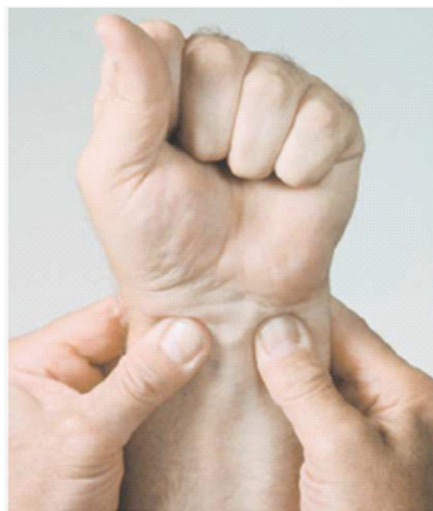
Figura 3. Obstrucción del flujo a nivel distal con formación extensa de arterias colaterales (A). Test de Allen (B).

Eritematoso Sistémico, Vasculitis Reumatoidea, Enfermedades mixtas del tejido conectivo y