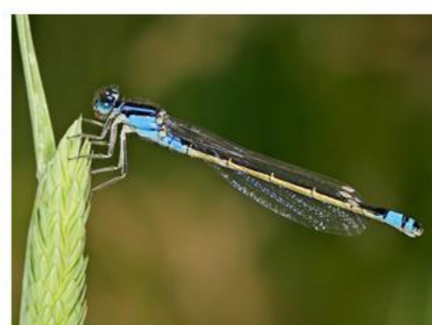
11 especies de odonatos Listas rojas (IUCN): preocupación mínima