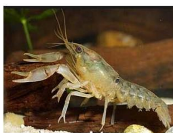
Cambarellus montezumae Listas rojas (IUCN): preocupación mínima