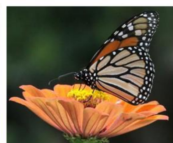
Danaus plexipus plexipus NOM-059-SEMARNAT-2010 Sujeta a protección especial