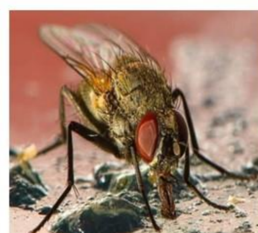
Brennania belkini NOM-059-SEMARNAT-2010 Peligro de extinción Listas rojas (IUCN): Vulnerable