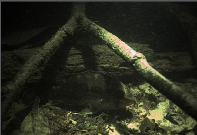
Krobia aff. guianensis sp.2