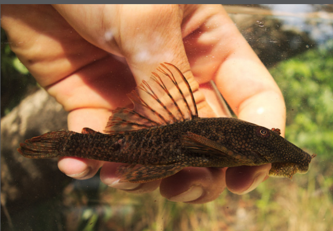
Ancistrus aff. temminckii