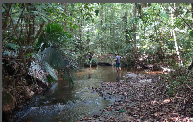
Affluent 3 Amont