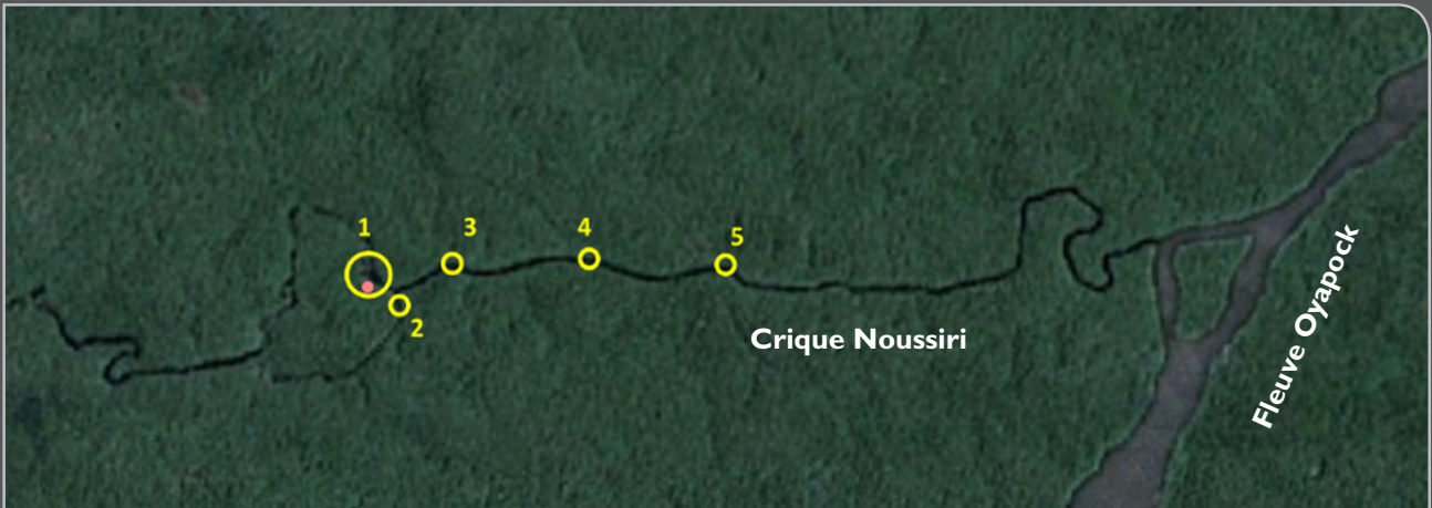
Figure 2 : Crique Noussiri et points de collecte (Saut Guillaume 1 ; affluents 2, 3, 4 et 5).