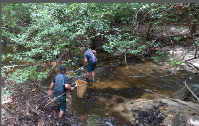
Affluent 3 Aval