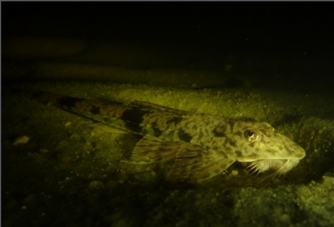
Loricaria aff. pamahybae