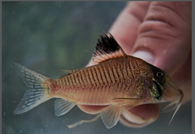
Corydoras aff. amapaensis