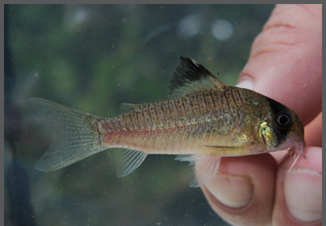
Corydoras aff. oiapoquensis