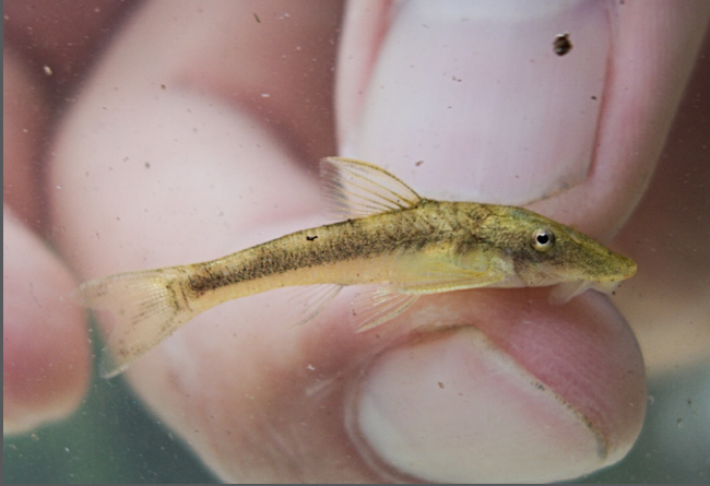
Gen. nov. aff. Parotocinclus sp.