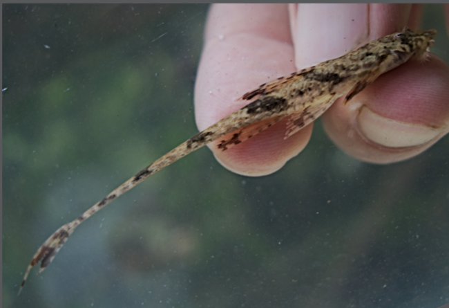
Rineloricaria aff. stewarti