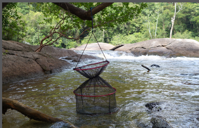
Bourriche Grégory Quartarollo

Les spécimens capturés ont été (plusieurs options possibles) :