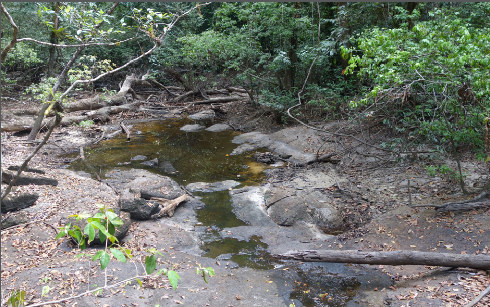
Bistouri Grégory Quartarollo