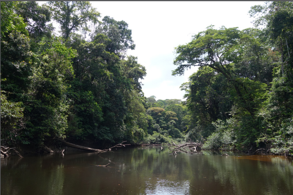
Noussiri Grégory Quartarollo