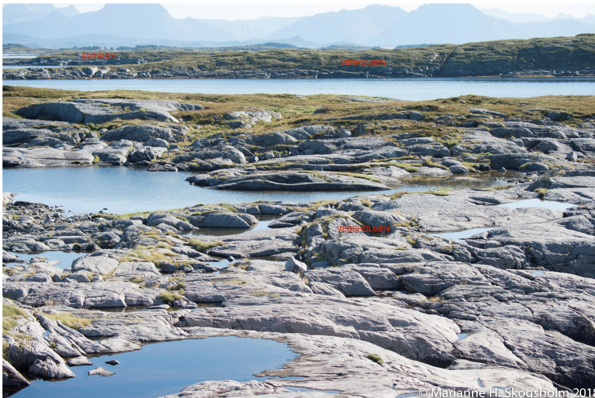
Figur 2: Bilde fra området. Verholmen i bakgrunn.

Meløy kommune skal revidere gjeldende kommuneplan, inkludert arealdelen, i kommende kommunestyreperiode. En fullverdig kartlegging og konsekvensutredning for LNFR-1 området som Verholmen er en del av vil etter vårt syn vært naturlig å legge inn i denne prosessen hvis kommunen ønsker å tilrettelegge for akvakultur utenfor områder som pr. i dag er planavklart.