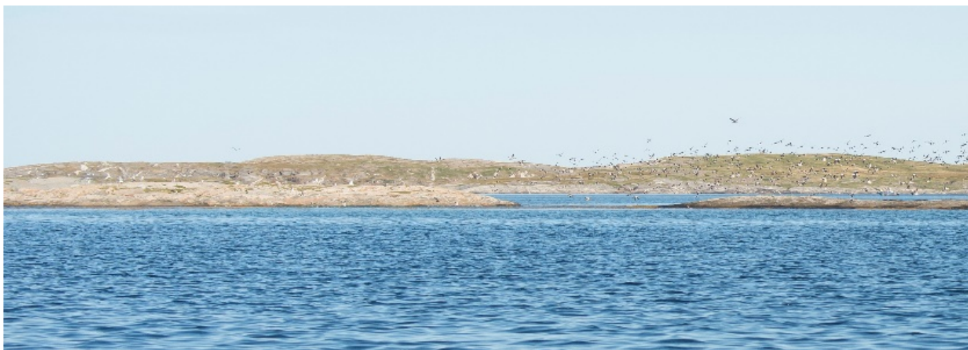
Figur 3: Hundrevis av silender like ved Beitålen (holmen innenfor Verholmen).

Merk registreringen av 500 silender september 2018. Silanden er en norsk ansvarsart. Det vil si at arten har en betydelig andel av sin naturlige utbredelse i Norge (25% eller mer av europeisk bestand).