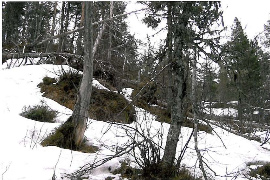
Figur 2. Eldre furuskog med noko innslag av lauvtree på Raudmoldåsen (lok. 1 og 2). Som følgje av vindfall finst ein del læger (liggande, daude trestammar) med fleire rotevedmosar, m.a. raudlistearten roteflak.

Verdisetting: Området får verdi viktig (B), sidan det er vekseplass for ein raudlisteart.