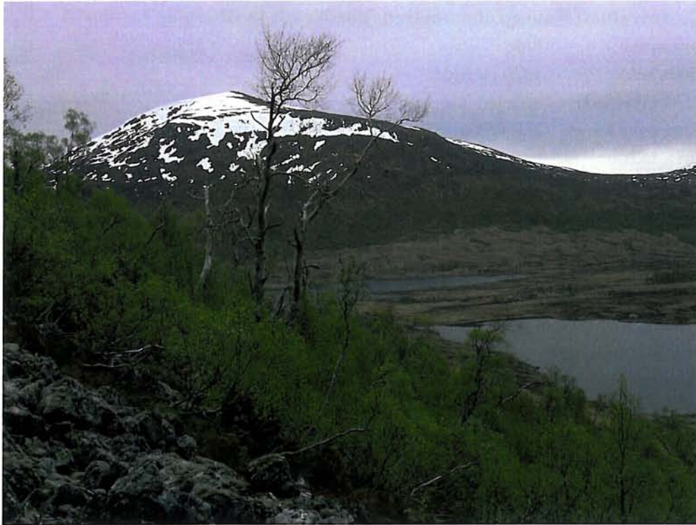
Figur 5. Hekkeplass for kvitryggspett i den SV-vendte lauvskoglia i Litlvasdalen (lok. 10).