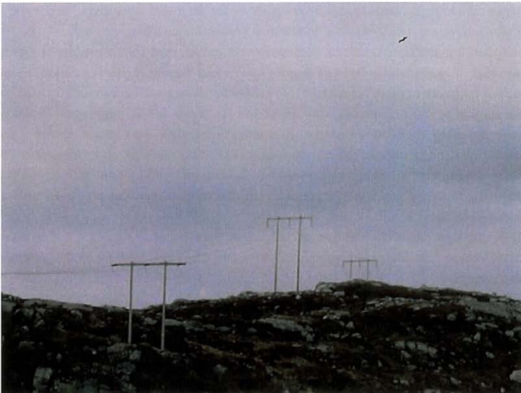
Figur 4. Kongeørn i flukt over kraflina ved Vasskordheia (lok. 10).