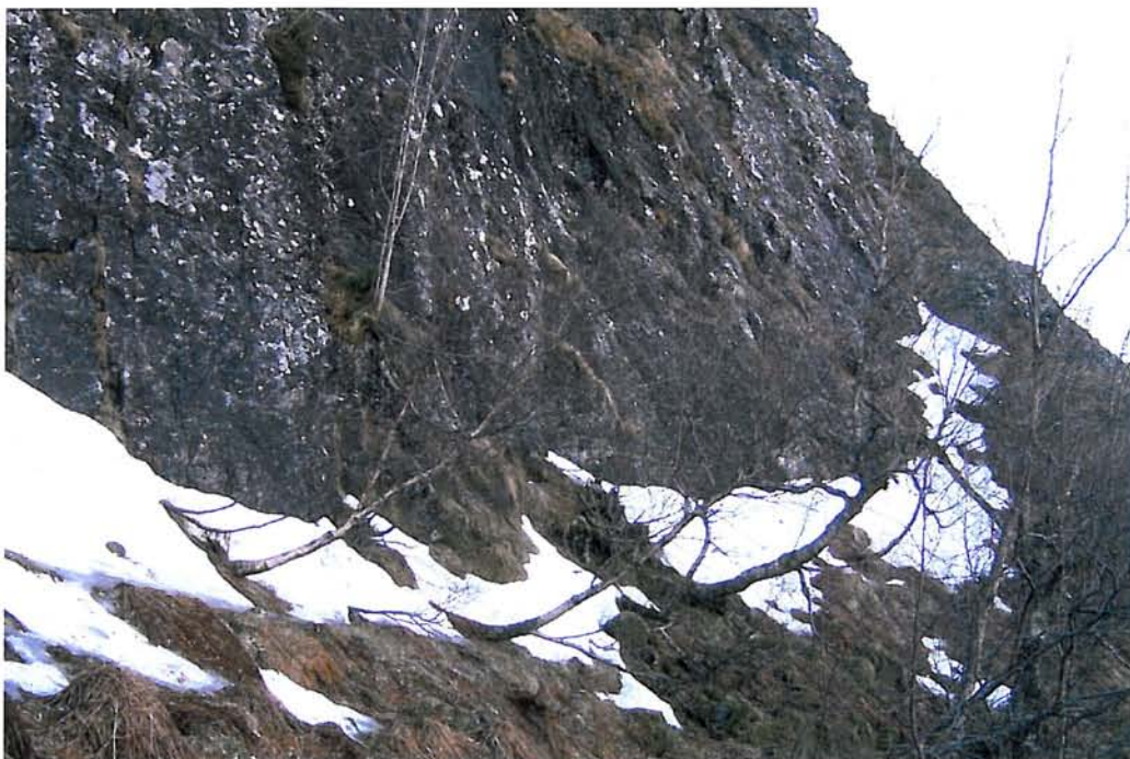
Figur 6. Veksepass for den svært sjeldsynte og utryddingstruga tornevladmosen Scapania nimbosa under Ramsgrøhammaren (lok. 12). Arten veks sparsamt ved berggrota sentralt i biletet.

tiv. Avgrensninga må reknast som noko grov, da berre partia nær eksisterande kraftline er undersøkt. Særleg oppover i fjellsida mot vest er det uklårt kor langt området går.