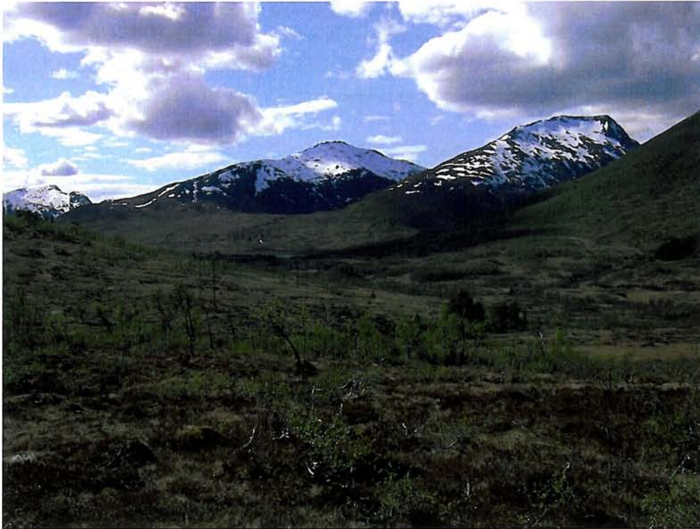
Figur 3. Mot fjella omkring Litlvassdalen (lok. 10 t.v.) frå linetraséen øvst i Åndalen.