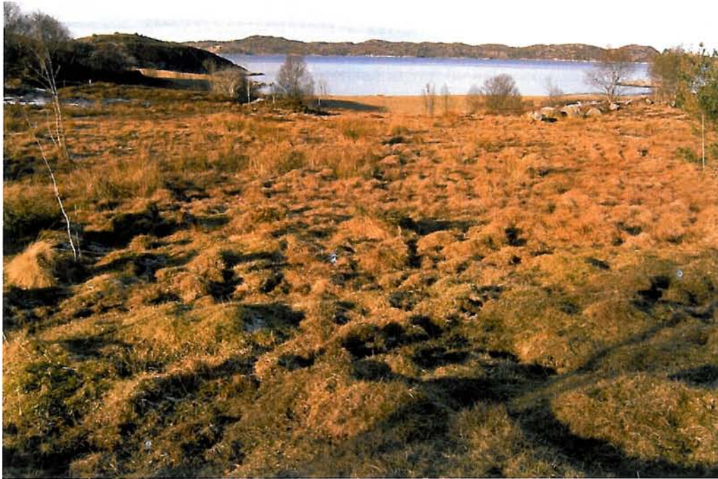
Figur 8. Utsnitt av beitemarka og delar av stranda på nordvestsida av Hamneset (lok. 38). Morenetangen Levra kan såvidt skimtast i høgre kant.

arter som står på den nasjonale raudlista forekjem i kantsoner av beitemarka som er lite gjødselpåverka. Ut frå kjent kunnskap er verdien minst viktig (B), og det er mogeleg at funnet av mørkveronika kan tilseie høgare verdi. Ut frå "føre-var"-prinsippet får difor lokaliteten verdi svært viktig (A).