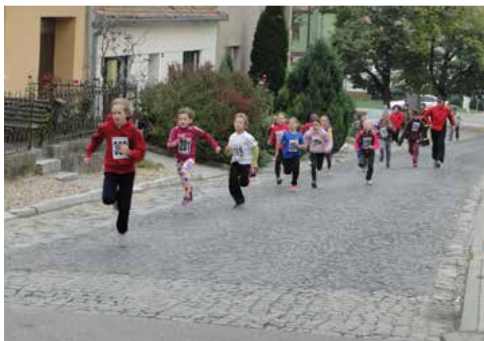
Běh za bořetickým burčákem