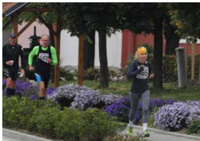
Běh za bořetickým burčákem