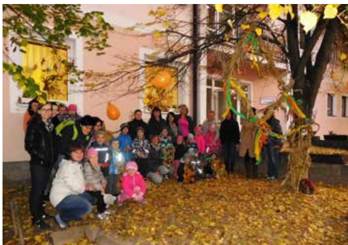
Tradiční podzimní tvoření dětí a rodičů v MŠ