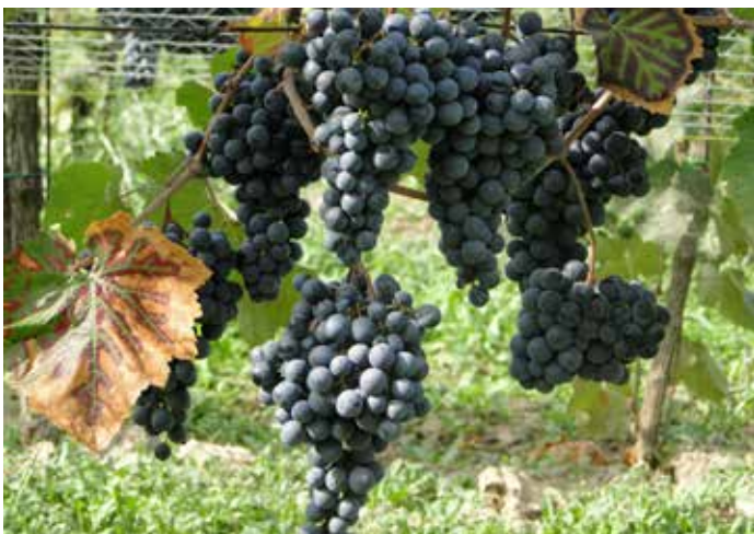
Z letošního vinobraní