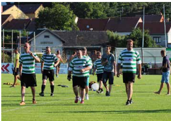
Oslava 60 let fotbalu