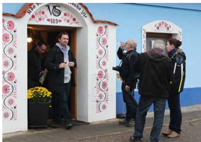
Putování za mladým vínem, foto V. Mikulíková