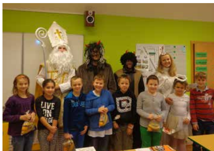
Mikuláš u třetáků