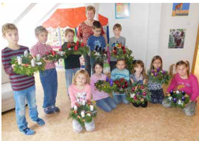
Vánoční tvoření ve 2. třídě - výroba adventních věnců