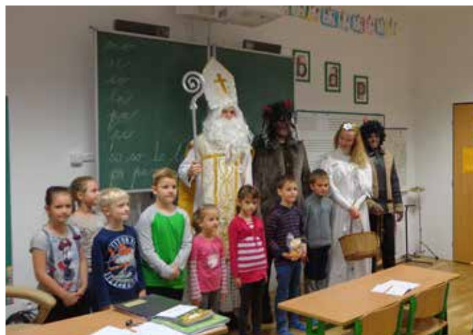
Návštěva Mikuláše v 1. třídě