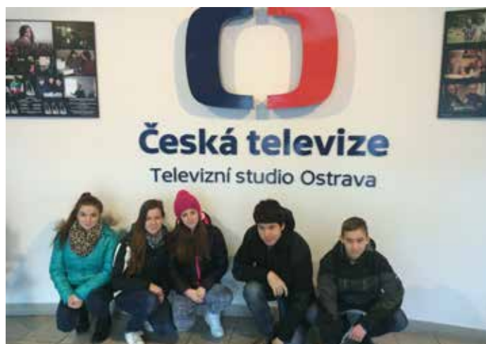
Devátáci v soutěži