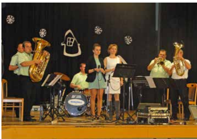
Setkání se seniory