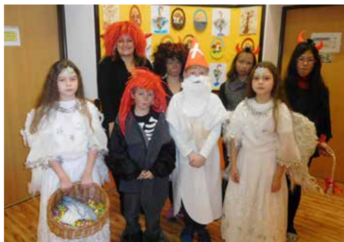
Čertíci, andělci a Mikuláš z 5. třídy