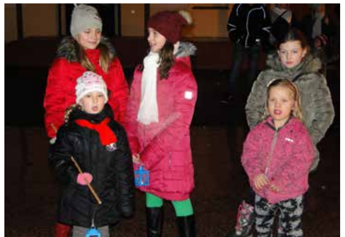
Zpívání koled na sóle