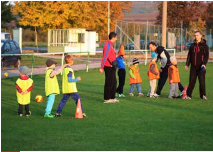
Trénink malých dětí