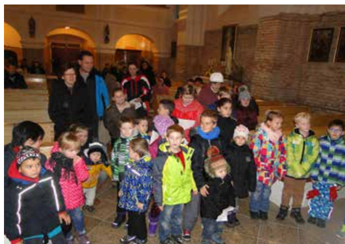
Sv. Mikuláš v kostele