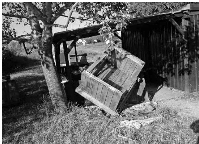
Převrácený stůl a rozbité ohrazení

A ve chvíli, kdy mi docházejí kandidáti na životní vzory, se mi vybavuje jedna ze vzpomínek na dobu, kdy jsme si jako začínající bigbítáči mohli v hospodě, když bylo místo, přisednout ke stolu, kam směli jen tehdejší břeclavské muzikantské elity. A tak jsme se u jednoho stolu – kde si všichni tykali, po letech potkávali i se svým učitelem