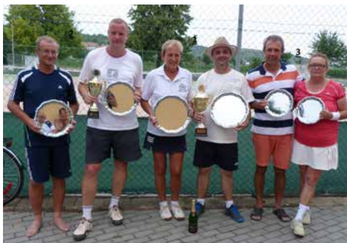
Družební turnaj Bořetice - vítězové