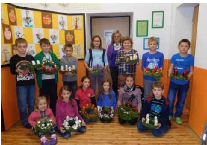
Čtvrtáci s vlastnoručně vyrobenými adventními věnci