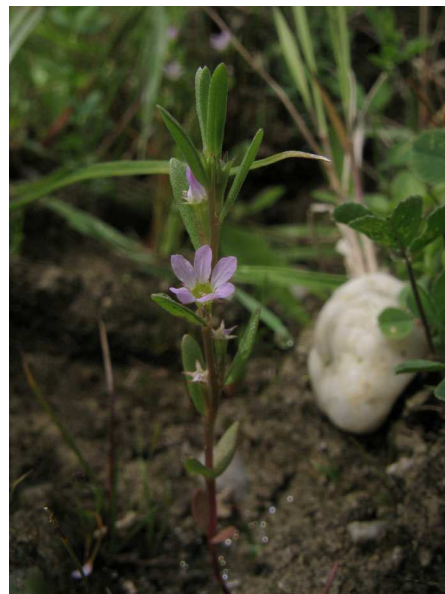
Abb. 4: Ysopblättriger Weiderich ( Lythrum hyssopifolia ).