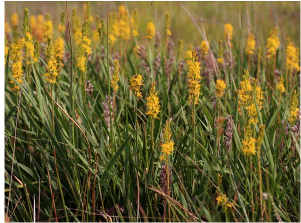
Abb. 2: Beinbrech ( Narthecium ossifragum ) (C. BUCH).