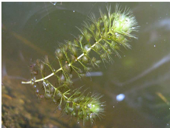
Abb. 3: Wasserfalle ( Aldrovanda vesiculosa ) (A. JAGEL).