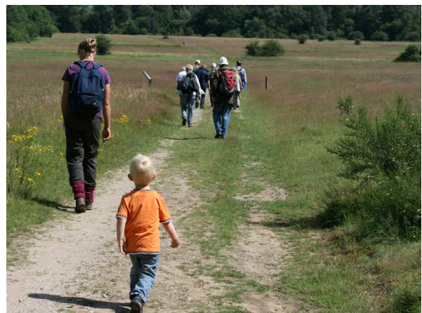
Abb. 6: Auf Entdeckungstour in der Wahner Heide (C. BUCH).