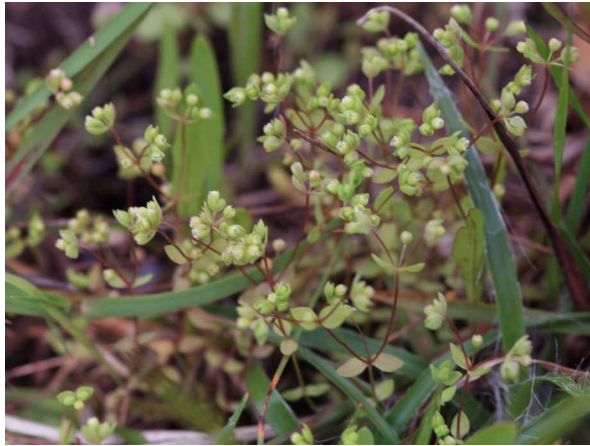
Abb. 1: Zwerglein ( Radiola linoides ) (C. BUCH).