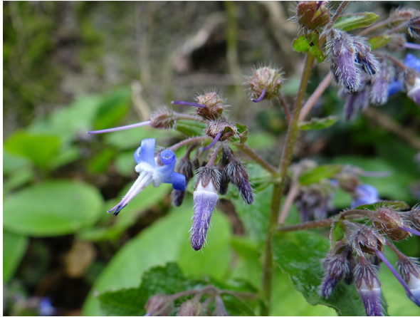
Abb. 85: Trachystemon orientalis in Essen-Kupferdreh (T. KALVERAM).