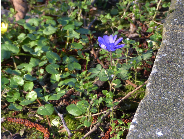
Abb. 5: Anemone blanda in Erkrath-Hochdahl (K. ADOLPHY).