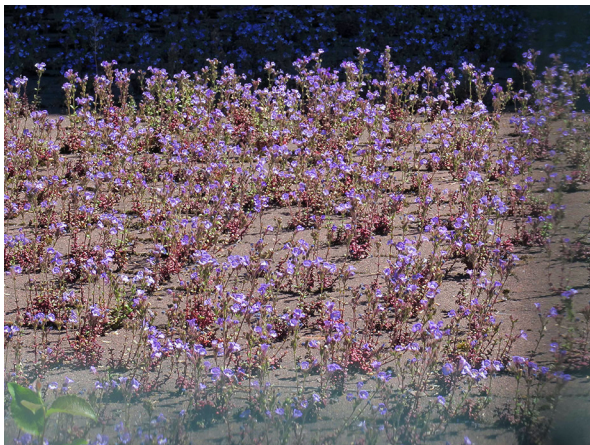
Abb. 17: Chaenorhinum organifolium in Hagen-Eckesey (M. LUBIENSKI).

Bochum-Querenburg (4509/41): eine Pflanze auf dem Gelände der Ruhr-Universität zwischen Forumsplatz und Q-West, 29.05.2019, T. SCHMITT.