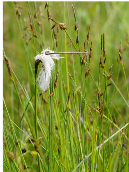
Abb. 16: Carex pulicaris mit Eriophorum angustifolium in Schmallenberg (D. WOLBECK).