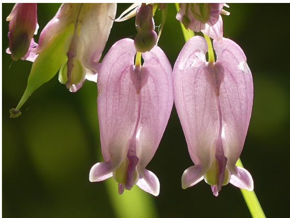
Abb. 27: Dicentra formosa in Arnsberg-Vosswinkel (W. HESSEL).

Kreis Recklinghausen, Haltern-Flaesheim (4209/32): zwei Pflanzen nahe der Lipper-Brücke am Flaesheimer Damm, 31.08.2019, W. HESSEL. – Kreis Unna, Holzwickede (4411/44): drei Pflanzen in einem Grünstreifen entlang der Schallschutzwand an der Abfahrt Holzwickede/Danziger Str., zusammen mit ca. 20 Pflanzen der var. stramonium , 05.10.2019, W. HESSEL. – Kreis Unna, Unna-Zentrum (4412/33): neun Pflanzen neben dem Bordstein auf der Hertinger Str. zwischen Türkenstr. und der Überführung der A44, 15.09.2019, W. HESSEL. – Die Funde dieser Sippe werden gesammelt, um über deren Häufigkeit und Verbreitung in Nordrhein-Westfalen einen Überblick zu bekommen.