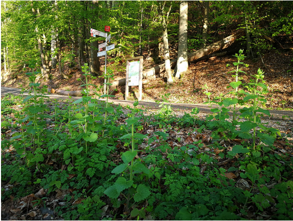
Abb. 75: Scrophularia vernalis in Attendorf (D. WOLBECK).