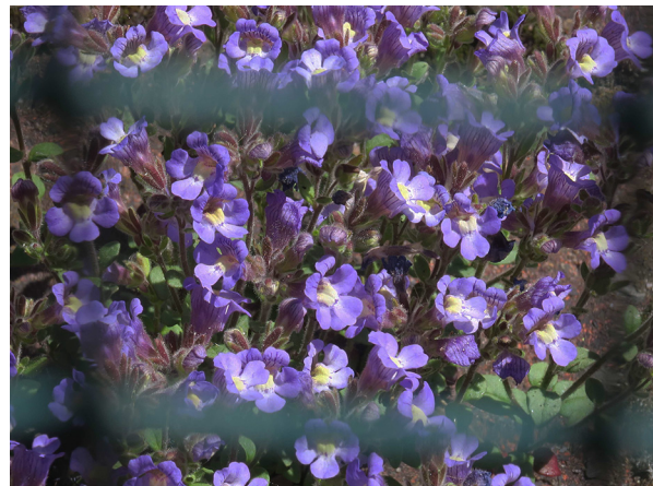
Abb. 18: Chaenorhinum organifolium in Hagen-Eckesey (M. LUBIENSKI).