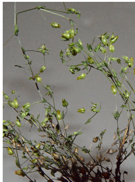
Abb. 8: Arenaria leptoclados in Olpe-Neuenkleusheim (M. KLEIN).