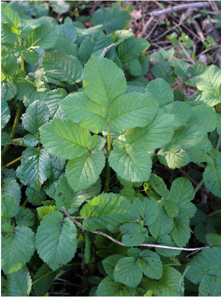
Abb. 19: Chaerophyllum byzantinum in Oberhausen-Styrum (C. BUCH).