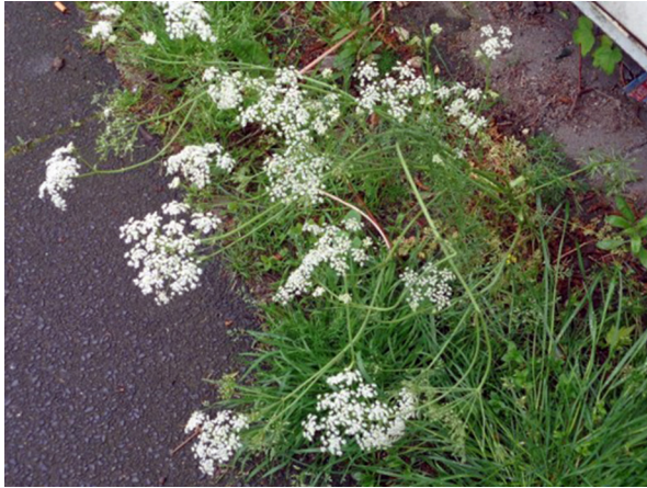
Abb. 13: Bunium bulbocastanum in Solingen-Wald (F. JANSSEN).