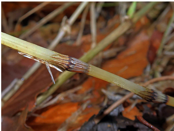
Abb. 33: Equisetum pratense in Horn-Bad Meinberg (M. LUBIENSKI).

Märkischer Kreis, Schalksmühle-Albringwerde (4711/21): ein kleiner Bestand an einer feuchten Böschung an der Straße von Albringwerde ins Nahmer Tal, 23.06.2019, M. LUBIENSKI.