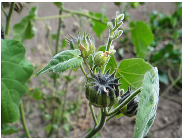
Abb. 1: Abutilon theophrasti in Köln-Worringen (T. KALVERAM).

Aachen (5202/41): 15 Pflanzen verwildert auf älteren Schotterwegen auf dem Waldfriedhof. Nicht nur, aber besonders auf Friedhöfen, ist mit zunehmenden Verwilderungen zu rechnen, 04.08.2019, F. W. BOMBLE.