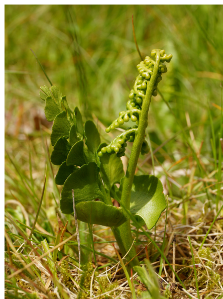
Abb. 12: Botrychium lunaria in Kirchhundem-Brachthausen (D. WOLBECK).