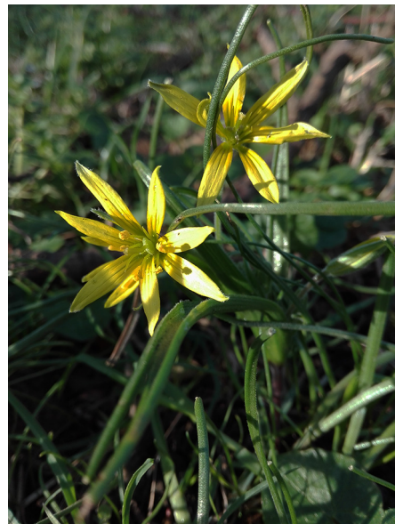
Abb. 38: Gagea villosa in Soest (A. SCHMITZ-MIENER).