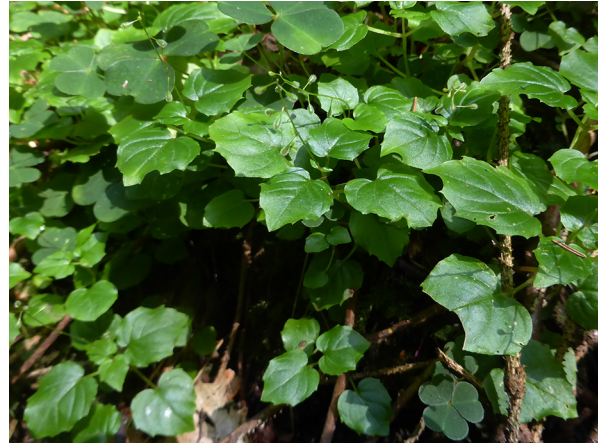
Abb. 20: Circaea alpina in Wipperfürth (J. KNOBLAUCH).