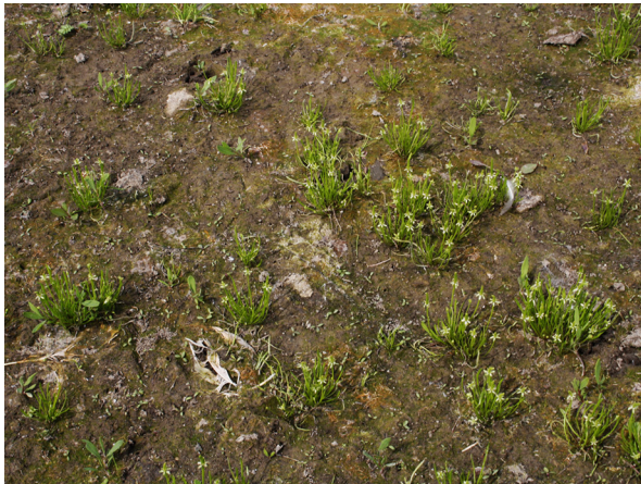
Abb. 57: Myosurus minimus in Xanten (M. ERZNER).

Kreis Unna, Fröndenberg-Frömern (4512/12): eine kleine Gruppe am Waldrand vom Buschholt am Straßenrand „Auf dem Splitt“, 16.04.2019, W. HESSEL.