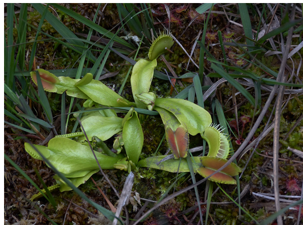
Abb. 28: Dionaea muscipula in der Hildener Heide (K. ADOLPHY).