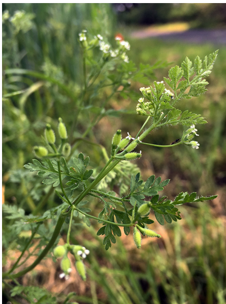
Abb. 7: Anthriscus caucalis in Essen-Kettwig (C. KATZENMEIER).