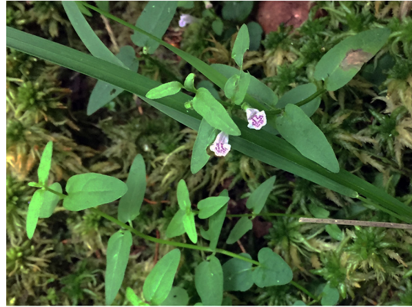
Abb. 76: Scutellaria minor in Köln-Dünnwald.