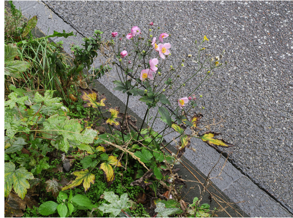
Abb. 6: Anemone hupehensis in Hagen-Wehringhausen.