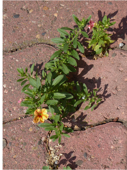
Abb. 14: Calibrachoa x hybrida in Bochum-Querenburg (H. HAEUPLER).