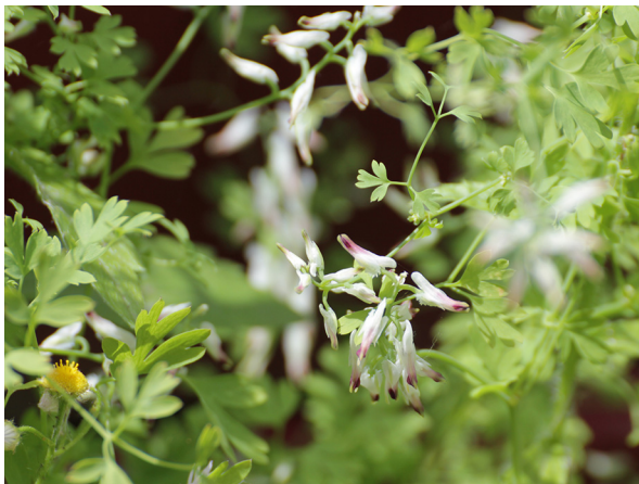
Abb. 37: Fumaria capreolata in Köln-Mülheim (B. RÖTTERING).

Kreis Soest, Soest (4414/21): 25–30 blühende und über 10.000 junge Pflanzen (z. T. rasenförmig) im Clarenbachpark (ehemals Walburger Friedhof), 10.03.2019, H. J. GEYER & A. SCHMITZ-MIENER. – Kreis Düren, Stockheim (5205/13): eine Pflanze auf dem Friedhof, 16.03.2019, F. W. BOMBLE & N. JOUBEN. – Kreis Düren, Ginnick (5205/34): eine Pflanze auf dem Friedhof, 16.03.2019, F. W. BOMBLE & N. JOUBEN.