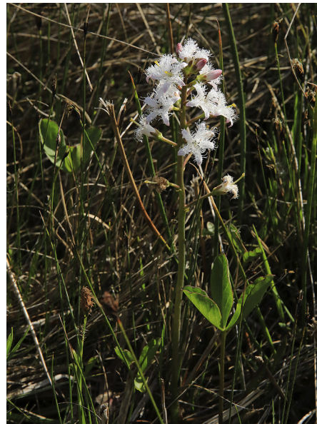
Abb. 2: Menyanthes trifoliata, blühend (Mindelsee/BW, 29.04.2018,).