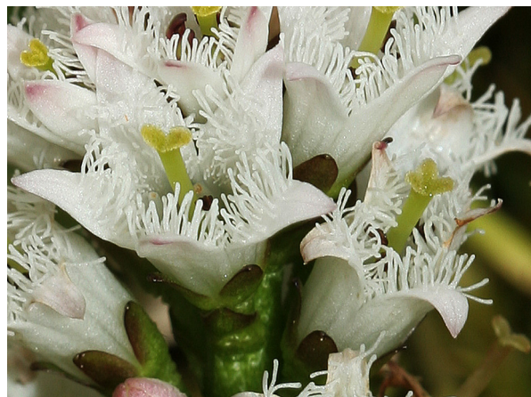
Abb. 10: Menyanthes trifoliata, Blütenstand (Herstinger Ried/BY, 11.05.2008,).