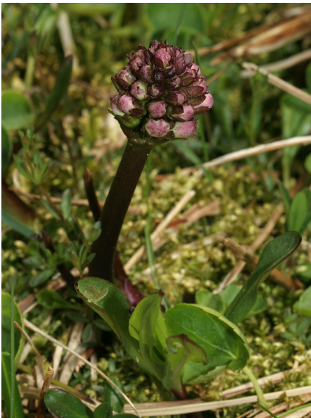
Abb. 7: Menyanthes trifoliata, Blütenstand (Herstinger Ried/BY, 11.05.2008,).