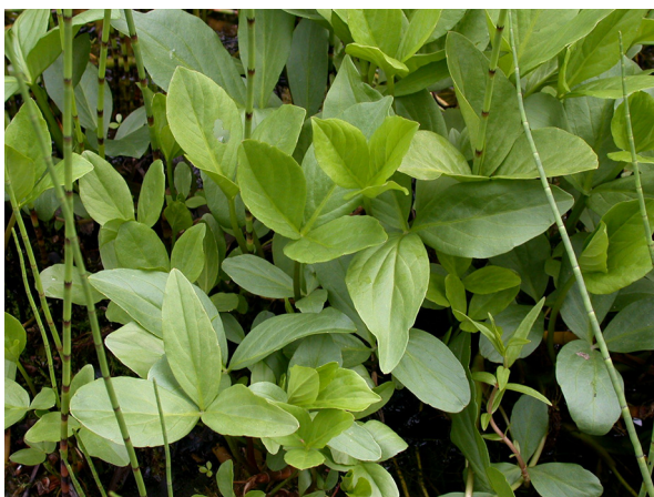
Abb. 5 & 6: Menyanthes trifoliata, Blätter (Bochum, in Kultur, 23.03.2003, Kleintettau/BY, 28.05.2011,).