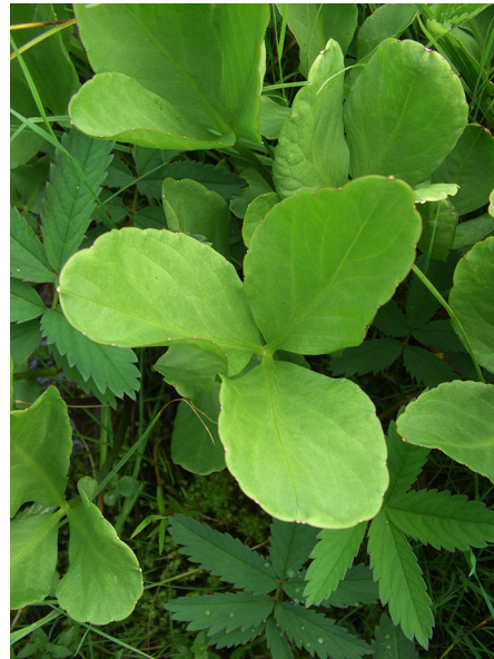
Abb. 16: Menyanthes trifoliata am Moosberg/BW mit Comarum palustre (09.06.2012,).