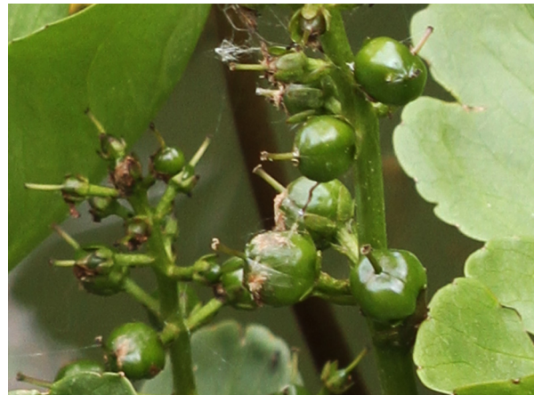
Abb. 14: Menyanthes trifoliata, unreife Früchte (Kleintettau/BY, 28.05.2011,).