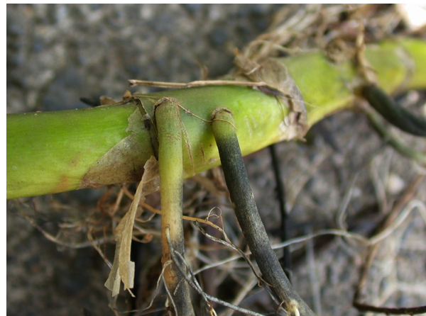
Abb. 4: Menyanthes trifoliata, Rhizom mit Wurzeln (Bochum, in Kultur, 12.06.2003,).