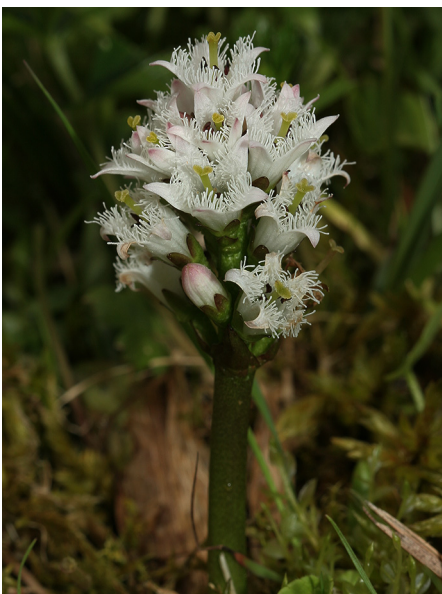
Abb. 9: Menyanthes trifoliata, Blütenstand (Herstinger Ried/BY, 11.05.2008,).