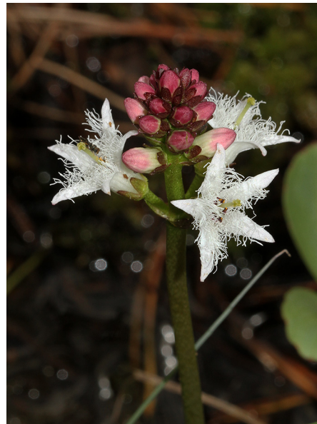
Abb. 8: Menyanthes trifoliata, Blütenstand (Kleintettau/BY, 17.05.2012,).