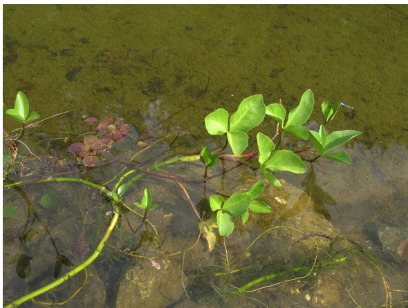
Abb. 18: Menyanthes trifoliata, eingebracht in einen neu angelegten Teich (Grube 7, Ratingen, 08.06.2013,).