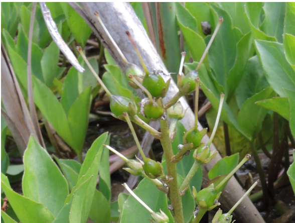
Abb. 13: Menyanthes trifoliata, verblüht (Wuppertal, NSG Eskesberg, 15.06.2014,).