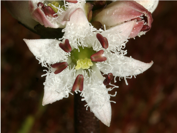
Abb. 11: Menyanthes trifoliata, kurzgrifflige Blüte (Herstinger Ried/BY, 11.05.2008,).