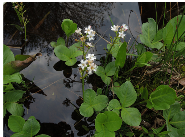
Abb. 19: Menyanthes trifoliata, in einem Gartenteich (Witten, 30.04.2014,).