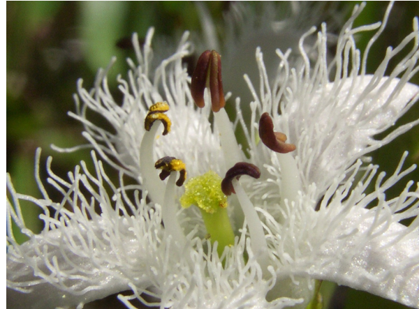
Abb. 12: Menyanthes trifoliata, kurzgrifflige Blüte (Witten, in Kultur, 04.05.2006,).