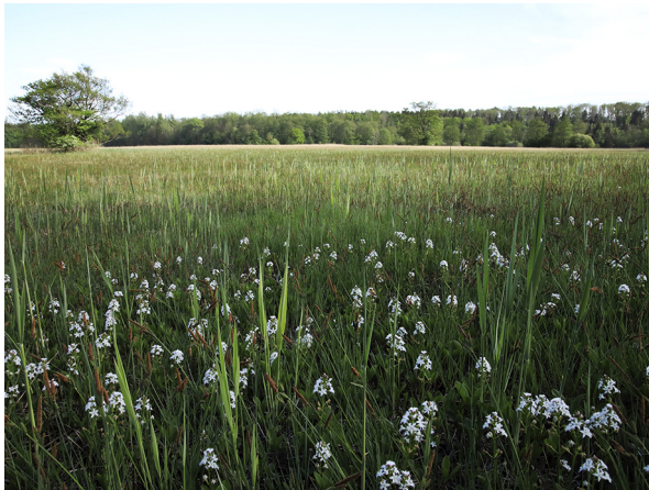
Abb. 15: Menyanthes trifoliata in der Verlandungszone des Mindelsees/BW (29.04.2018,).