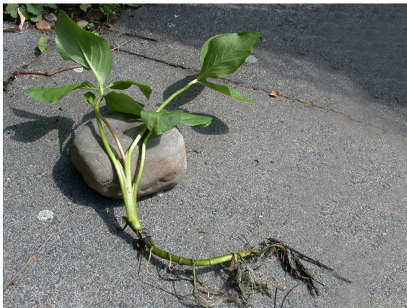
Abb. 3: Menyanthes trifoliata, gesamte Pflanze (Bochum, in Kultur, 12.06.2003,).

Der Fieberklee ist eine ausdauernde Wasser- oder Sumpfpflanze mit einem im torfigschlammigen Boden kriechenden, dicht verzweigten Rhizom, das bis zu 2 m lang werden kann. Nur die untersten Teile bilden Wurzeln und verankern so den Fieberklee im Untergrund, während der Rest frei ins Wasser ragt (Abb. 3 & 4).