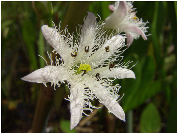
Abb. 1: Menyanthes trifoliata, Blüte (Witten, in Kultur, 04.05.2006,).

Es bleibt also zu erwarten, dass wir 2020 die attraktive Blüte des Fieberklee bei klimapolitischen Themen in den Medien häufig zu Gesicht bekommen, jedenfalls häufiger als wir sie am natürlichen Standort bewundern können.