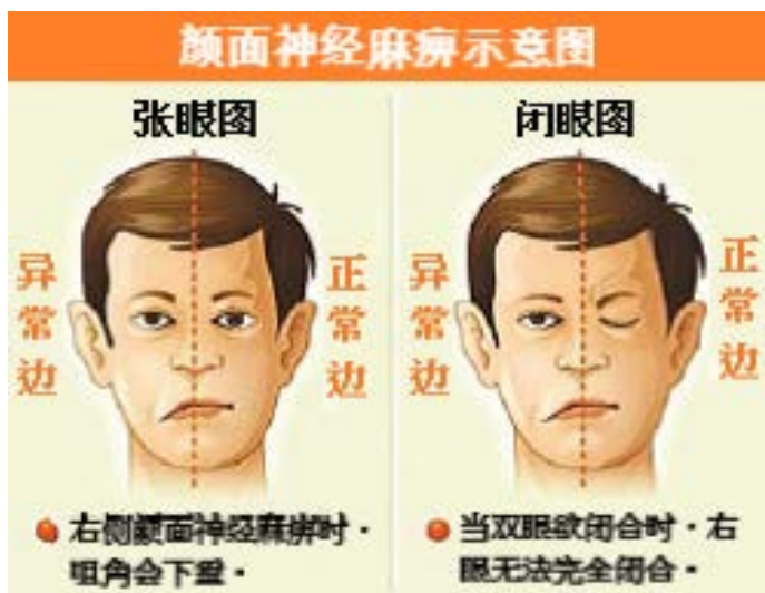
■ 颜面神经麻痹示意图。

另一种则是周边型面瘫。周边型以「贝尔氏麻痹症」最常见，是脑干神经核以下的第七条颅底神经线受损，使到同侧面神经瘫痪，因此临床上常造成同侧整张脸完全麻痹，无法做脸部动作，其中最常见的是「特发性面神经麻痹」，也称为「贝尔氏麻痹」(Bell's Palsy)，据统计每年香港在700万人中，大约有1,000至3,000个病例。