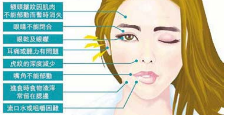
■ 贝尔氏面瘫常见症状。