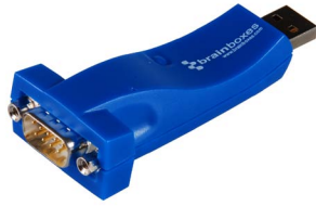
USB - Soros - Asztali