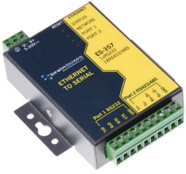
Ethernet - Soros