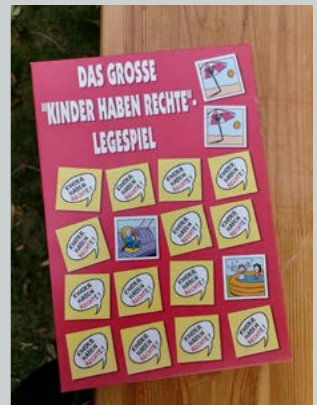
Text und Fotos: WRG Solidarisch