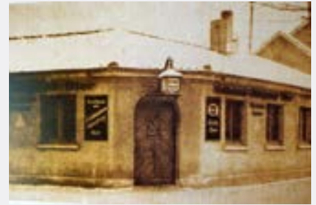
Abb. 1: Das Lokal Wilhelmitor-Kasino 1938. Quelle: Buch Historische Gaststätten von Klaus Hoffmann Abb. 2: Auszug aus der Schadenskarte, das betreffende Gebäude ist rot umkreist. Archiv Klaus Hoffmann Abb. 3: Heutige Ansicht Bergfeldstraße 18, vom Frankfurter Platz aus. Foto Heiko Krause Abb. 4: Heutige Ansicht Bergfeldstraße 18, von der Bergfeldstraße aus. Foto Heiko Krause