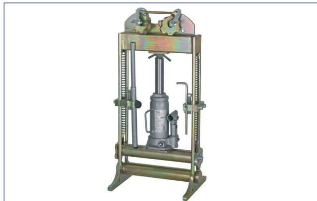
Outil d'écrasement hydraulique/Schiacciatubi idraulico Ø 75-160 mm