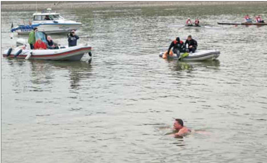
A szupermaratonista, hosszútávúszó és kerékpárversenyző rendőrcsónak és a Budapesti Evezős Egyesület kielboatjai kíséretében érkezett a rakpartra