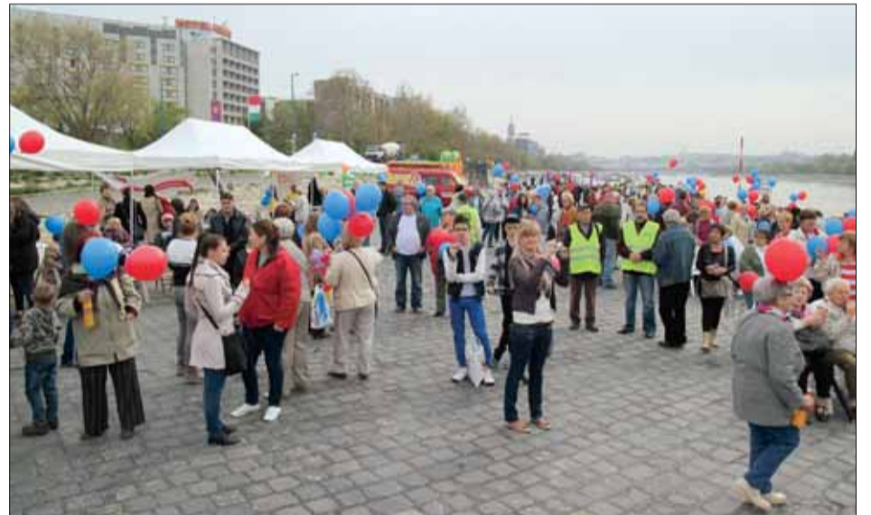
A jelentős számú érdeklődőt ugrálóvár, trambulín, népi játékok, lufit hajtogató bohóc is szórakoztatta